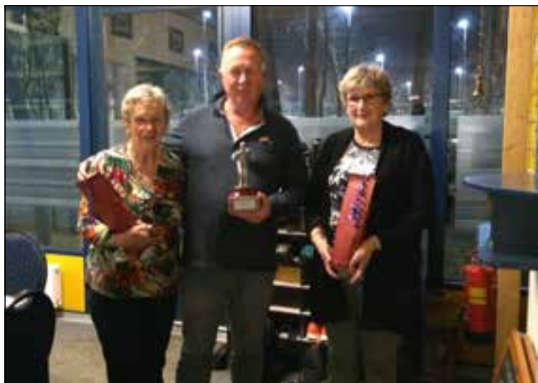
Winnaars wintertoernooi.

Voortstellingen zijn op vrijdag 12 april 20.00 uur; zaterdagavond 13 april 20.00 uur en zondagmiddag 14 april 14.30 uur. Alle keren is de zaal een half uur voor aanvang open. Locatie: De Natte, Millingen aan de Rijn, Heerbaan 117 in Millingen aan de Rijn. Kaarten á 8.50 euro zijn vanaf 30 maart te koop bij de Primera in Millingen aan de Rijn.