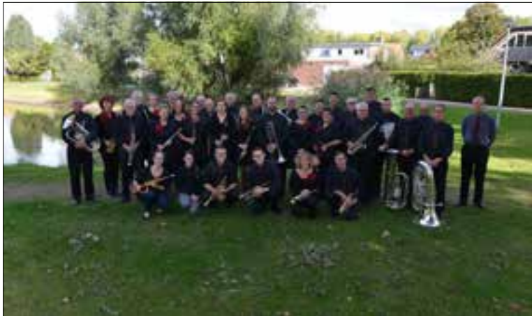
Muziekvereniging Ooijse toekomst.