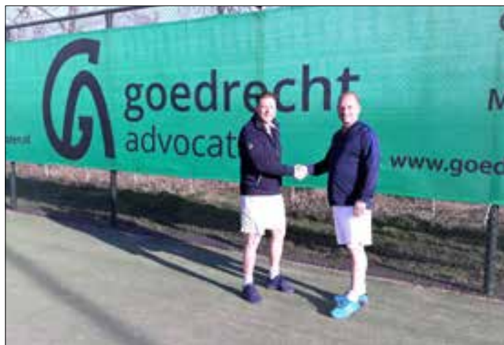
Overhandiging sponsordoek.