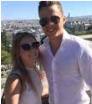
Nog een kanjer die op 1 april zijn 24ste verjaardag viert.