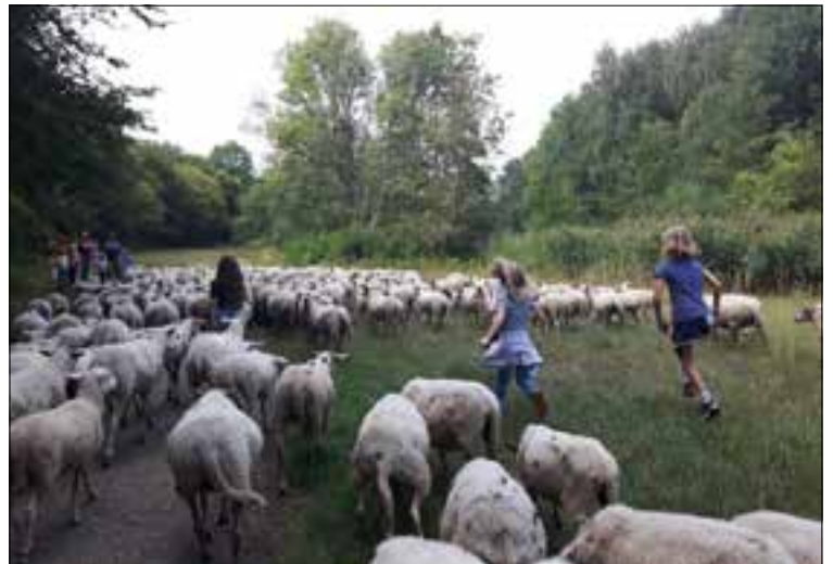
Schapen drijven.

De tocht begint om 14.00 uur en is geschikt voor kinderen tussen de 7 en 11 jaar. Rond 16.00 uur is het weer afgelopen. Kinderen mogen alleen komen, maar als papa of mama het ook leuk vinden mogen die uiteraard ook meekomen, maar dat hoeft niet. Ze moeten dan ook een kaartje kopen. Kinderen van Oerr of leden betalen 4 euro en niet-leden betalen 7 euro per persoon. Zorg dat je warme kleding en stevige schoenen aan hebt. Honden mogen niet mee. Opgave is verplicht, via www.natuurmonumenten.nl/heumensoord . Er kunnen maximaal twintig kinderen meedoen.