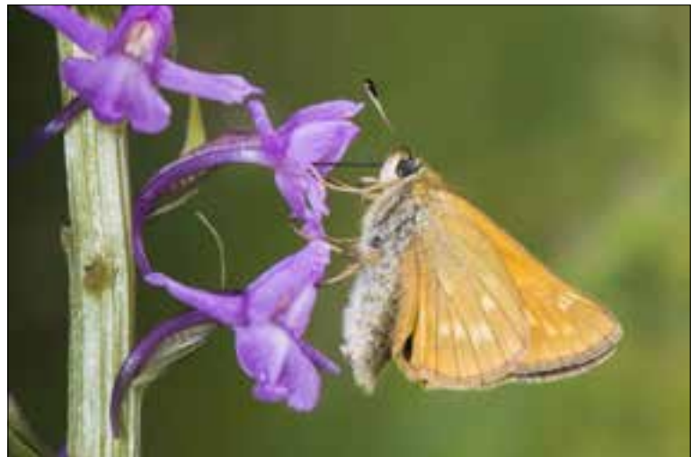
Orchidee met vlinder.

Niet alleen bij een diamanten paar komen wij; ook voor briljant (65 jaar), platina (70 jaar), albast (75 jaar) en eik (80 jaar) komen wij graag naar u toe voor een reportage en foto. De komst van een verslaggever en fotograaf voor deze gelegenheden kost helemaal niets; dat is service van Hét GemeenteNieuws.