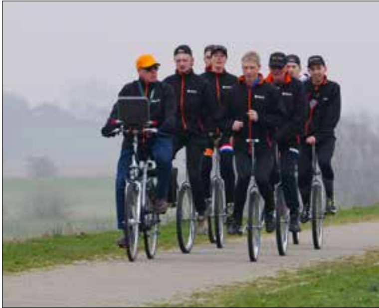
Training op de dijk tussen Duffelward en Bimmen.