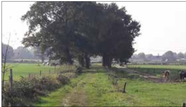
De eikenlaan op de Kievitshofdam.

Na de eerste landschapsconferentie van de Gemeente Heumen in 2014 ontwikkelde het Erfgoedplatform Heumen de eerste ideeën over natuurontwikkeling in combinatie met struinroutes. De zogeheten Kievitshofdam ten noorden van Overasselt en Heumen bleek een geschikt gebied hiervoor. De dam heeft gediend als grens tussen de oude gemeenten Heumen en Overasselt en de bijbehorende poldergebieden. Een cultuurhistorisch belangwekkend stukje landschap dus. De Kievitshofdam was tot voor