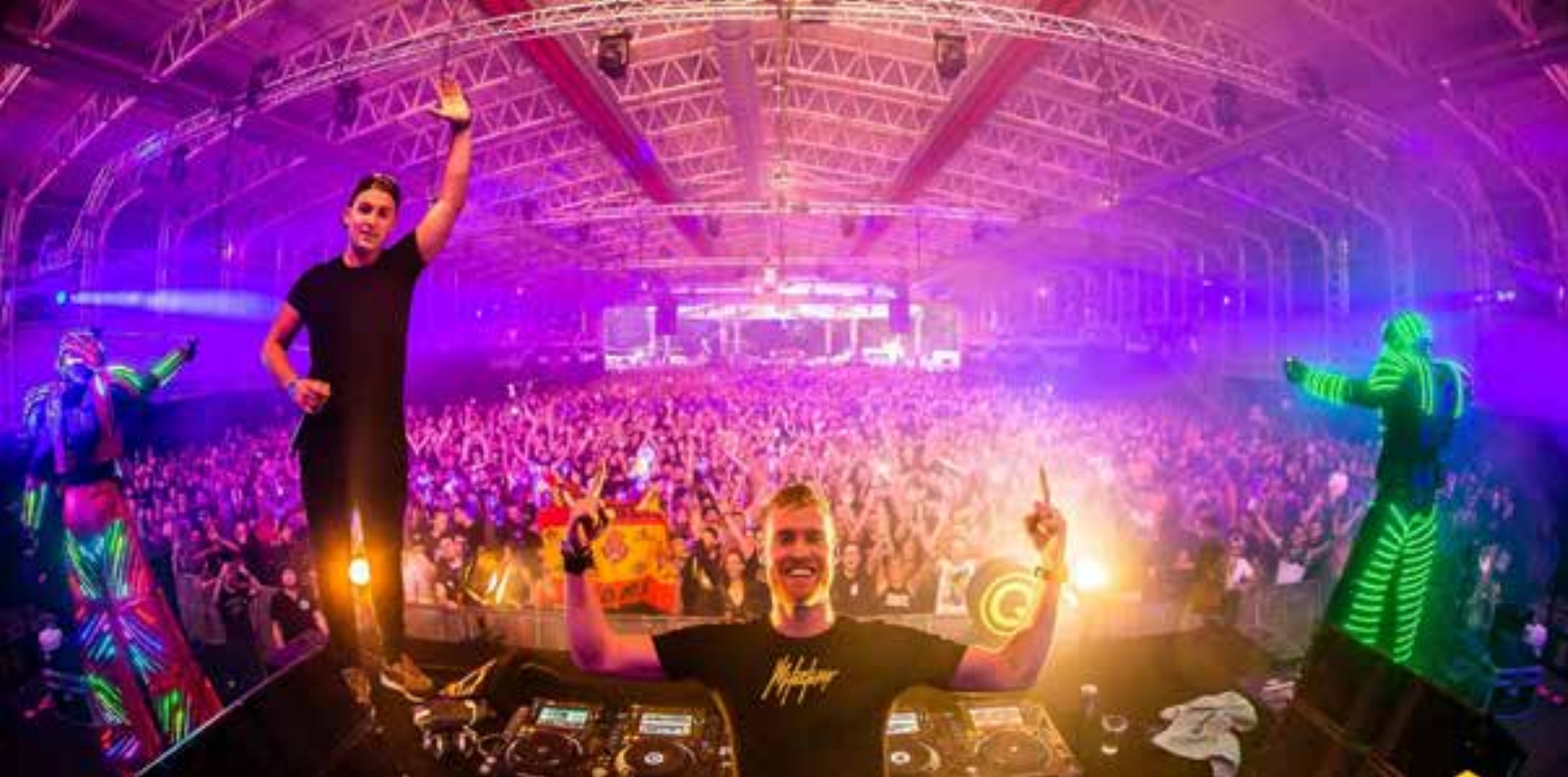
“Mijn melodieën zijn altijd vrolijk, de geluiden eromheen maken het duister.”