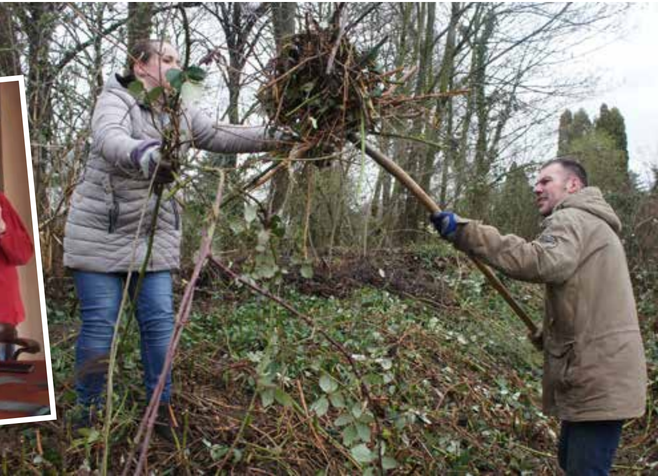
De vrijwilligers in Loo lieten zich door het slechte weer niet uit het veld slaan. Rondom de Dorpsnoot snoeiden zij dat het een lieve lust was.