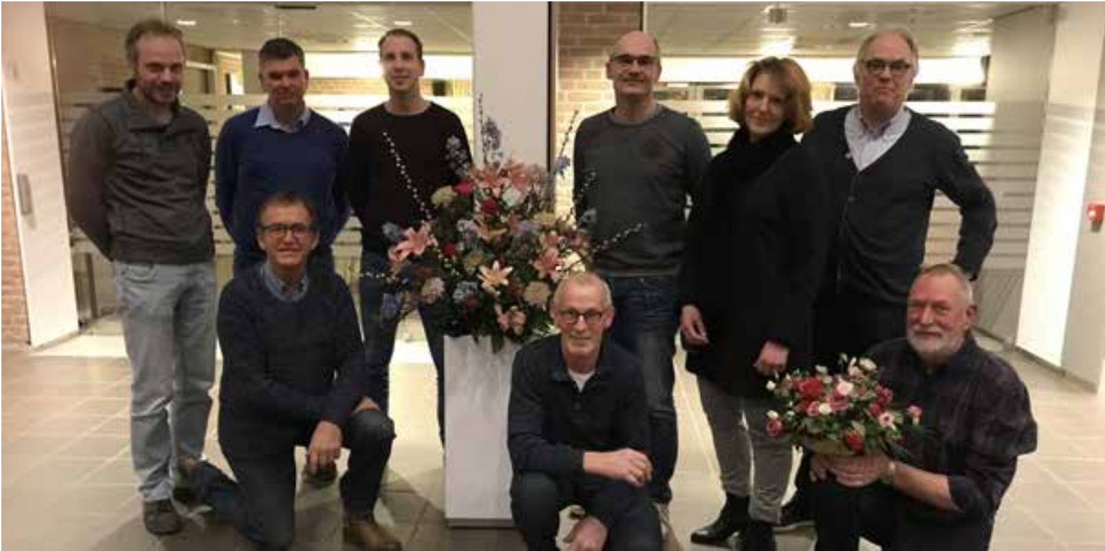
Groessen bloeit: “We willen inwoners bij onze groep betrekken om zo samen onze doelen te bereiken.”