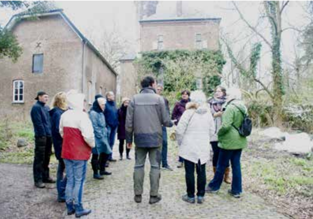
De vrijwilligers op Landgoed Huis Sevenaar werden na afloop van hun werkzaamheden getraakteerd op een rondleiding.