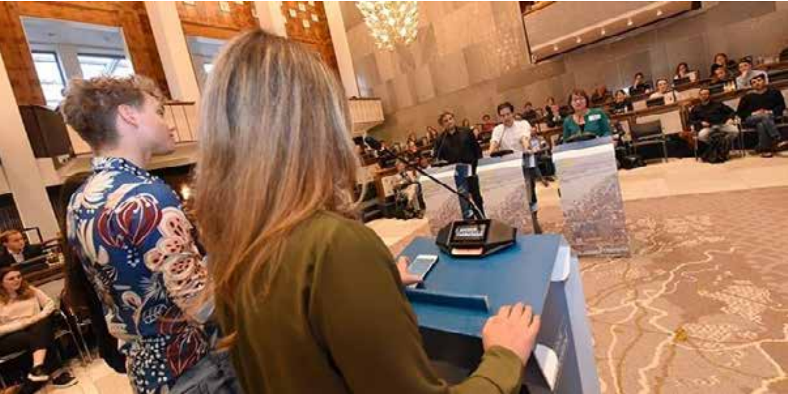
De teams werd feestelijk ingeluid op het provinciehuis.

Na afloop van de succesvolle ‘Nacht van de Acht’ heeft HopeXXL een waslijst aan goede ideeën en mogelijke nieuwe initiatieven. Deze zogeheten ‘Tr8-projecten’ omvatten dingen van groot tot klein. Van spreuken en gezegdes on-deraan je kassabonnetje, tot ‘flexflats’ waar jong en oud samen kunnen wonen. Om deze Tr8-pro-jecten te bekrachtigen zullen jongeren op scho-len zoals het Candea College in Duiven en het Liemers College in Zevenaar een eigen ‘School-team-8’ vormen. Zeven leerlingen, waaronder een begeleider, hebben de vrije keuze uit (ruim) tachtig Tr8-projecten om zo zelf bezig te gaan in de wereld om hen heen en in de tussentijd ook nog wat op te steken van de vele samenwer-kingspartners van de stichting HopeXXL. Woensdag 13 maart verrichtte YouTuber Tim Hofman de aftrap. Eerder die middag was hij