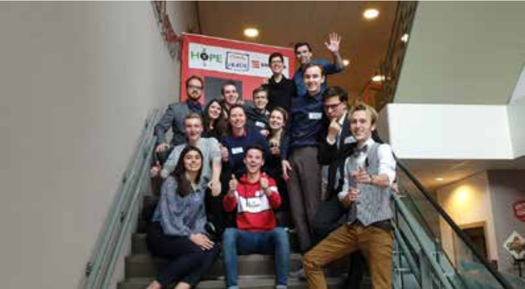
“Deze overwinning smaakt naar meer”