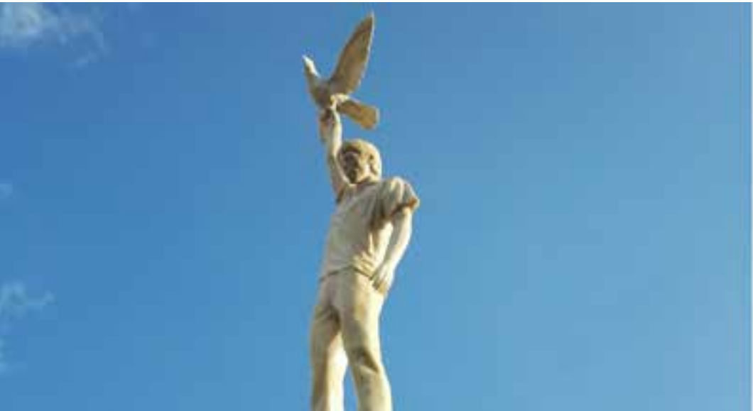
"Dat is wat we het plein in Duiven wilden geven," zeggen de kunstenaars

Het bestaat uit een man en een vrouwenfiguur die lijken aan te komen vliegen, hangend aan de poten van een grote duif. Ze staan allebei op een zuil van 3 meter, wat de maximale hoogwaterstand is bij overstromingen van de rivieren die de Liemers omringen. De kunstenaars hebben zich laten inspireren door de klassieke stadspijnen van Europa. De pleinen omgeven door wat historische gebouwen, waar alles zich samenvoegt met een klassieke fontein of een sculptuur op een hoge sokkel. "Dat is wat we het plein in Duiven wilden geven," zeggen de kunstenaars. De beelden staan