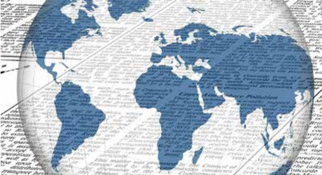
De BBC en The Guardian zetten wereldproblemen op de kaart

filmpje kan gebruiken bij het rouwen. Het Britse dagblad is ook bezig met interessante dingen, die vergelijkbaar zijn met BBC. The Guardian behandelde uitvoerig de plannen van het Amsterdamse stadsbestuur, die gingen over de extreem hoge huizenprijzen in de stad. Zij willen hun plannen aangrijpen om de prijzen te laten dalen. Nog een voorbeeld is een verhaal dat gaat over Jeze-di-vrouwen die tot slaaf werden gemaakt door terreurclub ISIS. Nu zijn de vrouwen wel vrij. Samen bouwen ze een vrouwelijke leefgemeenschap Jinwar op. Dit soort veranderingen in de journalistiek zorgen ervoor dat zij niet alleen worden gezien als mensen die alleen mediaproducties maken over problemen. Ze laten ook oplossingen zien voor die problemen. World’s Best News staat er ook niet alleen voor om langlopende trends aan het licht te brengen, maar juist ook het schetsen van oplossingen. De naam World’s Best News betekent dan ook ‘Verantwoordelijke Journalistiek’: de journalist neemt verantwoordelijkheid voor het wereldbeeld dat de lezer, kijker of luisteraar heeft of krijgt.