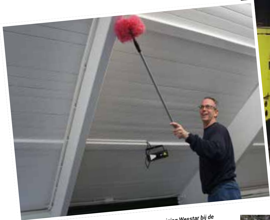
In Westervoort hielpen vijftien vrijwilligers bij korfbalvereniging Wesstar bij de opruim- en opknaptje van het clubhuis.

In Didam, de gemeenten Zevenaar, Duiven en Westervoort staken op 15 en 16 maart talloze mensen ondanks het slechte weer de handen uit de mouwen in het kader van NLdoet, de grootste vrijwilligersactie van Nederland. Een foto-impressie.