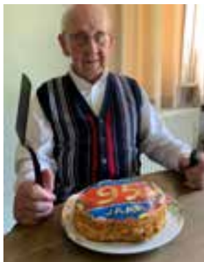
Het was héél bar Kjè!!