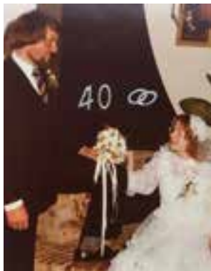
Al 40 jaar een gelukkig paar!!!