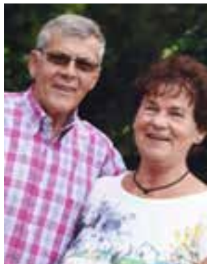
Pap en mam, 10 juni 50 jaar getrouwd! Wat een mijlpaal! Trots en dankbaar zijn we!