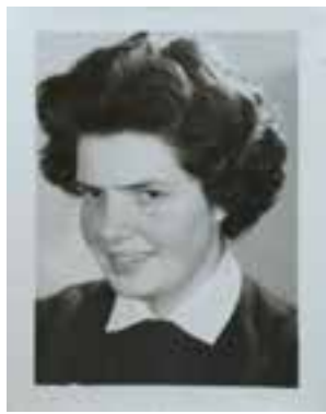
6 juni, Mam van harte gefeliciteerd