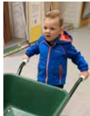
Deze Bob de Bouwer wordt 16 juni 4 jaar en gaat naar school.