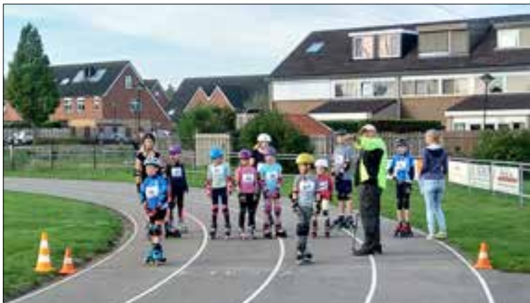
Klaar voor de start!