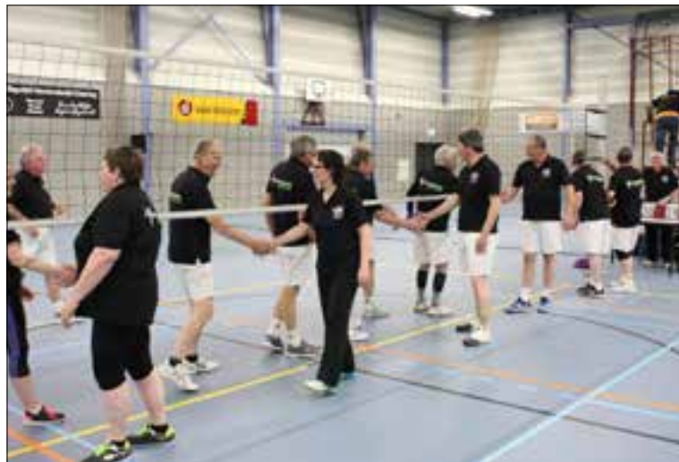
'We zoeken ook een beweegcoach / trainer. Iemand die in staat is deze groep van patiënten te begeleiden een deskundige op het gebied van sport en bewegen in relatie tot hart- en vaatandoeningen, en het liefst in bezit van een ehbo- en aeddiplooma en/of bereid tot het volgen van een cursus'.

De berichten dienen uiterlijk maandag vóór 10.00 uur binnen te zijn.