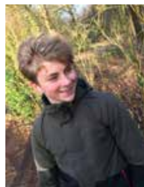
Deze jongeman wordt 14 juni 16 jaar.