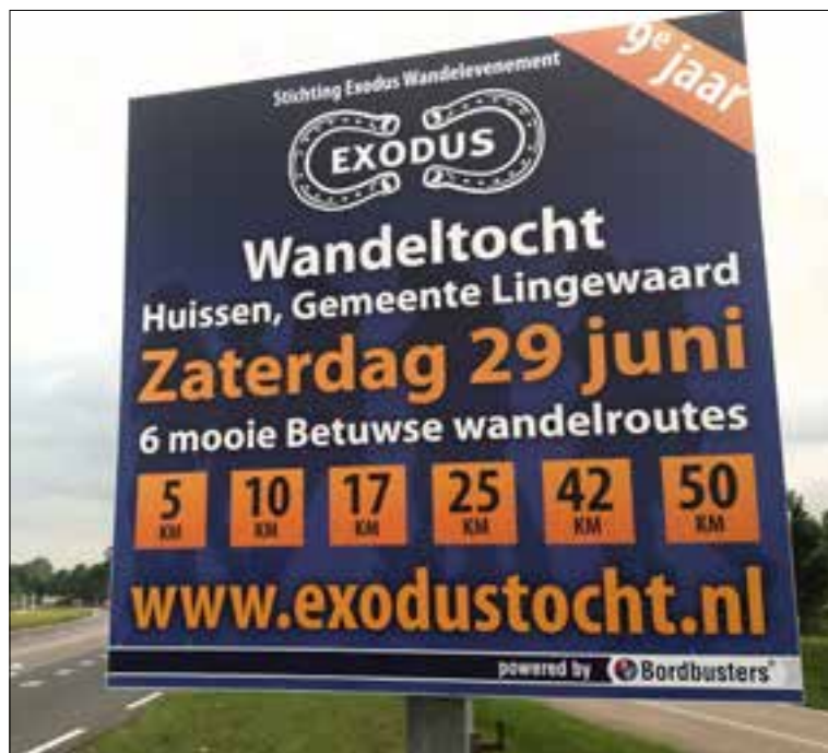
BordBusters plaatste weer de uitnodiging.

Routebeschrijving: ingang via Mariëndaal, zijstraat Utrechtseweg (N 225) tussen Arnhem en Oosterbeek, parkeren op parkeerplaats links en langs de weg voor het tunneltje onder de spoorlijn.