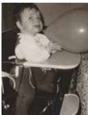
Baksje, bloas ze alle vijfzig mar vas op!!

Hoera voor het bruidspaar op 7 juni 2019