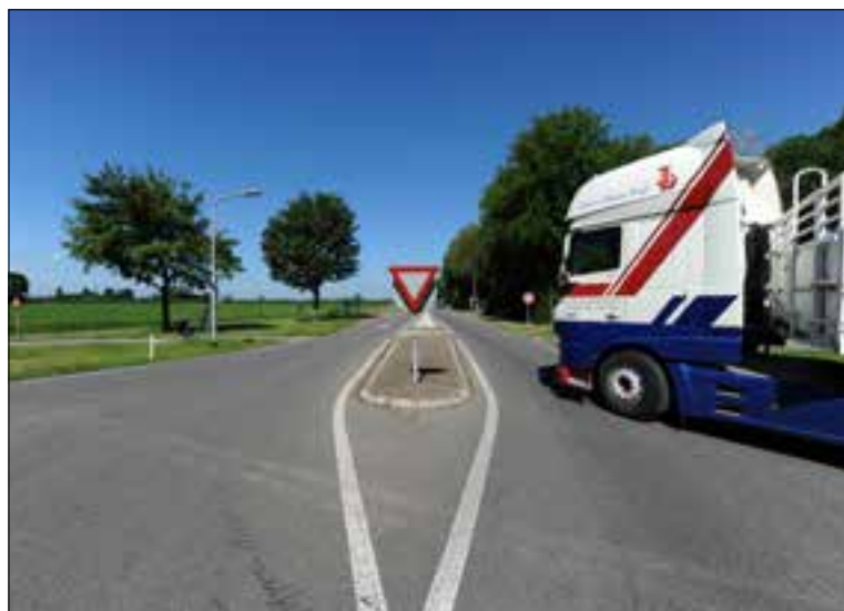
De 'rondweg van Lingewaard' in Angeren.

De doortrekking van de A15 zal ongetwijfeld voor overlast zorgen. Maar met deze actie wil het college 'hinder en klachten' tijdens de werkzaamheden zoveel mogelijk voorkomen. In de brief aan Rijkswaterstaat wordt nogmaals gepleit om het bouwverkeer over een alternatieve route te leiden. En dat kan volgens Lingewaard goed over het tracé van de door te trekken A15. Rijkswaterstaat verwacht dat de nieuwe weg uiterlijk 2024 gereed is.