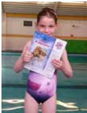
Het viel misschien niet altijd mee, maar je hebt nu tóch je diploma B. Goed gedaan meid, we zijn trots op je! Papa en mama