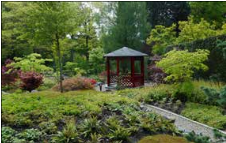
Open Tuin, Beekhuizenseweg 85 Velp.