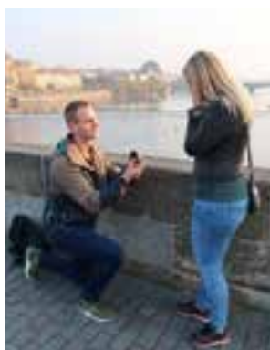
Van "schone"zoon naar schoonzoon...

Hoera voor het bruidspaar op 7 juni 2019