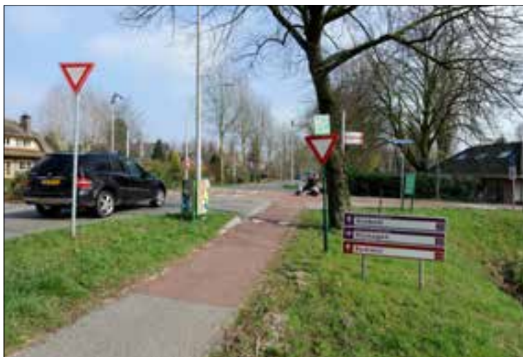
De wegversmalling en fietsoversteek verdwijnen al deze zomer. Het verkeer krijgt weer voorrang op overstekende fietsers.

Aanvankelijk zou de ontsluiting van Nijmegen Nood dwars door Res-