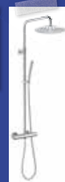
REGENDOUCHE RVS € 599,-