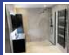
INLOOPDOUCHE vanaf € 169,- verschillende maten leverbaar