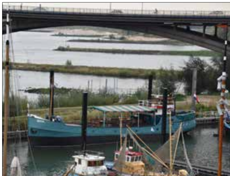
TS De Zeester in de Lindenberghaven, Nijmegen. (Rosalie Thomassen)

Tickets kosten vanaf 8,50 euro via www.altijdniemeegs.nl/gscf . TS De Zeester, Lindenberghaven 1d, Nijmegen.