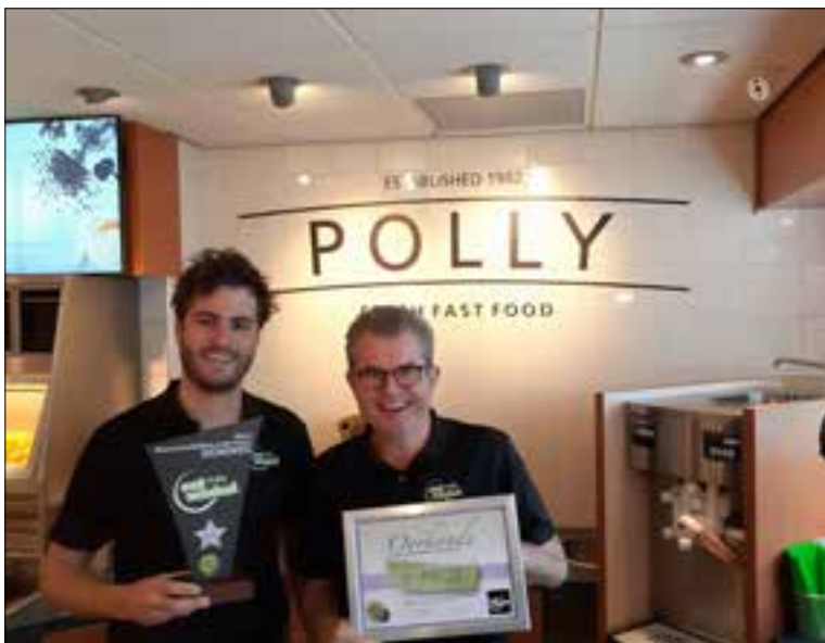
De trotse winnaars.

Het optreden is in De Viersprong, Reethsestraat 1 in Valburg van 19.30 - 21.30 uur. De zaal is open vanaf 19.00 uur. Kosten voor niet-leden zijn vijf euro.