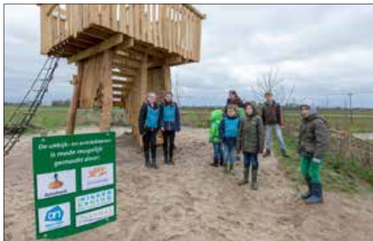
Kinderen van De Kikkerkoning openen de uitkijk- en ontdektoren van Landerij De Park.

"Landerij De Park vind je aan De Park 12 in Elst. En kom je graag op Landerij De Park? Steun dan de Makers! Kijk op landerijdepark.nl/ steundemakers en help mee."