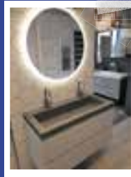
BADMEUBELEN vanaf € 499,- (inclusief spiegel)

www.reugebrink-opticiens.nl Hoofdstraat 15 Zetten 0488 - 45 45 08