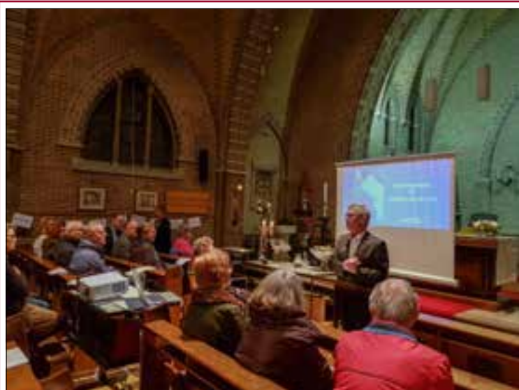
Lezing en presentatie over kruiswegstaties in Herberg de Aandacht in Heteren.