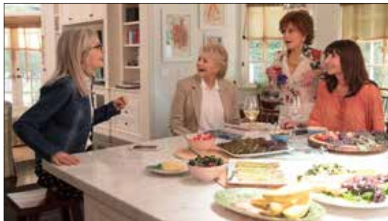
Book Club-feelgood film.