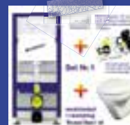
INBOUWSET COMPLEET met toilet + isolatiematje + drukpaneel + softclosing bril € 192,-