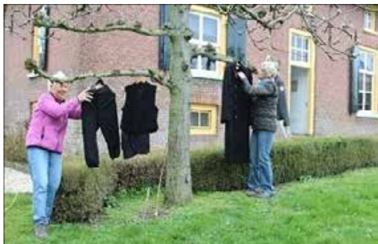
Vrijwilligers treffen voorbereidingen voor de start van een nieuw seizoen.

Elke dag het laatste nieuws uit uw regio op: www.gemeentenieuwsonline.nl