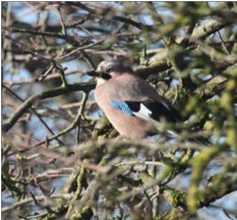
De knappe schreeuwekster heerlijk in het voorjaarszonnetje gezeten.