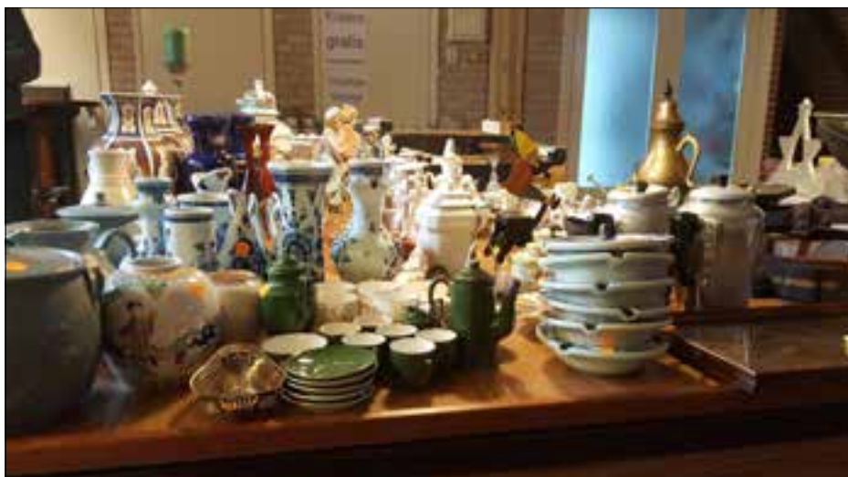
Rommelmarkt in dorpshuis Beatrix

De lente komt eraan en dan begint het toch weer te kriebelen om iets leuks met je huis te doen. Je wilt wel weer eens wat veranderen, al zijn het maar een paar vazen of andere spullen waar je wat op uitgekeken bent en waar je wel wat anders voor in de plaats wilt zetten. Maar ja, het moet natuurlijk niet te veel geld kosten. Dan is de oplossing snel gevon-