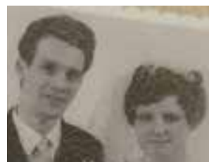
Pa en Ma Kuik al 50 JAAR een paar. Gefeliciteerd met deze heugelijke dag. Van de kinderen en kleinkinderen. XXX