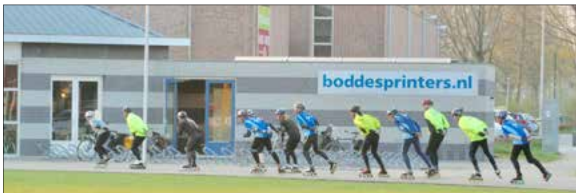
Na de training nog even uitrijden.

Tijdens de informatieavond staan kennismaking met de skeelersport en de vereniging centraal. Er is informatie over materiaal, bescherming en veiligheid, werkwijze van de trainingen en opzet en duur van het seizoen. En niet onbelangrijk: kennismaken met de trainers. Tijdens deze avond zijn ook de leden van b.o.d. De Sprinters welkom. Zij kunnen alvast een paar rondjes op de baan rijden. De nieuwe skeelers kunnen hun eerste rondjes op de eerste trainingsavond van het seizoen op donderdag 4 april (19.15-20.45 uur) rijden. Na de training kan er nog gezellig aan de bar