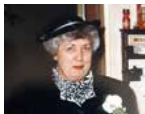
Allemachtig Onze Roos wordt ook al 80. Gefeliciteerd en zondag was het een geweldig feest.