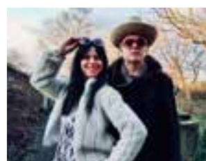
Jaja, het is echt waar, Dit paar is op 11 maart samen 100 jaar! Dat hebben ze goed voor mekaar. Gefeliciteerd. Dikke kus van jullie weten wel wie.