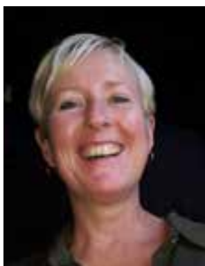
Ok al geet ze over t asfalt lankuut. Noar 50 joar nog steeds 'n strakke snuut