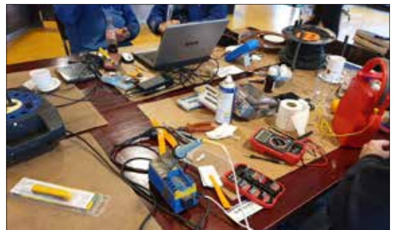
Elektronica ter reparatie.

ding. Het is de bedoeling dat men meekijkt met de reparatie of deze onder deskundige begeleiding zelf uitvoert. Gereedschappen en materialen zijn aanwezig. De reparatie wordt gratis uitgevoerd, een vrijwillige bijdrage wordt op prijs gesteld. En ook als je niets te repareren hebt, ben je van harte welkom om mee te helpen bij de reparatie van iemand anders of voor een gezellig praatje. Meer informatie staat op www.repaircafenijmegen.nl/noord .