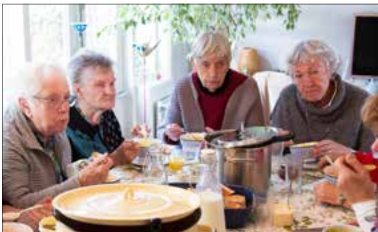
Deelnemers Eshof aan 'De Soeptafel'.

Ook in Elst komt er nu een zwerfafvalbrigade. Op 21 februari van 19.30 tot 20.30 uur is er een startbijeenkomst voor belangstellenden, op de Prins Hendrikstraat 5a in Elst. Er is koffie en thee. Stichting Landschapsbeheer Gelderland geeft een toelichting op praktische ondersteuning die zij bieden. Iedereen is welkom. Voor vragen of opmerkingen kunt u