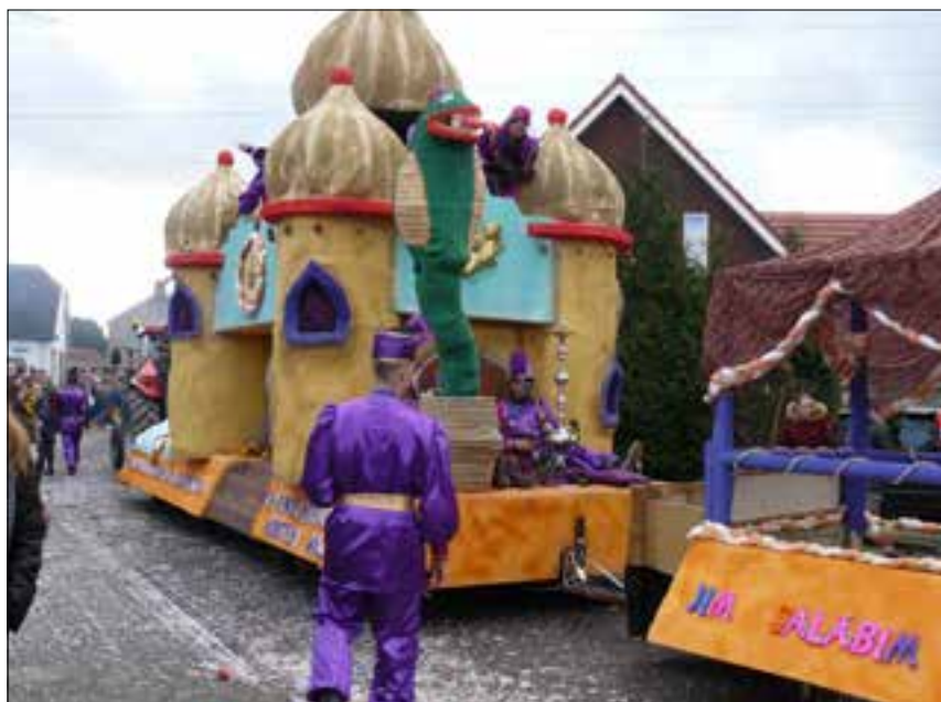
1e prijs wagens 2018

Rond de klok van 17.00 uur zal de prijsuitreiking plaatsvinden. Per categorie worden de winnaars bekend gemaakt. Tevens zijn er twee speciale prijzen. Als eerste de publieks-