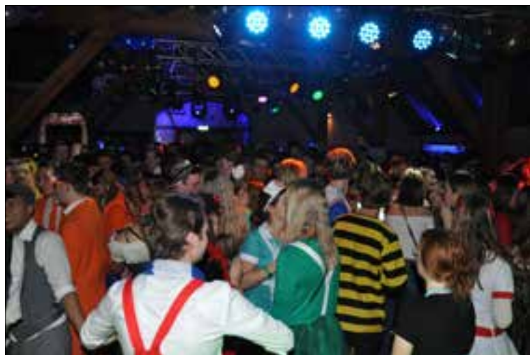
Groot carnavalsfeest op De Hucht.

Ook op zaterdagavond is er in de feesttent op Het Plein Tropical carnaval XXL voor de jeugd van 12 -17 jaar en op zondag aansluitend aan de Veko-optocht Duppertzondag met feestband De Bijtels. Deze beide activiteiten worden georganiseerd in samenwerking tussen de carnavalsverenigingen Zet 'm Op en De Batsers. Entreekaarten zijn verkrijgbaar bij AH Driessen en Bruna Herberts. Meer info staat op www.zetmop.nl , Facebook en Instagram.