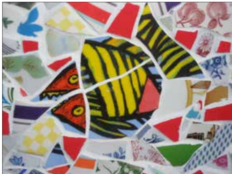
Mozaïeken: Dit kan het worden.

Telefoon 06 30764452 of wilteunissen1956@gmail.com of www.fortefit.nl .