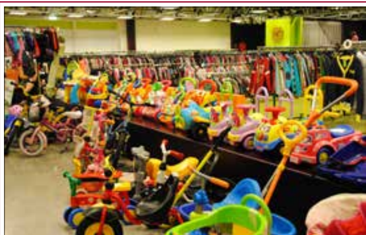
Beurs OBC.

Elke dag het laatste nieuws uit uw regio op: www.gemeentenieuwsonline.nl