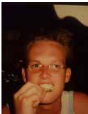
Deze kanjer wordt 50!