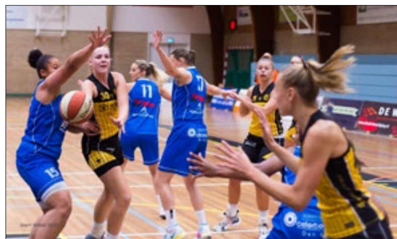
Grasshoppers verloor zaterdag tegen Dozy Den Helder. | Foto: Geert Bekker

Volgende week zaterdag spelen de dames uit tegen BC Utrecht Cange-roes.