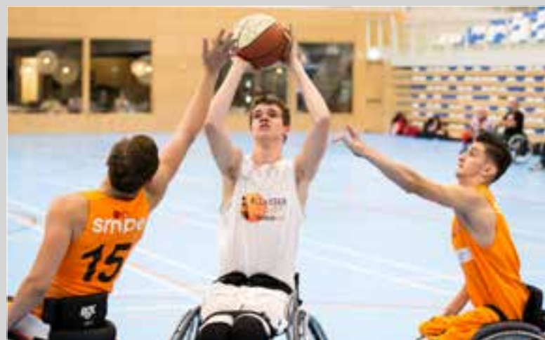
Volgende keer de belevenissen in Canada.

is best druk allemaal. Wel supergaaf om mee te maken. Ik train 2x per dag. Daarom is mijn VMBO-examenjaar in 2 jaar verdeeld. Vorige week ben ik voor deel 1 geslaagd!"