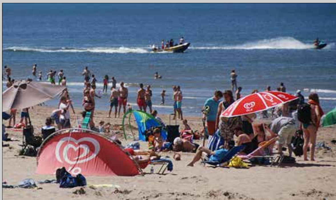
De bijna tropische temperaturen deden het strand vol stromen met vele zonzanbidders.