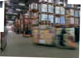
Samenwerken aan bevoorrading