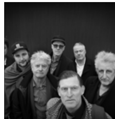
De Dijk wordt een grote publiekstrekker.

De organisatie iedereen daarom op om vooral vroeg naar het festivalterrein te komen, bij voorkeur lopend of met de fiets.