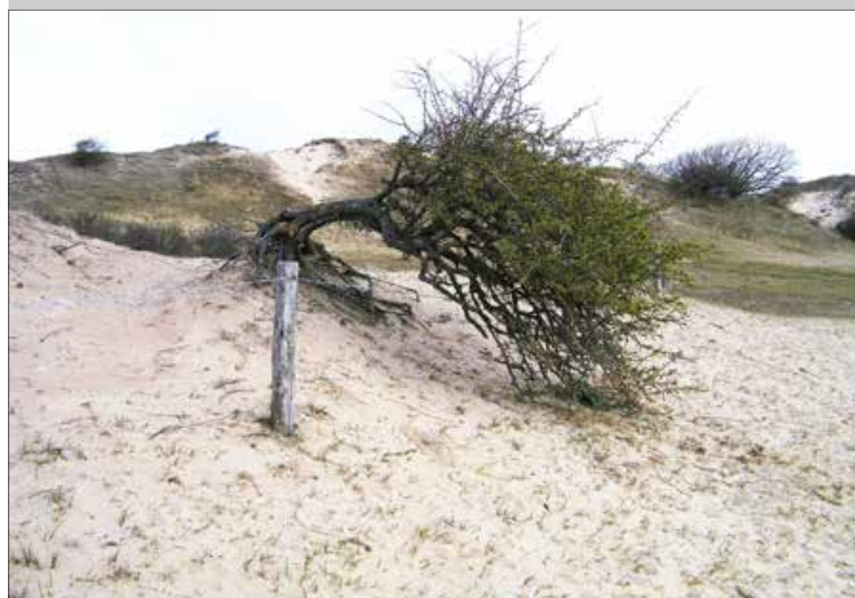
Het IVN start woensdag met een nieuwe serie zomeravondwandelingen do; or het duingebied Berkheide.