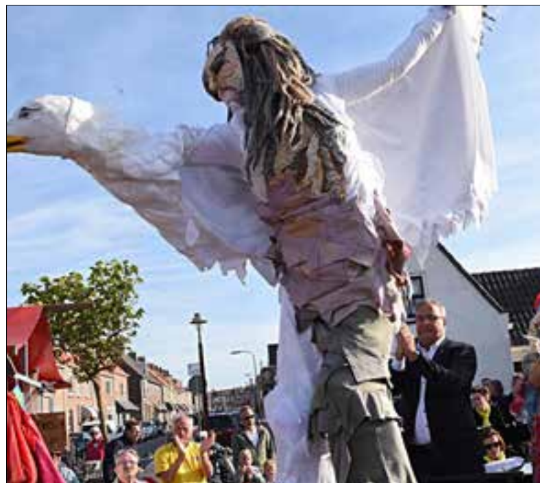
Tijdens de officiële opening verscheen deze krijssende meeuw op het Andreasplein.

Ook dit seizoen zijn er weer 10 marktdagen. Zoals afgelopen jaren zijn er ook thema's aan de markt verbonden. De eerste dag, vorige week dinsdag stond in het teken van creatief, de 'Creadag' en hieraan leek ook de officiële opening wel gerelateerd. Na een vrolijk muzikaal openingsnummer van Christelijke muziekvereniging de UNI, nam Van Rijn het woord en vervolgens nam een toverfee het van hem over. Met een toverstafje 'toverde' het tweetal een grote zeemeeuw op hoge poten tevoorschijn. Nou ja toveren; de opvallende verschijning had van tevoren het Andreasplein al enigszins verkend. Wel een 'voedzame' locatie voor een meeuw met al die terrasjes. Is het voer voor psychologen? Een openingsact met een meeuw, het beest dat door velen in de gemeente - om het maar eens netjes te zeggen - als ongewenste (bad)gast wordt verwenst. Overigens wel creatief bedacht deze openingsact die het nodige bekijks trok met deze blikvanger.