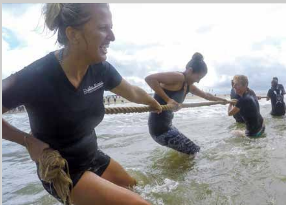
Vanaf nu kan men zich weer aanmelden voor het NK Touwtrekken in de Branding.

techniek. Alleen al in Holland-Rijnland zijn 6 andere projecten in voorbereiding, die van de ervaringen in dit project gebruik willen maken. Ook de Unie van Waterschappen heeft een programma lopen om de mogelijkheden van energie uit oppervlaktewater te verkennen, als onderdeel van een duurzame bedrijfsvoering van de waterschappen.