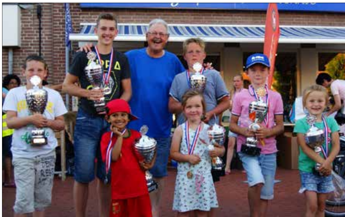
Prachtige grote bekens voor het verschalken van een mooie vangst.