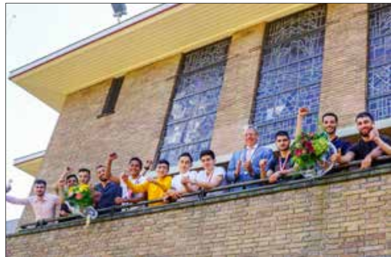
De kampioenen op het balkon van het gemeentehuis gehuldigd.