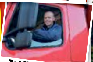
Zet jij graag een stapje extra?

Nieuwsgierig geworden? WERKENBIJLOGISTIEK.NL