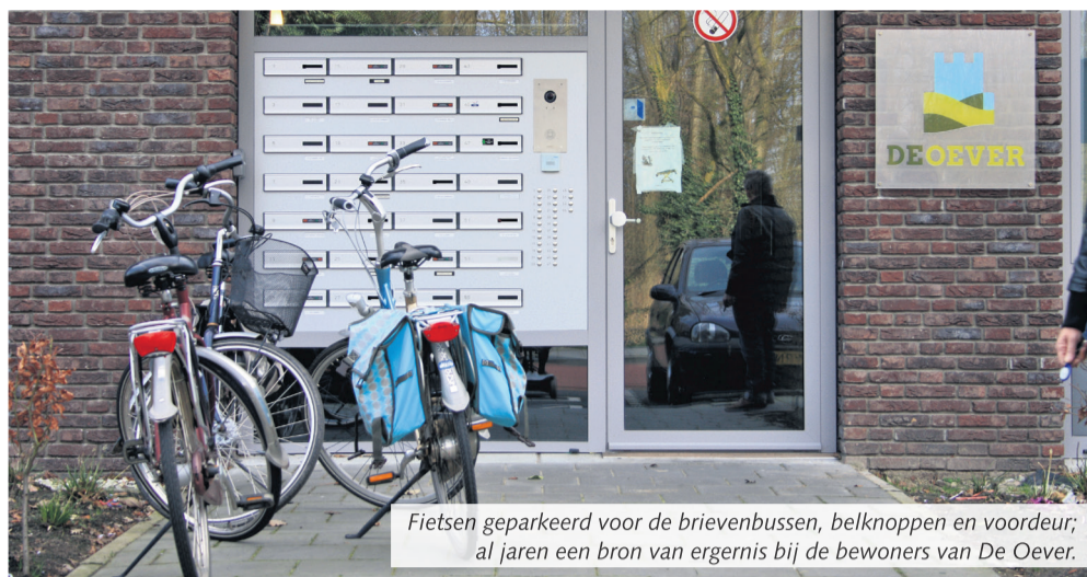
Fietsen geparkeerd voor de brievenbussen, belknoppen en voordeur; al jaren een bron van ergernis bij de bewoners van De Oever.

Beek en Donk – Voor de elfde keer vindt, op vrijdag 11 en zaterdag 12 maart, de landelijke actie van het Oranjefonds NLdoet plaats. Ook Laarbeek maakt zich op voor deze – inmiddels bewezen - succesformule.