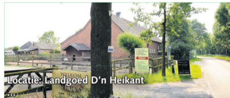
Locatie: Landgoed D'n Heikant