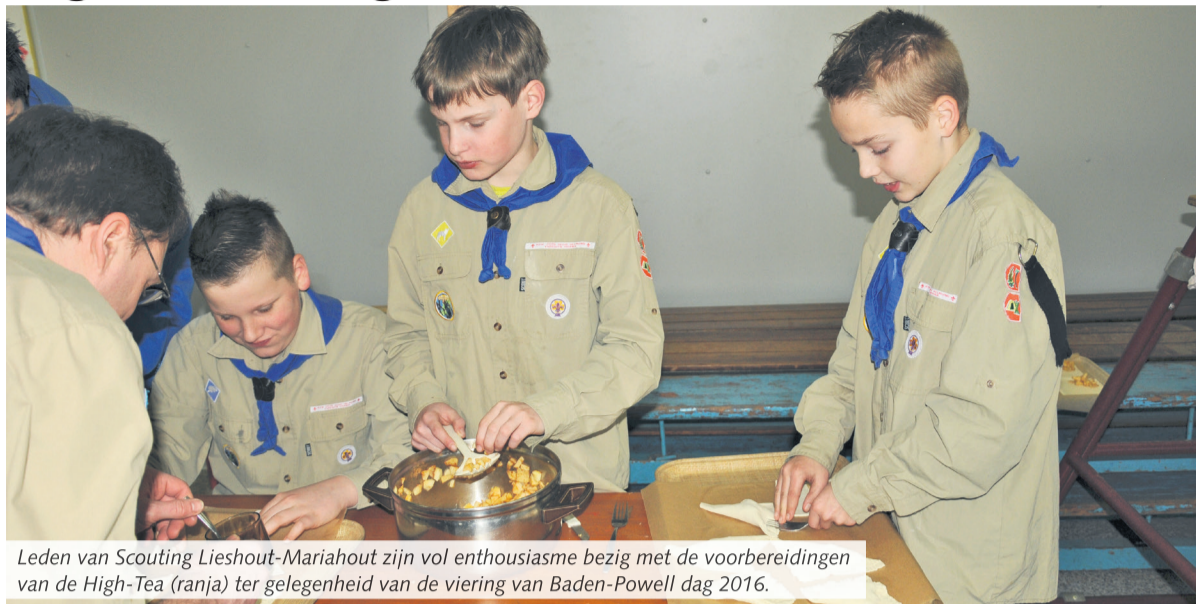
Leden van Scouting Lieshout-Mariahout zijn vol enthousiasme bezig met de voorbereidingen van de High-Tea (ranja) ter gelegenheid van de viering van Baden-Powell dag 2016.

Lieshout/Mariahout - Bij Scouting Lieshout-Mariahout werd op zaterdag 27 februari van 10.00 tot 13.00 uur de Baden-Powell dag gevierd. Op deze dag wordt de geboortedag (22 februari) gevierd van Sir Robert Baden-Powell; de oprichter van de scoutingsbeweging. Samen met zijn vrouw Olave Baden-Powell, die toevallig ook op dezelfde dag jarig was, heeft hij veel voor de scoutingbeweging betekend. Zijn geboortedag wordt dan ook door veel scoutingverenigingen aangegrepen om een speciale opkomst te organiseren.