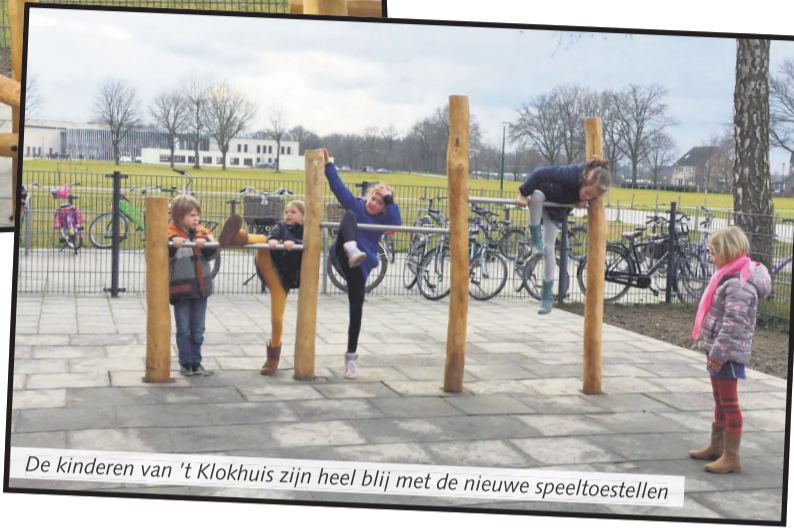
De kinderen van 't Klokhuis zijn heel blij met de nieuwe speeltoestellen