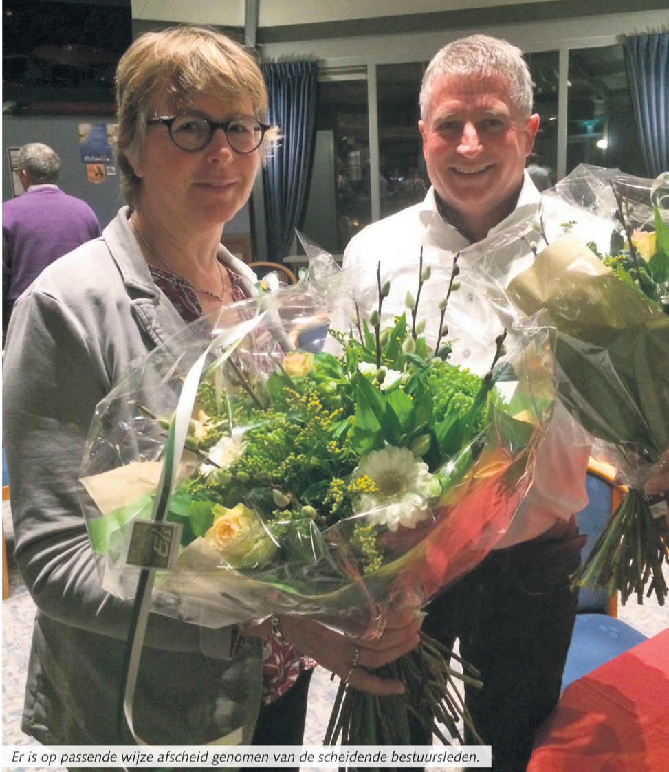
Er is op passende wijze afscheid genomen van de scheidende bestuursleden.