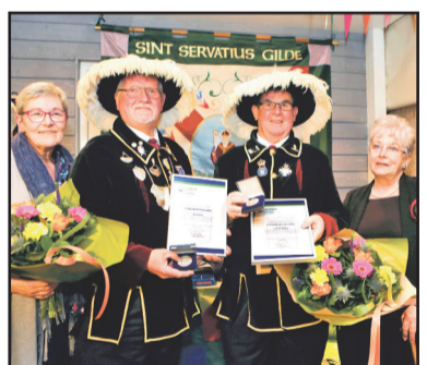
Vrijwilligerspenningen Pag. 11