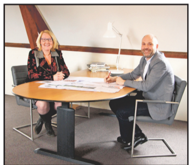
Pastorie Aarle-Rixtel Pag. 7