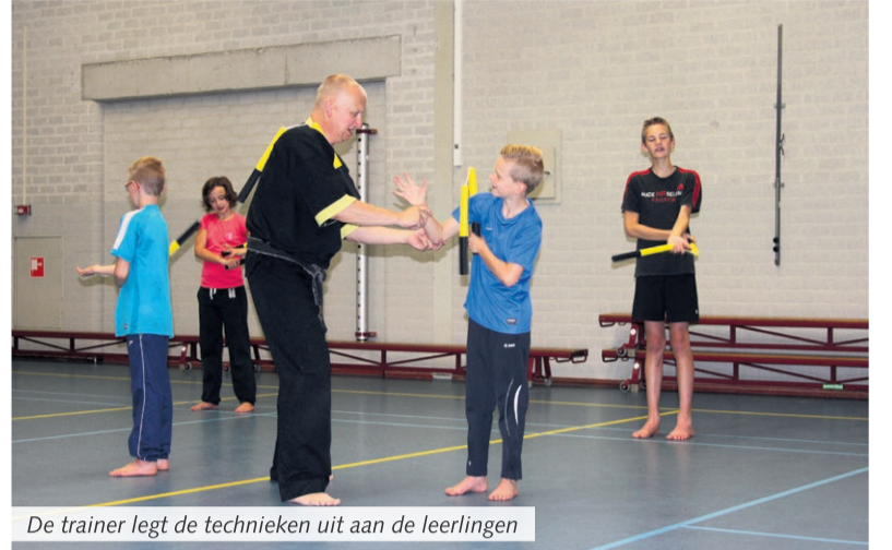
De trainer legt de technieken uit aan de leerlingen

Mariahout - De judoka's van Judoclub Mariahout namen zondag 26 juni deel aan de Japanse Dag. Na de opening van deze dag door het hijsen van de vlag met het nieuwe logo van de club onder de tonen van het Japans Volkslied (judo komt immers uit Japan), was er een uitdagende workshop Nunchaku verzorgt door Silvo Hoeks van 2Jam.