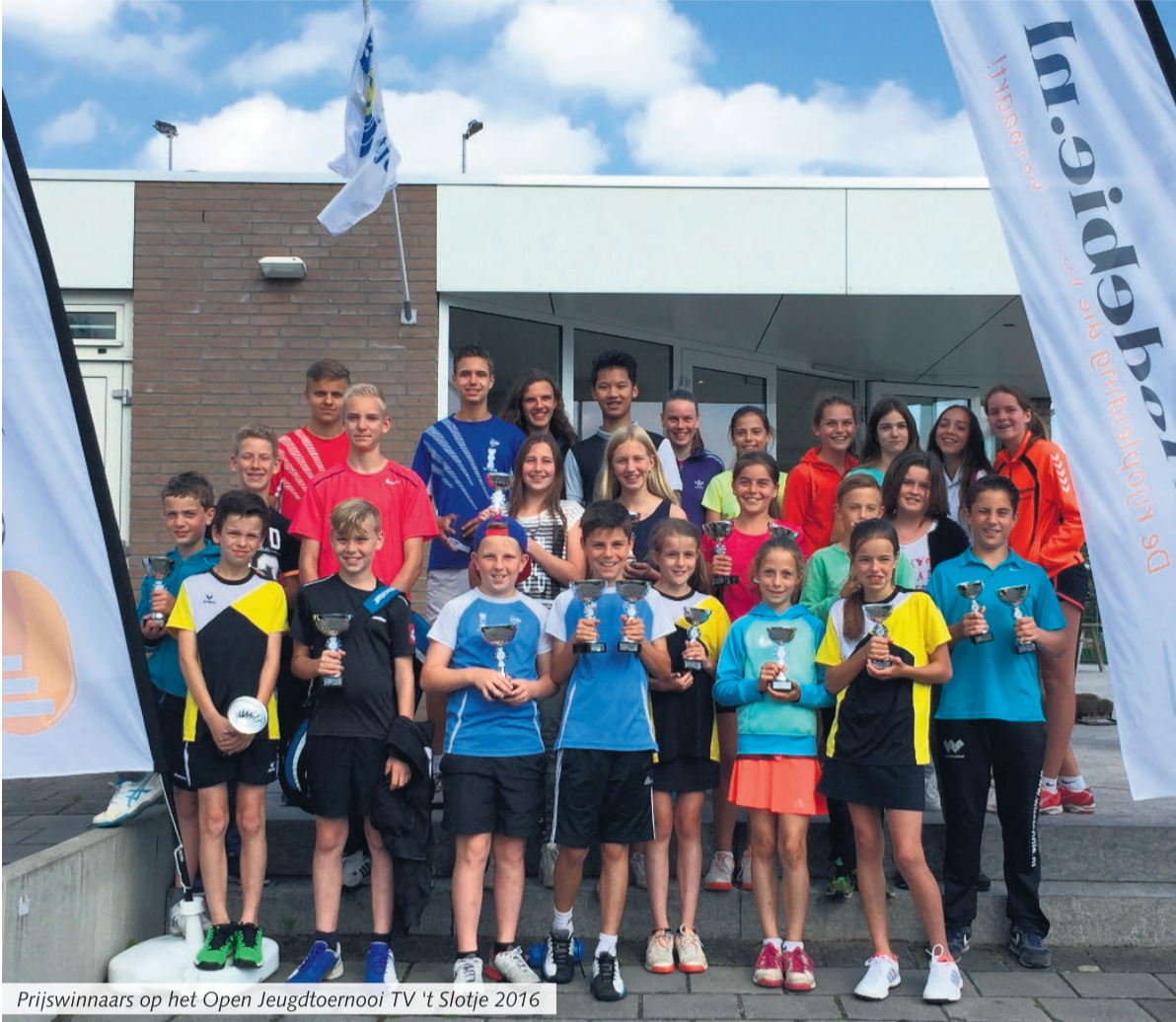
Prijswinnaars op het Open Jeugdtoernooi TV 't Slotje 2016

Beek en Donk - De finales van het Open Jeugdtoernooi van Tennisvereniging 't Slotje vonden zondag 26 juni plaats. De voorafgaande week hebben circa 90 deelnemers in de leeftijd van 10 tot en met 17 jaar hun poule en vervolgwedstrijden gespeeld in de diverse categorieën.