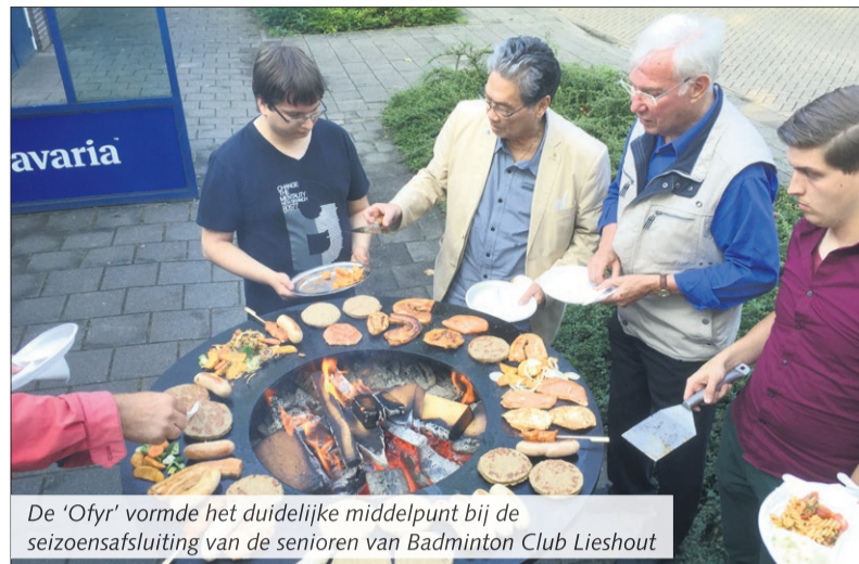
De 'Ofyr' vormde het duidelijke middelpunt bij de seizoensafsluiting van de senioren van Badminton Club Lieshout

De badmintonners hadden deze keer gekozen om niet té ver weg te gaan en hielden zich daarom op in, en nabij, de kantine van sporthal 'de Klumper'. Met een lounge-set en een professionele partytent buiten, en natuurlijk de Ofyr, was het goed toeven op de Papenhoef. Ook toen de onvermijdelijke plensbui, die dit voorjaar kenmerkt, naar beneden kwam,