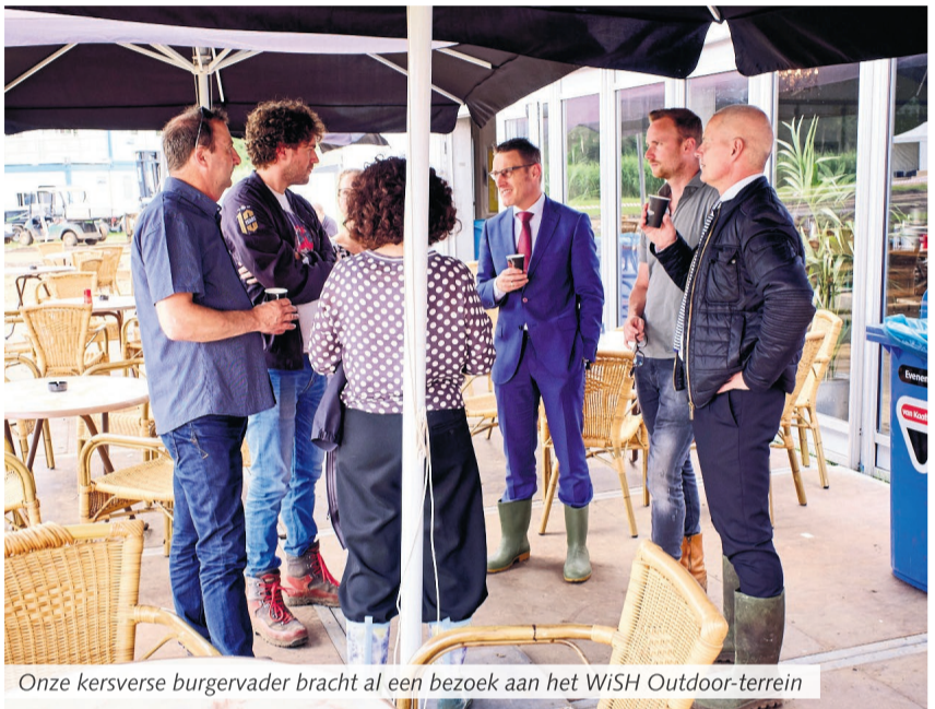
Onze kersverse burgervader bracht al een bezoek aan het WiSH Outdoor-terrein