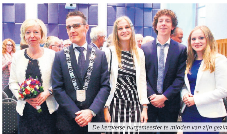
De kersverse burgemeester te midden van zijn gezin

"Dit zijn kenmerken die bij mij passen. Laarbeek is een natuurlijke omgeving met een rijk verenigingsleven. Ik wil me