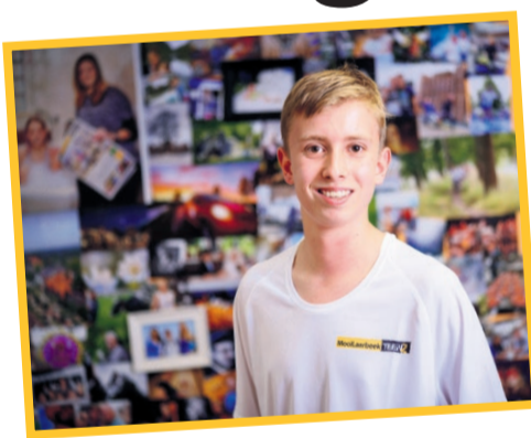
Redacteur: Alexander Brutsaert

Lieshout - De Dorpsstraat in Lieshout staat zondag in het teken van Juni Watermaand. Maar liefst vijftien jongerenteams doen mee aan de Zeepkistenrace. Iedereen is er klaar voor, de kisten zien er stuk voor stuk mooi uit.