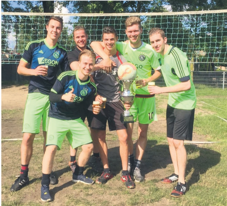
Team AJAX won dit jaar opnieuw het volleybaltoernooi