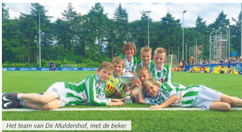
Het team van De Muldershof, met de beker

Zeist/Beek en Donk - De grote finaledag van het jaarlijkse KNVB Schoolvoetbal op het KNVB Sportcentrum in Zeist vond vorige week plaats.