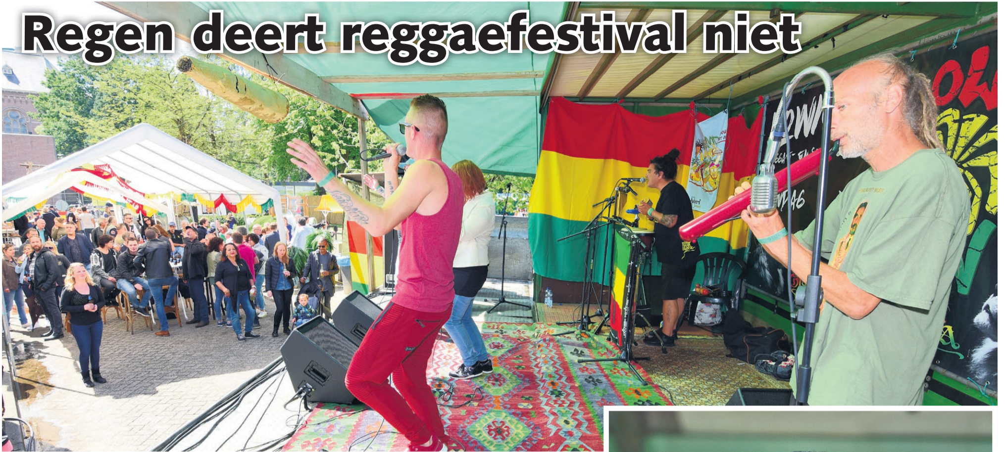
Redacteur: Martien van den Heuvel

Aarle-Rixtel - Het Lowman festival was ondanks de slechtere weersomstandigheden een succes. Na een regenachtig begin van de middag brak de zon alsnog door en wisten steeds meer mensen hun weg te vinden naar het festival. De vrijwilligers van het festival hebben er met de hulp van Jongeren centrum OJA en basisschool De Driehoek een leuk en laagdrempelig festival van gemaakt. Degene die er afgelopen zondag niet bij was, doet er niet slecht aan volgend jaar zeker eens een kijkje te nemen aan de Schoolstraat te Aarle-Rixtel, bij het OJA.