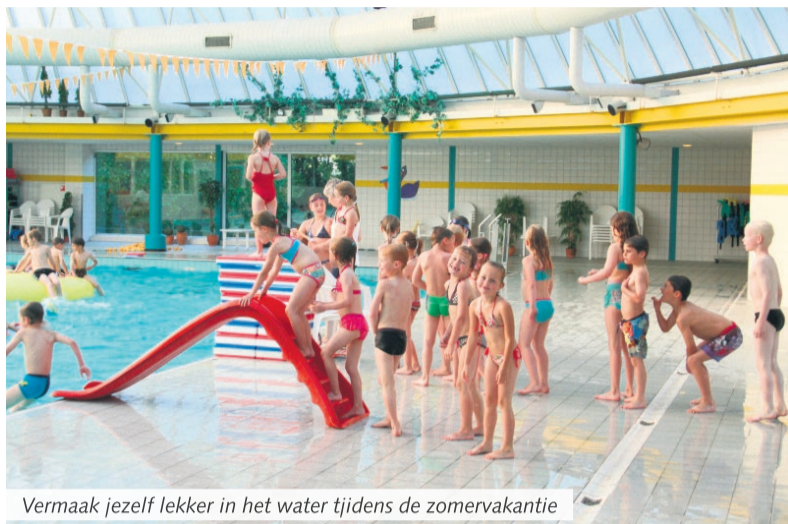
Vermaak jezelf lekker in het water tijdens de zomervakantie

Beek en Donk - Wil je gezellig met je vrienden en vriendinnen tijdens de zomervakantie gaan zwemmen? Schrijf je dan in!