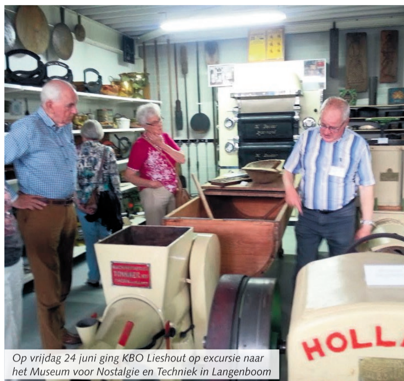
Op vrijdag 24 juni ging KBO Lieshout op excursie naar het Museum voor Nostalgie en Techniek in Langenboom

Lieshout - Seniorenvereniging/ KBO Lieshout houdt vrijdag 1 juli voor de laatste keer voor de vakantie een grote kienavond. Er wordt gekiend om de bekende prijzen zoals levensmiddelen- en vleespakketten en twee keer om de gewilde geldprijzen.