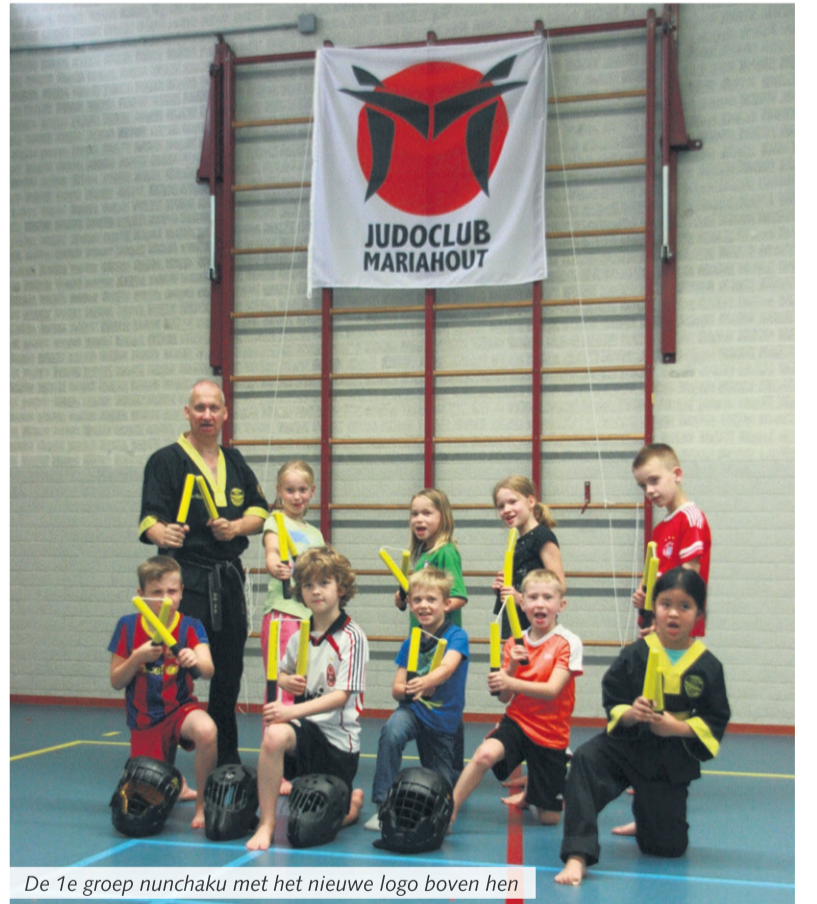
De 1e groep nunchaku met het nieuwe logo boven hen