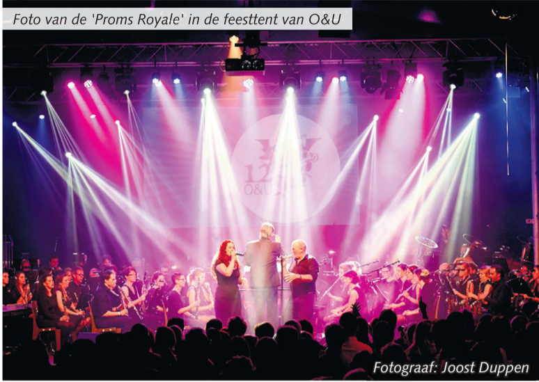
Foto van de 'Proms Royale' in de feesttent van O&U

De organisatie wil iedereen bedanken die een bijdrage geleverd heeft aan dit feest. Op de eerste plaats het publiek dat heeft kunnen genieten van muziek, dans en cabaret. Zonder toehoorders en toeschouwers is een harmonie als een veger zonder blik. Vervolgens de vele vrijwilligers die het mogelijk hebben gemaakt een evenement neer te zetten dat er wezen mocht. Zonder eigen belang is er voor en achter de schermen hard gewerkt om iets moois te laten zien. De zangers, zangeressen, orkesten en cabaretiers voor hun muzikale en humoristische bijdrage. De schooljeugd van de 4 basisscholen in Beek en Donk voor de leerzame wijze waarop ze expressie gegeven hebben aan het thema circus en muziek. De baklustingen onder ons die zowel heerlijke als prachtige taarten hebben gebakken. De sportverenigingen die spontaan op het digitale gevoelige materiaal gingen voor de film Sportlife met livemuziek. De deelnemers aan Beek en Donk presenteert hebben hun culturele uitingen kunnen tonen. Heemkundekring De Lange Vonder voor de samenstelling van de