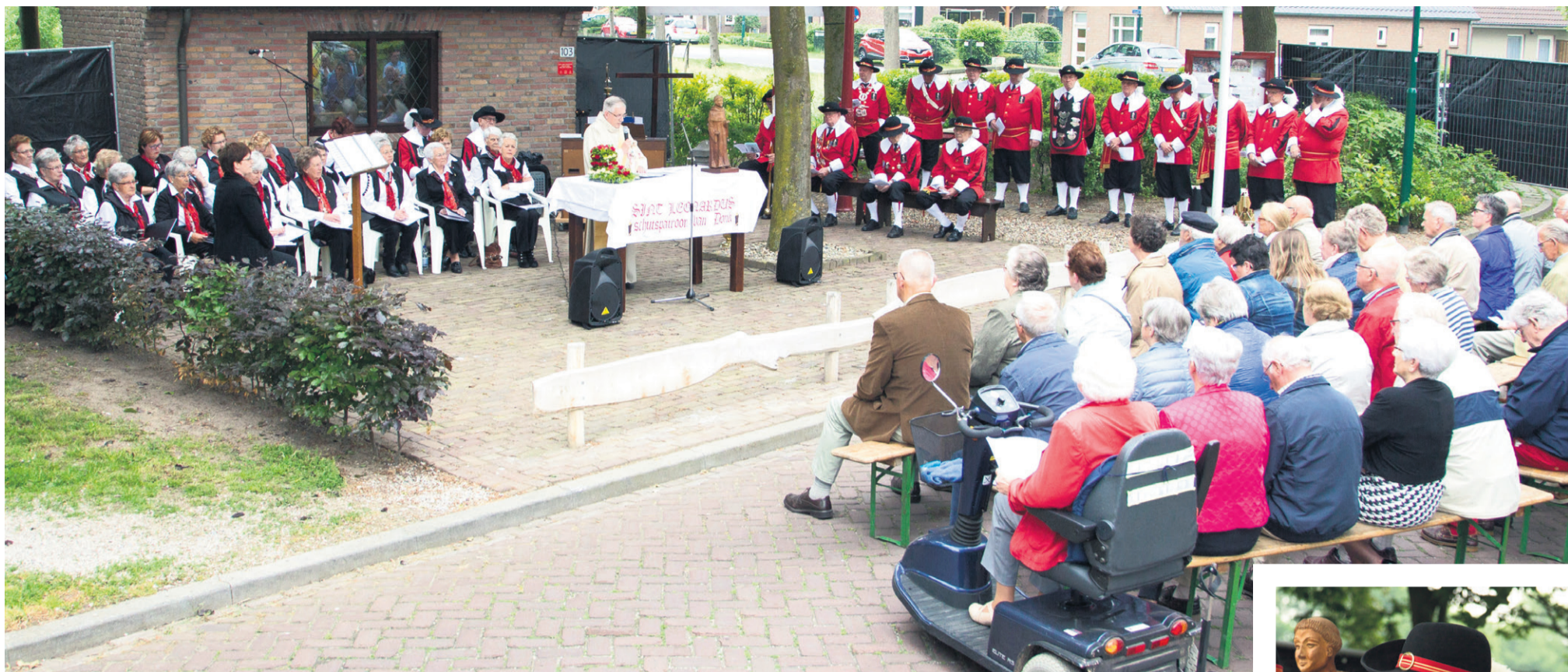
Redacteur: Martin Prick

Beek en Donk - Het Sint Leonardus gilde viert het feest van de Donckse Wij-ing met een gebedsdienst rond de Leonarduskapel aan de Lage Heesweg.