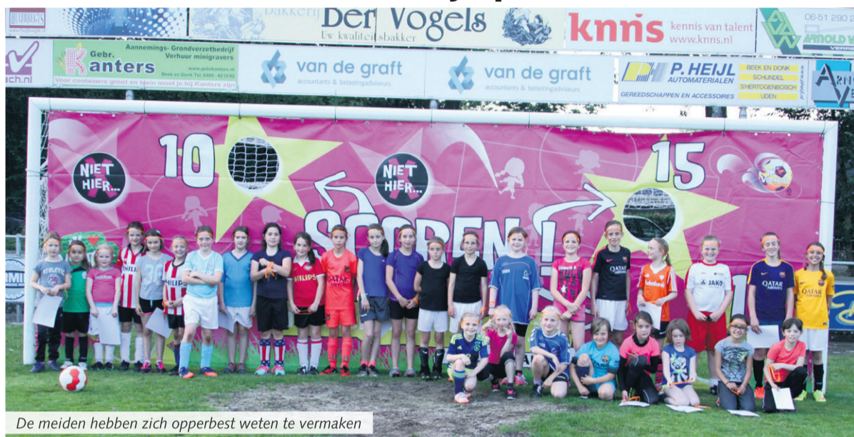
De meiden hebben zich opperbest weten te vermaken

Beek en Donk - Bij voetbalvereniging Sparta'25 werd op woensdag 25 mei en donderdag 26 mei voor het eerst een vriendinnendag gehouden. Liefst 55 meiden kwamen naar sportpark 't Heereind om een balletje te trappen.