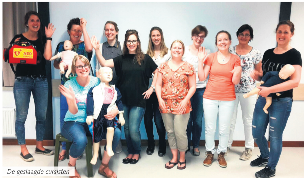
De geslaagde cursisten

Lieshout - Na 6 leerzame avonden zijn alle cur- sisten van EHBO-vereniging Lieshout geslaagd voor de cursus Eerste Hulp aan Kinderen.