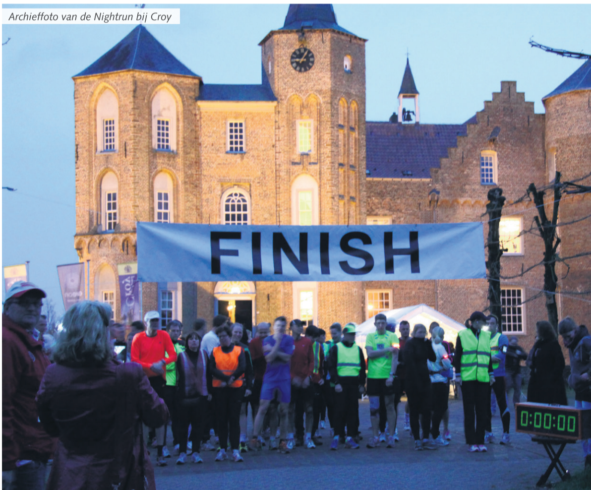
Archieffoto van de Nightrun bij Croy

Aarle-Rixtel – De vierde editie van EyeOn Croy Nightrun vindt vrijdag 3 juni plaats op het landgoed van Kasteel Croy. Deelnemers kunnen zich inschrijven voor zowel hardlopen als wandelen. Het parcours voor de hardlopers zal net als vorig jaar 8,4 kilometer lang zijn en voor de wandelaars 5 kilometer.