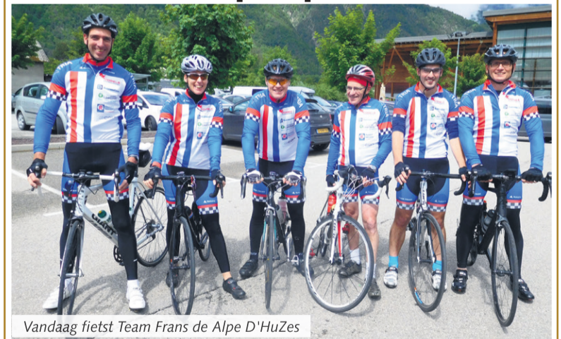
Vandaag fietst Team Frans de Alpe D'HuZes

Beste mensen, sponsors en iedereen die ons in de afgelopen tijd geholpen hebben om ons doel te bereiken,