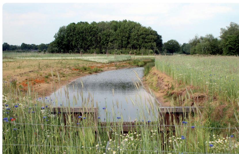
1e prijs: Anne Dekkers