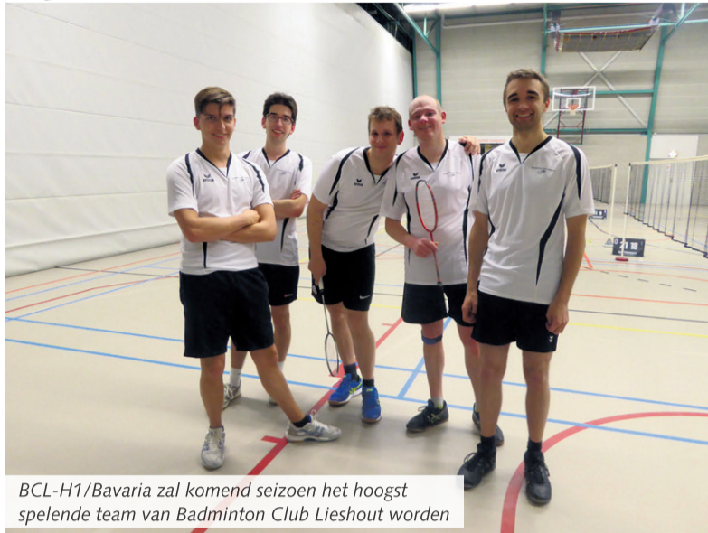
BCL-H1/Bavaria zal komend seizoen het hoogst spelende team van Badminton Club Lieshout worden

samenstelling van de teams nog niet te geven: hier wordt volop aan gewerkt.