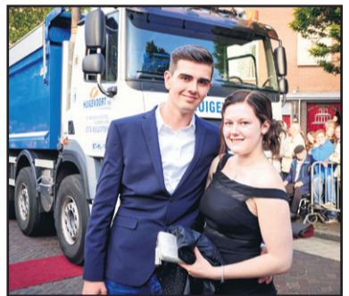
Gala Commanderie College