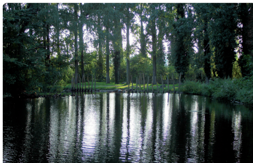
2e prijs: Jowan Dekkers