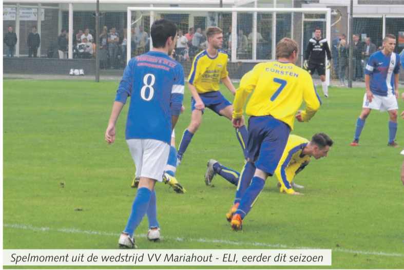
Spelmoment uit de wedstrijd VV Mariahout - ELI, eerder dit seizoen