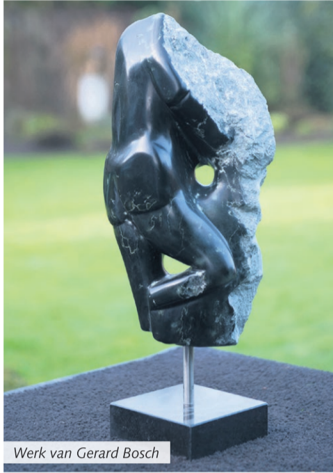
Werk van Gerard Bosch

De expositie is geopend op zaterdag en zondag van 14.00 tot 17.00 uur.