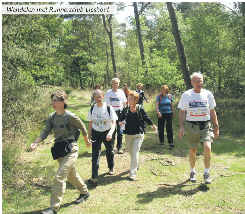
Wandelen met Runnersclub Lieshout

trainers, wordt op woensdagavond en zondagmorgen sportief gewandeld. Hierbij zijn diverse groepen gemaakt die ook in een verschillend tempo wandelen. Daarnaast houdt de wandelafdeling een grote wandeltocht op de laatste zondag in juni. Elk jaar wordt er met een groot aantal leden deelgenomen aan de vierdaagse van Nijmegen en/of Alkmaar en neemt men regelmatig deel aan georganiseerde wandeltochten. Bij het wandelen kan het hele jaar door op woensdag gestart worden, er is geen aparte beginnersgroep. Natuurlijk is het ook hierbij mogelijk 1 maand gratis mee te wandelen