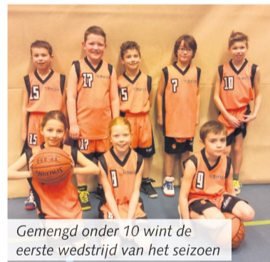
Gemengd onder 10 wint de eerste wedstrijd van het seizoen

Lieshout - Alleen de jeugdteams van Basketball Club Lieshout kwamen afgelopen weekend in actie. Het grootste deel van de wedstrijden werd door de Lieshoutse beloftes gewonnen.