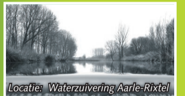
Locatie: Waterzuivering Aarle-Rixtel

Het is alweer enkele jaren geleden dat ik deze foto maakte bij een slootje achter de waterzuivering in Aarle-Rixtel. Ondanks de kou die ik toen geleden heb krijg ik toch weer warme gevoelens bij het zien van de foto. Het had toen al enkele weken behoorlijk gewinterd en de vos ging, ik denk door de honger, ook overdag op jagers pad. Ik weet dat de vos niet bij iedereen geliefd is maar het is toch een van mijn favoriete onderwerpen om te fotograferen. Misschien speelt het mee dat het een hele uitdaging is om ze voor de lens te krijgen, maar ik vind het ook een schitterend dier. Hier was de vos steeds de waterkant af aan het struinen om te kijken of hij niet een waterhoentje kon verschalken. De hoentjes zwommen echter naar het midden van de sloot en vertrouwde erop dat de vos geen nat pak wilde halen. Ikzelf zat natuurlijk te hopen dat de vos het water in zou springen wat spectaculaire plaatjes opleverde zou hebben. Hoewel de vos het hield bij loeren naar de hoentjes heb ik toch geweldig zitten genieten van onze Mooie Laarbeekse natuur!