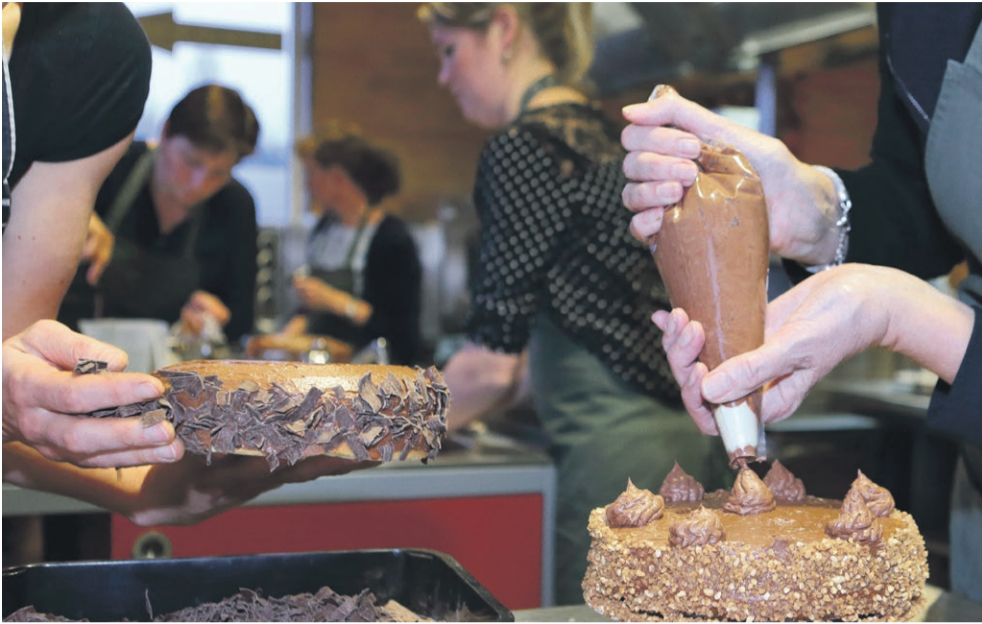
Redacteur: Martien van den Heuvel

Beek en Donk - Ter gelegenheid van het 125-jarig jubileum viert de Beek en Donkse harmonie Oefening & Uitspanning op 22 mei een taartenbakwedstrijd. En dat alles onder de noemer 'Heel Beek bakt en Donk ook'.