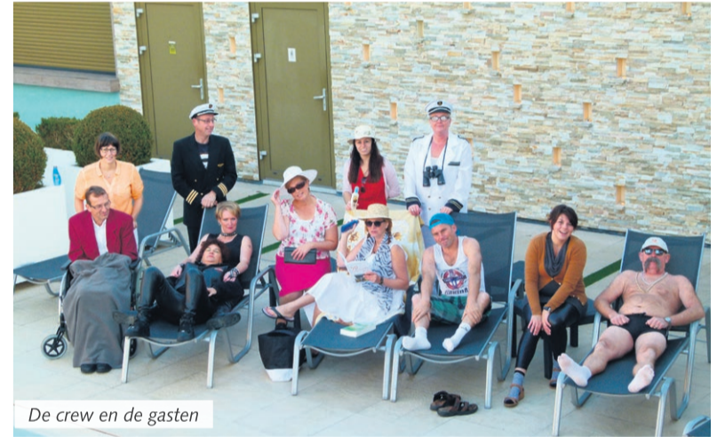
De crew en de gasten

Boerdonk - Nog een dikke week en dan gaat Gèr Gespeuld van wal. Op dit moment wordt er naarstig gewerkt aan de kleine details. Kleine zaken die de cruise voor iedereen net iets leuker maken. Het cruiseschip is de laatste weken flink onder handen genomen en is bijna onherkenbaar opgeknapt. Op dit moment krijgt het schip hier en daar nog een likje verf en worden natuurlijk alle veiligheidsvoorzieningen nagekeken.