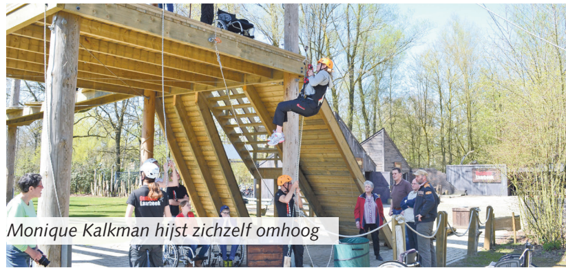
Monique Kalkman hijst zichzelf omhoog

Ambassadeur Monique Kalkman was gisterenmiddag op bezoek bij Outdoor Laarbeek in Beek en Donk. Zij was hier in het kader van de Nationale Sportweek. Monique Kalkman (winnaar van 4 wereldtitels en 3x goud bij rolstoeltennis): "Ik