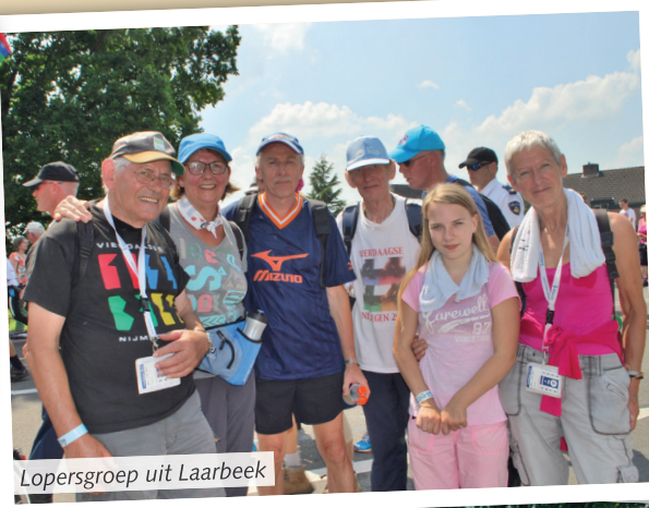
Lopersgroep uit Laarbeek