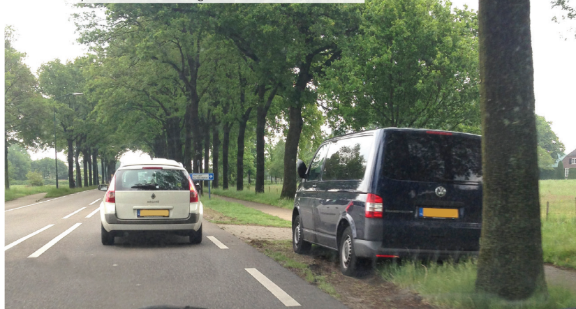
Controle op de Lieshoutseweg (zwarte bus met flitser)

controleren, is overdreven'. Sommige mensen zijn helemaal tegen de snelheidscontroles. 'Op de Lieshoutseweg staat de politie alleen maar om geld in het laatje te brengen, er gebeuren daar nauwelijks ongelukken' en 'de Lieshoutseweg is helemaal niet gemaakt om 50 te rijden, dat is onzin net als op de Oranjelaan'.