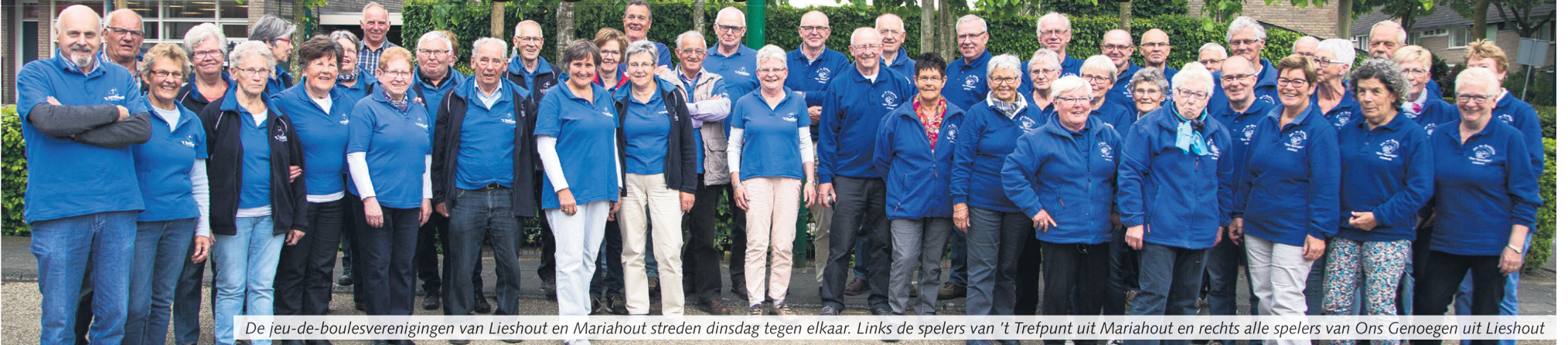
De jeu-de-boulesverenigingen van Lieshout en Mariahout streden dinsdag tegen elkaar. Links de spelers van 't Trefpunt uit Mariahout en rechts alle spelers van Ons Genoegen uit Lieshout