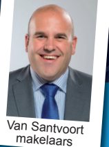
Van Santvoort makelaars

Heuvelplein 55a, Beek en Donk tel. 0492 - 45 01 51 www.vandenhurkmakelaars.nl