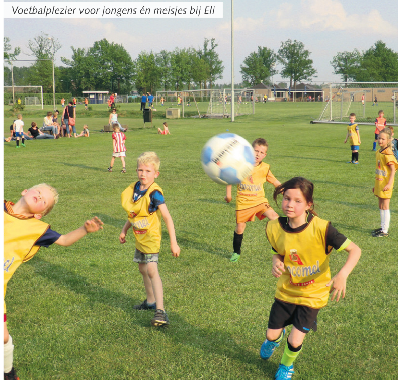
Voetbalplezier voor jongens én meisjes bij Eli

Lieshout – Als een kind met rode wangen van inspanning je vol enthousiasme bedankt voor de fijne voetbaltraining, dan heb je het goed gedaan. Dat overkwam de trainers en leiders van Eli-jeugd bij de actie "Breng een vriendje mee". De jeugdleden van Eli mochten vorige week een vriendje meenemen om hen te laten proeven aan de geweldige voetbalsfeer.