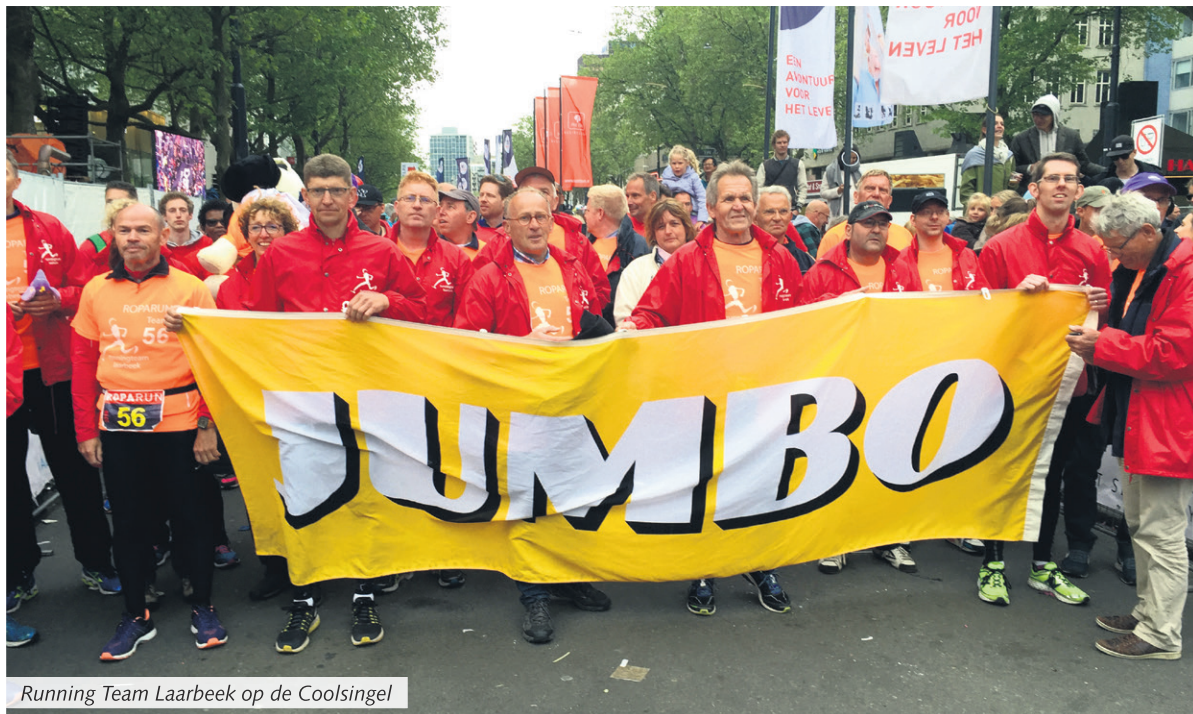
Running Team Laarbeek op de Coolsingel

Laarbeek - Nog nooit was Pinksteren zo koud, nog nooit was Pinksteren zo nat, Running Team Laarbeek trotseerde de hagel en regenbuien om na bijna 48 uur te arriveren op de Coolsingel. Op zaterdagmiddag was het team van start gegaan in Hamburg om na 566 kilometer te finishen in Rotterdam.