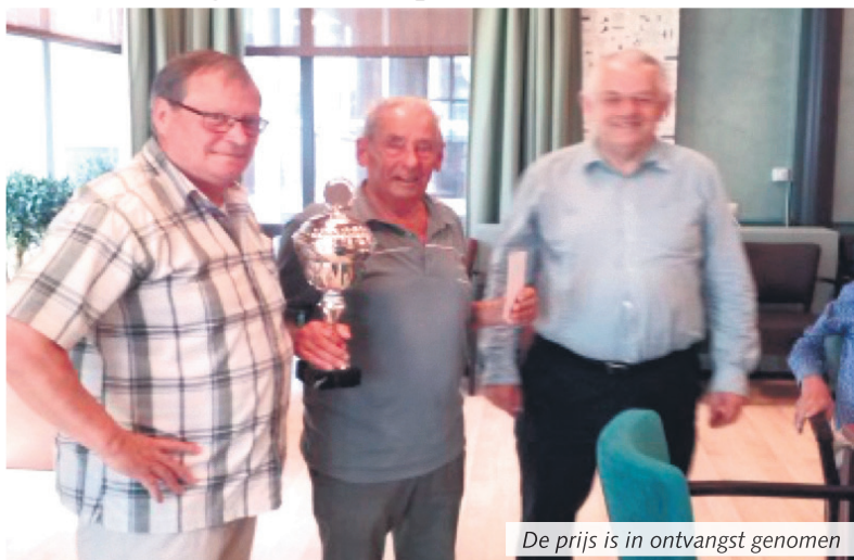
De prijs is in ontvangst genomen

Team Lieshout A eindigde op de 6e plaats (98,92%). Voor Team Beek en Donk was er een 11e plaats (91,46%).