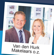
Van den Hurk Makelaars o.z.