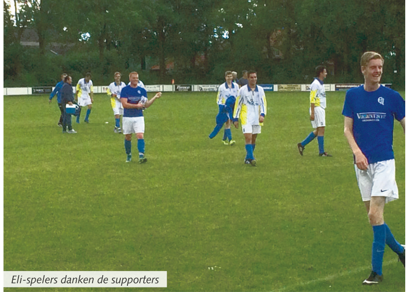
Eli-spelers danken de supporters

Lieshout - Voor ELI was het na twee teleurstellende wedstrijden met duidelijke nederlagen, eerst tegen Irene en later tegen RKGSV, belangrijk om het seizoen goed af te sluiten in De Rips tegen Fiducia.