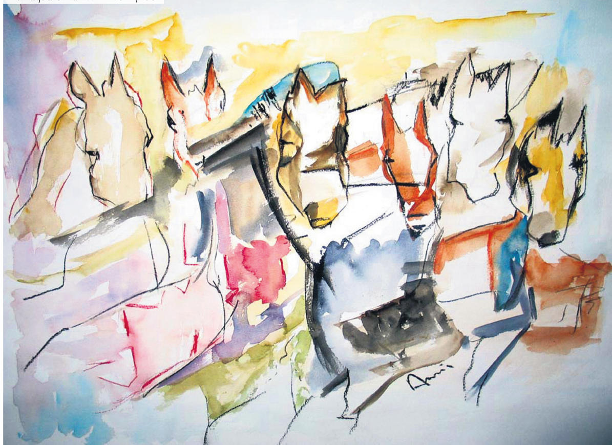
Een aquarel van Ann v/d Eijnde

kwijt. Ze maken namelijk de gaatjes met een soort vorkje (naaitand). Om door het leer te komen moet er dus goed gehamerd worden. Alles wordt met de hand genaaid, met naald en draad.