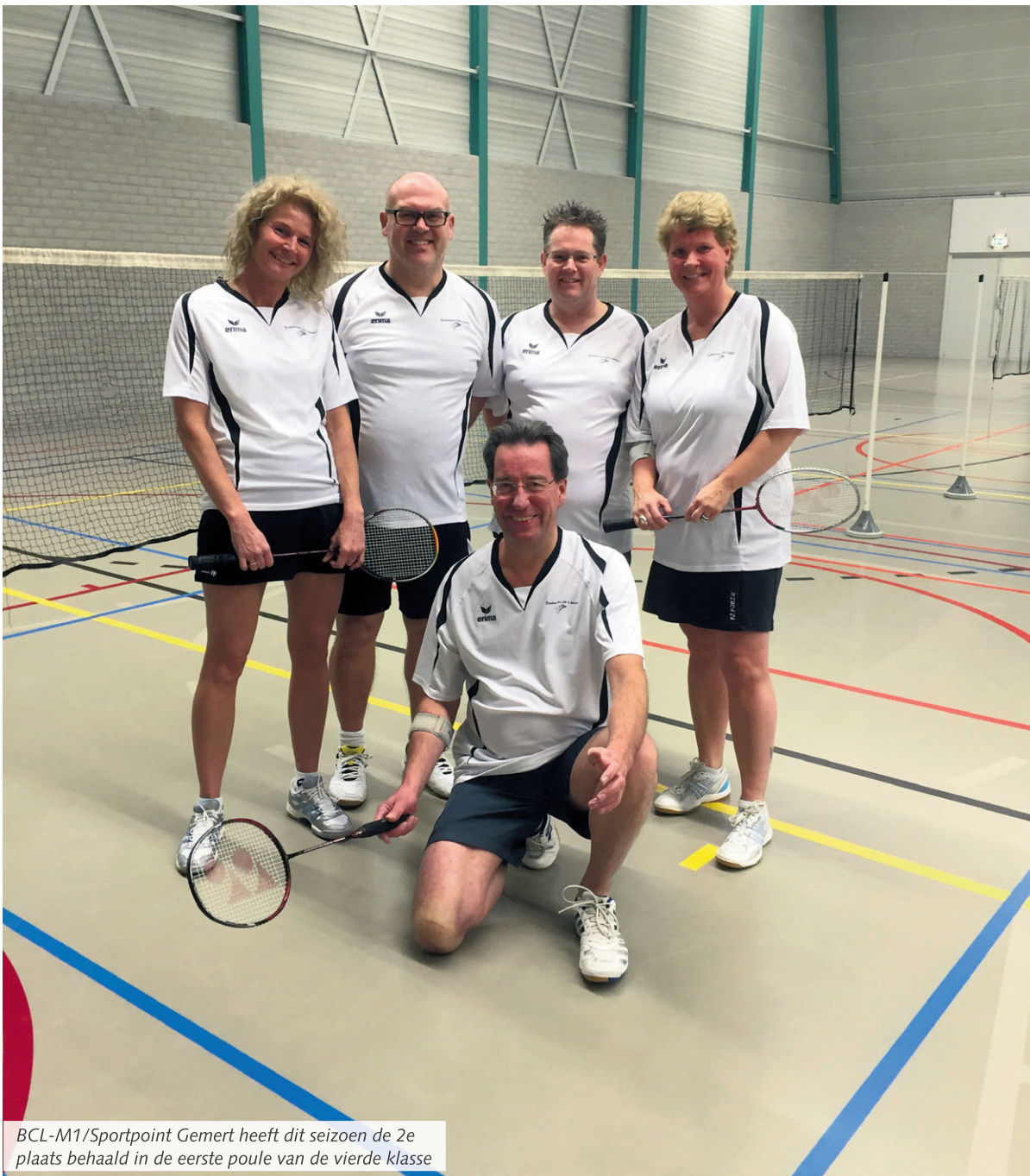
BCL-M1/Sportpoint Gemert heeft dit seizoen de 2e plaats behaald in de eerste poule van de vierde klasse

Lieshout - Met een 1-7 overwinning in en tegen Maarheeze heeft BCL-M1/Sportpoint Gemert het badminton competitie seizoen afgesloten. In de eerste poule van de vierde klasse is het team uiteindelijk tweede geworden, nét achter het eerste midweekteam van BC Oirschot, dat dus met het kampioenschap aan de haal is gegaan.