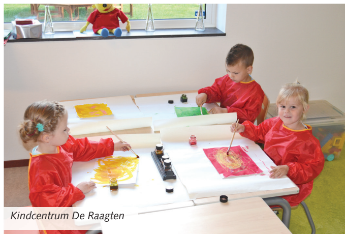
Kindcentrum De Raagten