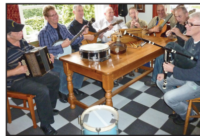
Middag van het Brabantse lied