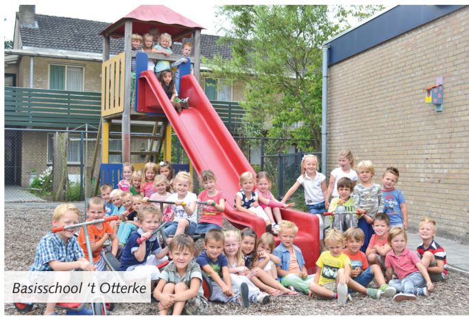
Basisschool 't Otterke

Voor veel kinderen was het maandag een spannende dag. Ze mochten voor het eerst naar de grote school! MooiLaarbeek bracht de scholen een bezoekje en legde een aantal van de allerjongste leerlingen op de foto vast.