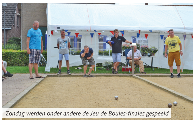
Zondag werden onder andere de Jeu de Boules-finales gespeeld