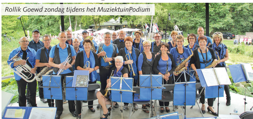
Rollik Goewd zondag tijdens het MuziektuinPodium