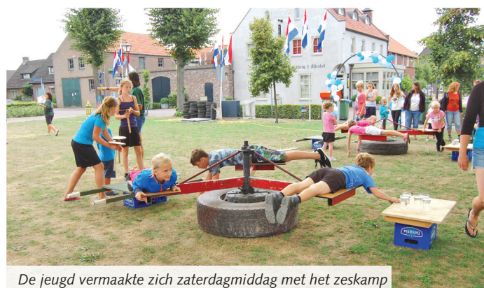
De jeugd vermaakte zich zaterdagmiddag met het zeskamp