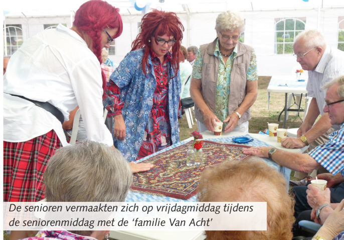
De senioren vermaakten zich op vrijdagmiddag tijdens de seniorenmiddag met de 'familie Van Acht'