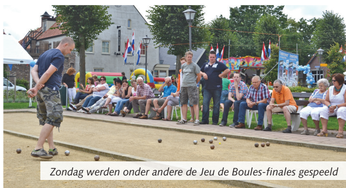
Zondag werden onder andere de Jeu de Boules-finales gespeeld