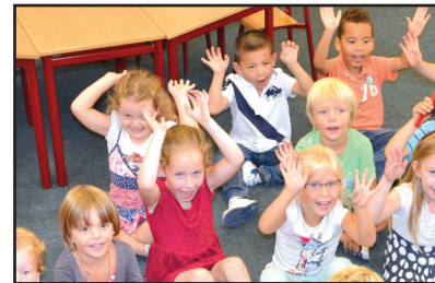
1st dag op de basisschool