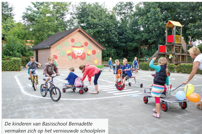
De kinderen van Basisschool Bernadette vermaken zich op het vernieuwde schoolplein

Mariahout – Over een rode loper naar school, wie wil dat nou niet? Maandagochtend was op de Bernadette Basisschool niet alleen de opening van het nieuwe schooljaar, maar ook de officiële opening van het vernieuwde schoolplein.