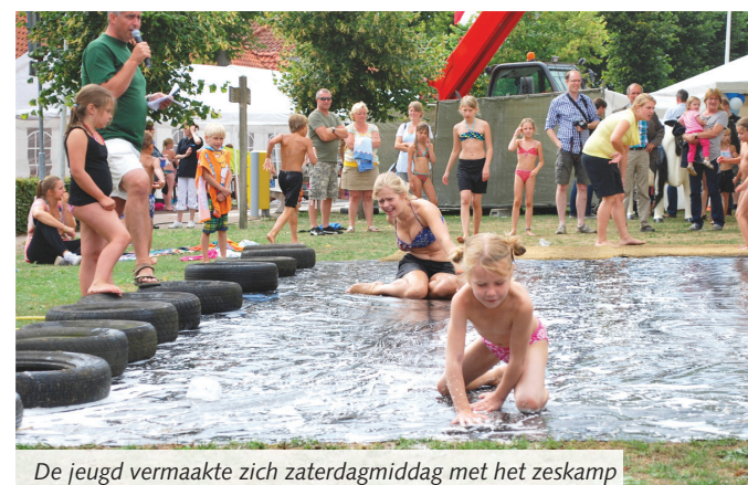
De jeugd vermaakte zich zaterdagmiddag met het zeskamp