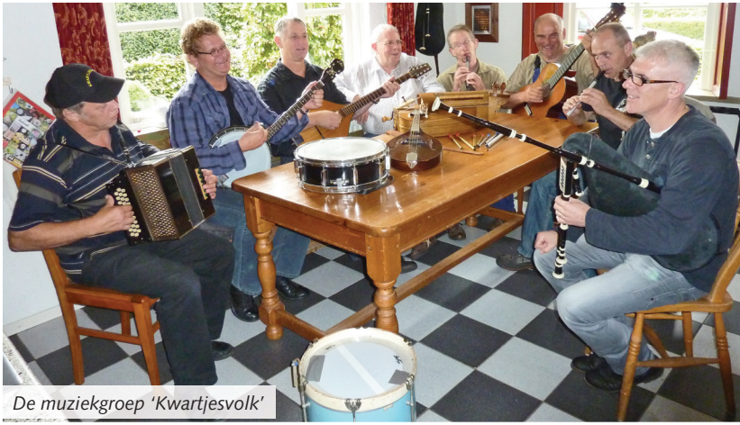
De muziekgroep 'Kwartjesvolk'

Mariahout – Genieten van het Brabantse lied. Dat kan op zondagmiddag 25 augustus in het Openluchttheater in Mariahout met de twee Brabantse muziekgroepen 'Taaftere' en 'Kwartjesvolk'.