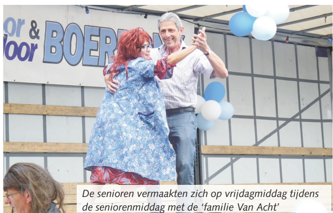
De senioren vermaakten zich op vrijdagmiddag tijdens de seniorenmiddag met de 'familie Van Acht'