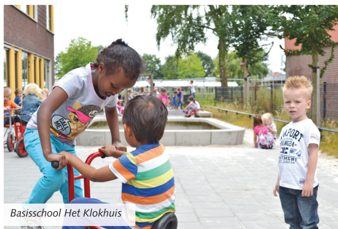
Basisschool Het Klokhuis