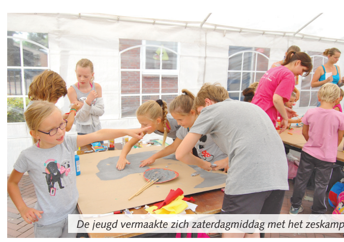
De jeugd vermaakte zich zaterdagmiddag met het zeskamp