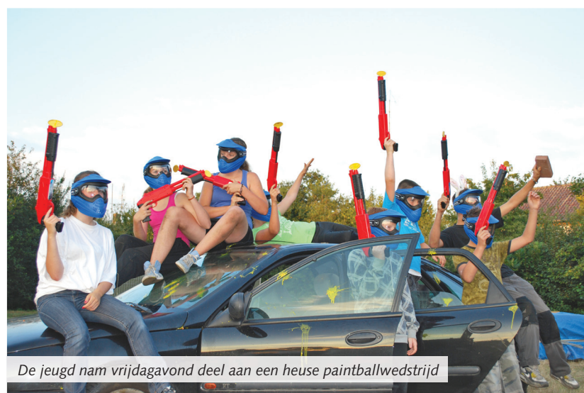
De jeugd nam vrijdagavond deel aan een heuse paintballwedstrijd