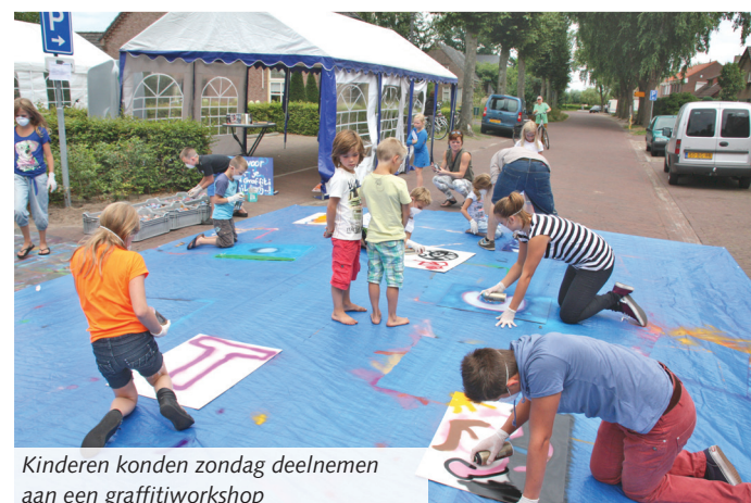
Kinderen konden zondag deelnemen aan een graffitiworkshop