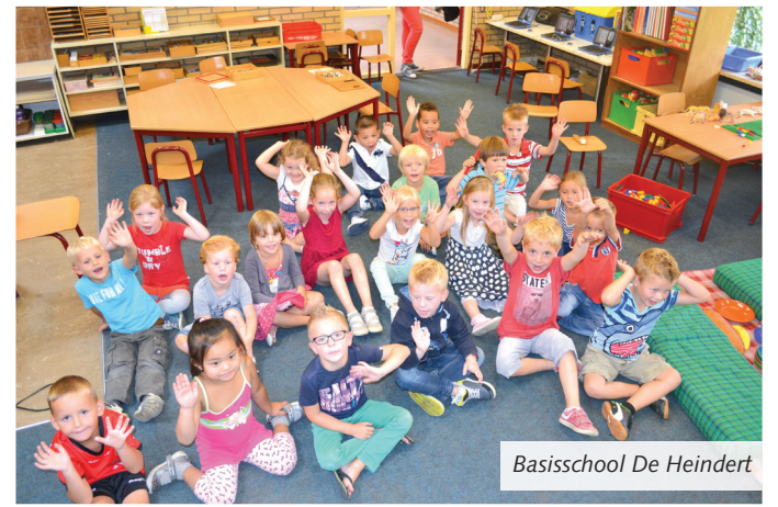
Basisschool De Heindert

Voor veel kinderen was het maandag een spannende dag. Ze mochten voor het eerst naar de grote school! MooiLaarbeek bracht de scholen een bezoekje en legde een aantal van de allerjongste leerlingen op de foto vast.