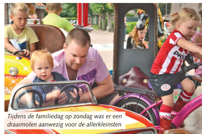
Tijdens de familiedag op zondag was er een draaimolen aanwezig voor de allerkleinsten