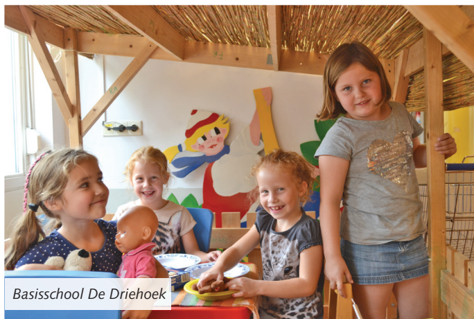
Basisschool De Driehoek