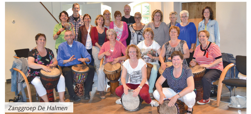
Zanggroep De Halmen

Lieshout - Na een heerlijk warme zomer begint Zanggroep de Halmen weer enthousiast aan een nieuw seizoen. Het afgelopen seizoen, waarin het 40 jarig jubileum werd gevierd, heeft men op zondag 30 juni goed afgesloten.