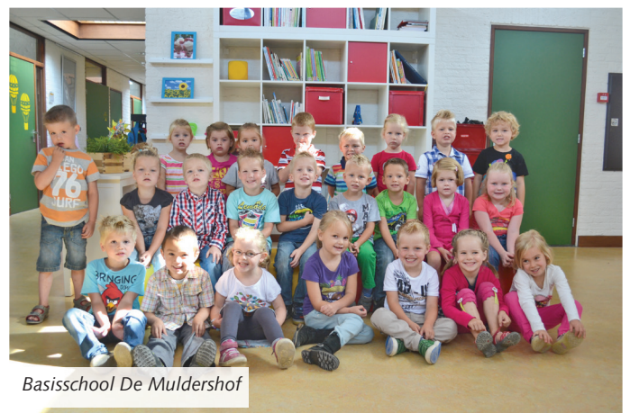
Basisschool De Muldershof