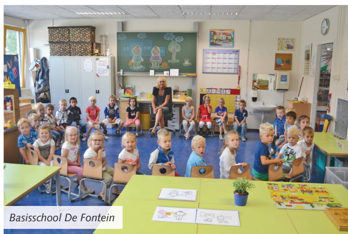
Basisschool De Fontein