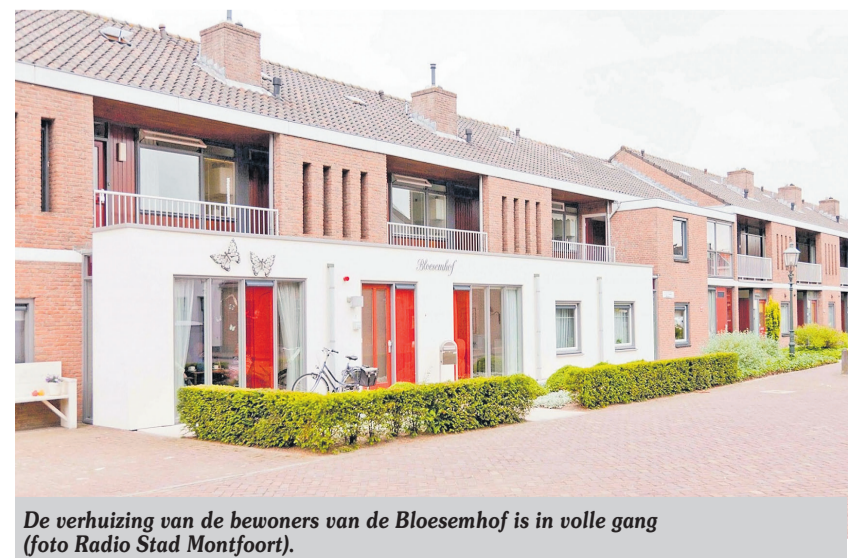
De verhuizing van de bewoners van de Bloesemhof is in volle gang.