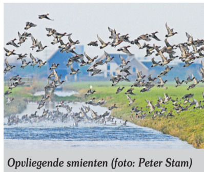
Opvliegende smienten