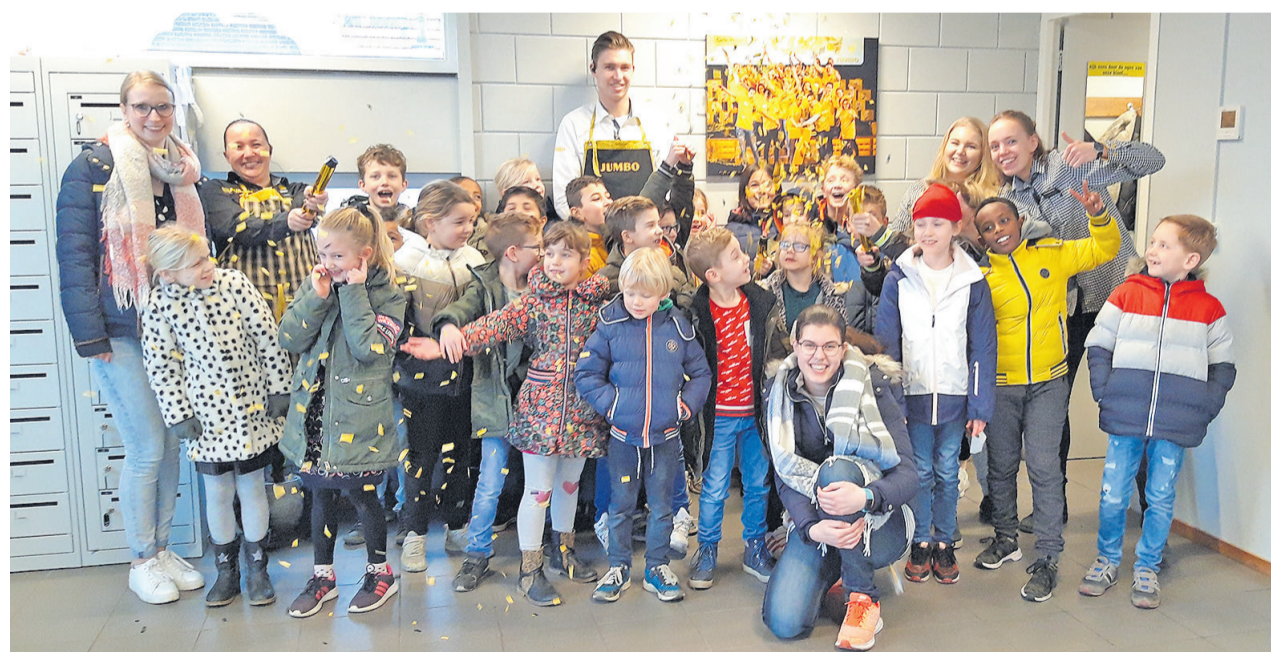
Van het bezoek werd ook een groepsfoto gemaakt, die in de kantine van de Jumbo zal komen te hangen op het prikbord bij leuke gebeurtenissen.

Binnenkort zal er ook een groep van de Montfoortse basisschool het Kompas langskomen bij de Jumbo. Andere scholen hebben tot nu toe niet gereageerd op de uitnodiging, laat Aarnoudse weten. "Het kan ook zijn dat ze net met iets anders bezig zijn, en het nu niet goed uitkomt. Wellicht als het een keertje in een projectweek past, dan zijn ze ook van harte welkom." Al die kinderen brachten veel leuke energie in de winkel, vond Aarnoudse. "Het was lekker rumoerig. Gelukkig konden de andere klanten het ook waarderen. Het was ook niet te gek als in een speeltuin, maar op een leuke manier."