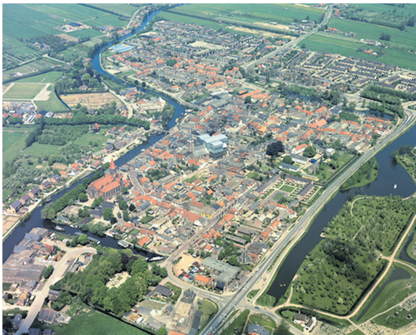
Luchtfoto Montfoort: Delta-Phot Luchtfotografie / collectie Het Utrechts Archief / 50434

De vergadering wordt live uitgezonden via www.channel.royalcast.com/Montfoort en door Radio Stad Montfoort.