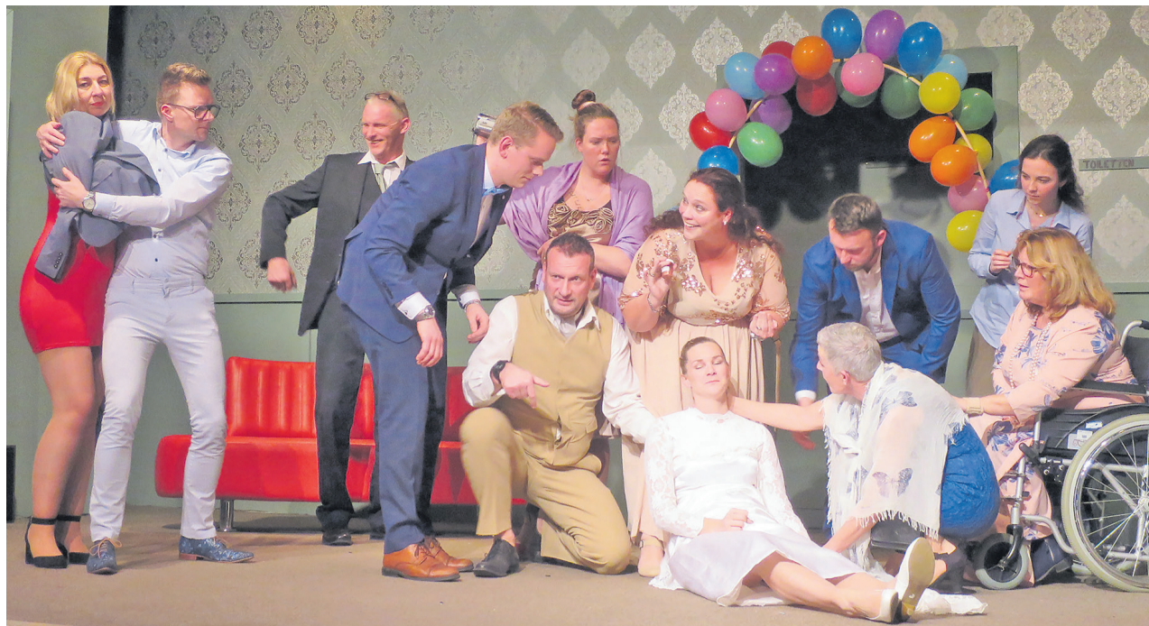
Artoha speelt: 'Al de dagen van ons leven'