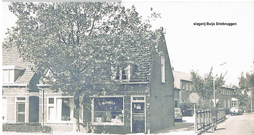
Een oude foto van slagerij Buijs.

Gevonden dieren LINSCHOTEN M.A. Reinaldaweg - Kater. Gemarmerd rood, laag op buik licht crème vlek. M.A. Reinaldaweg - Kat. Rood-cypers, witte buik. MONTFOORT Waardsedijk - Poes, kitten. Lapje met wit masker. Op de linkerwang een rood rondje en op de rechterwang een zwart/grijs rondje.