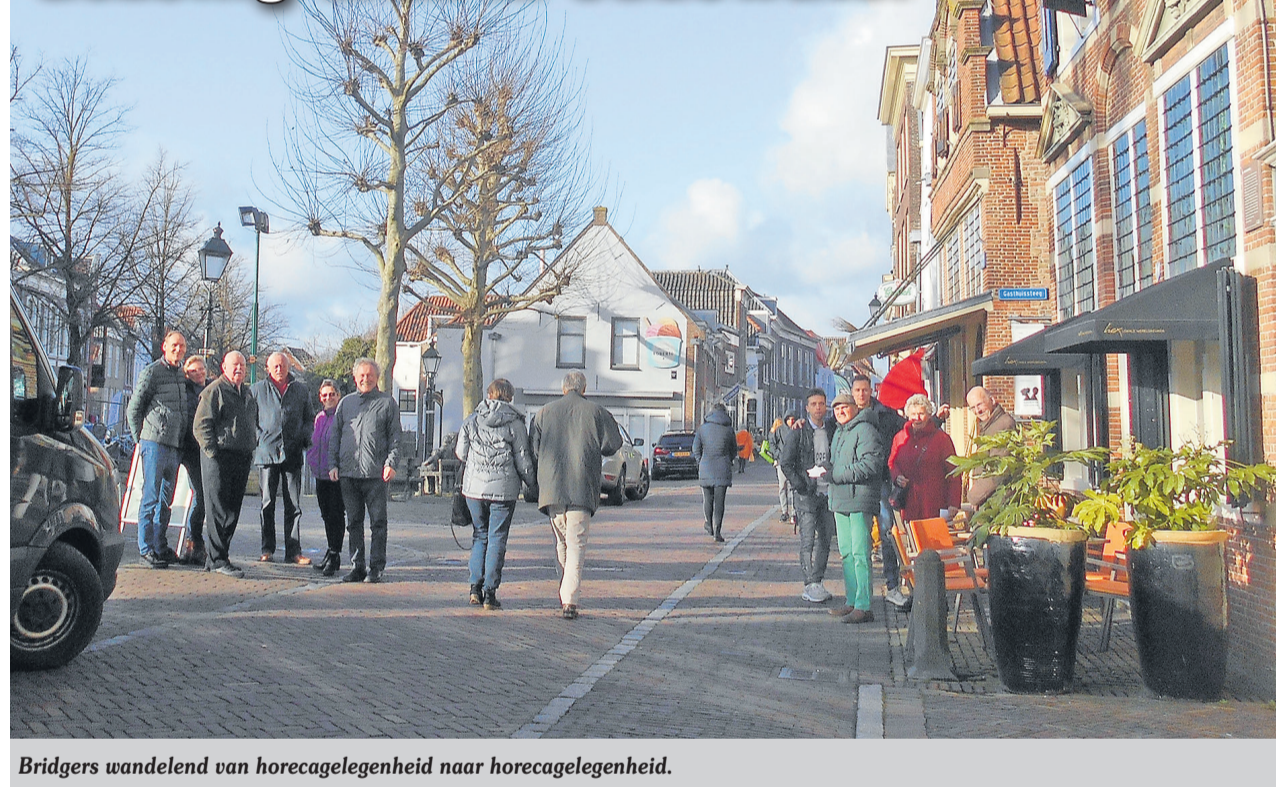
Bridgers wandelend van horecagelegenheid naar horecagelegenheid.

Bijvoorbeeld Pracht aan de Gracht, het Heksenfestijn, Heksen in Touw en -natuurlijk - ook gewoon het prachtige ‘rijke’ Oudewater zelf, trekt veel bezoekers van buiten naar het historische centrum van de stad.