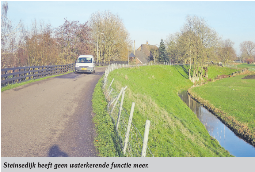
Steinsedijk heeft geen waterkerende functie meer.