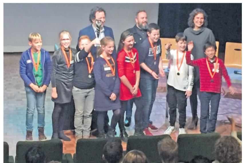
De winnaars van het Kompas waren vanzelfsprekend verguld met hun eerste prijs.