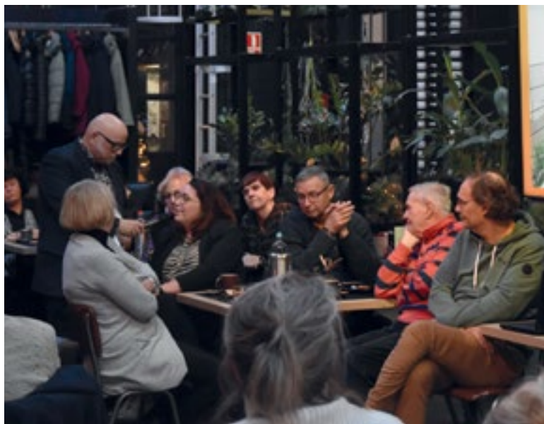
Foto: Auteur Willem Jongeneelen interviewt belangstellenden tijdens de boekpresentatie in 'Havenkwartier by Waggie'.