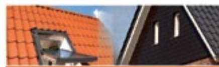
Fakro dakramen - Keralite Gevelbekleding