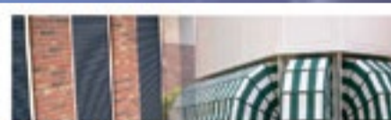
Rolluiken - Markiezen

Mart Brusselaars Rolluiken en Zonwering staat al meer dan 20 jaar garant voor betrouwbaarheid, kwaliteit en service.