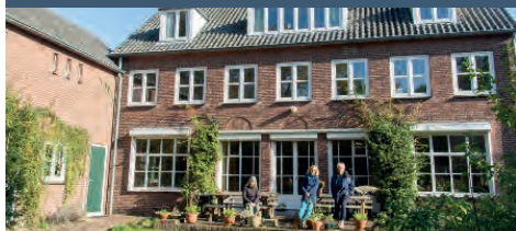
Heerlijke Huijbergdag incl. soep