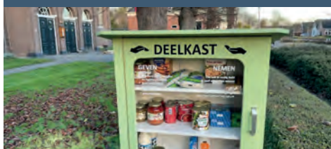
Alles uit de kast, Deelkastjes tour