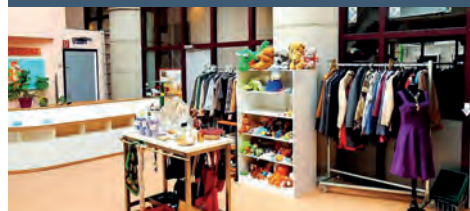
Samen afvalvrij Doedag