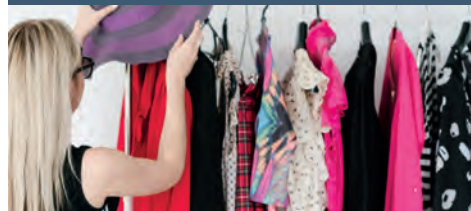
Kledingadvies en tips