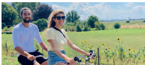
Tour de Boer per tandem