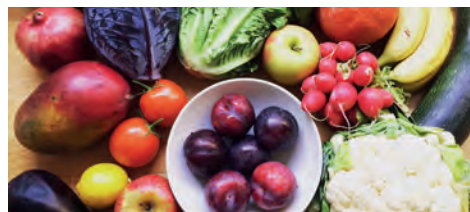
Curio zero waste lunch