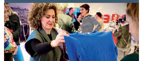
De grote lente kledingruilmarkt