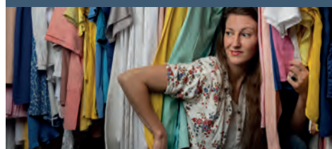
Tweedehands mode tour