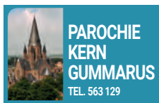
PAROCHIE KERN GUMMARUS TEL. 563 129