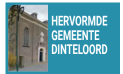
HERVORMDE GEMEENTE DINTELOORD

Elke zondag om 10.30 uur kerkdienst. Elke maandag om 20.00 uur bijbelstudie. U bent van harte welkom. Voor meer informatie kunt u kijken op www.opendeursteenbergen.nl . De kerkdienst is tevens online mee te kijken via YouTube.