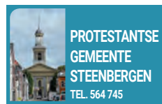
PROTESTANTSE GEMEENTE STEENBERGEN TEL. 564 745