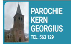
PAROCHIE KERN GEORGIUS TEL. 563 129