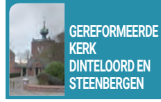
GEREFORMEERDE KERK DINTELOORD EN STEENBERGEN