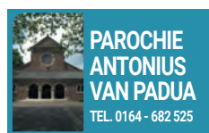
PAROCHIE ANTONIUS VAN PADUA TEL. 0164 - 682 525