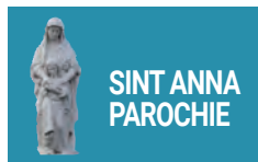
SINT ANNA PAROCHIE