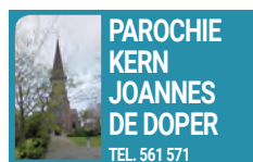
PAROCHIE KERN JOANNES DE DOPER TEL. 561 571