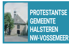
PROTESTANTSE GEMEENTE HALSTEREN NW-VOSSEMEER