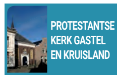
PROTESTANTSE KERK GASTEL EN KRUISLAND