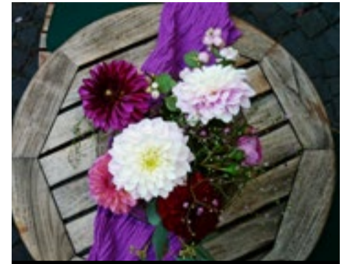
Zomerbollen in pot op balkon en terras