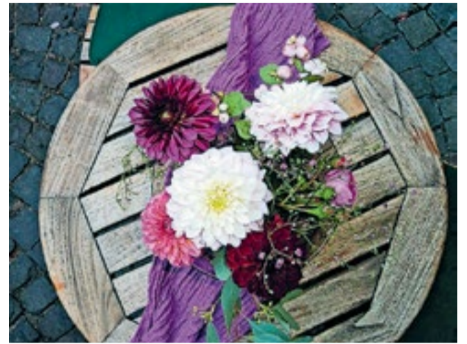
Alle zomerbollen zijn geschikt voor potten.

telkrans (onderkant). Bij begonia is de holle kant de bovenkant. Zie je dit niet, geen probleem; de bol regelt dat dan zelf. Let er wel op dat ze ruim in de pot passen; dan is er straks voldoende ruimte voor de wortels.