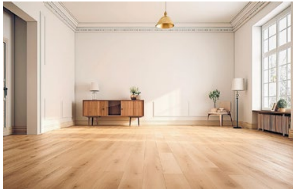
Van bamboe tot vinyl: ontdek de meest duurzame vloeren.

Is je vloer aan vernieuwing toe? Of ben je druk met verhuizen en wil je weten wat de meest duurzame vloeren zijn? Lees dan snel verder.