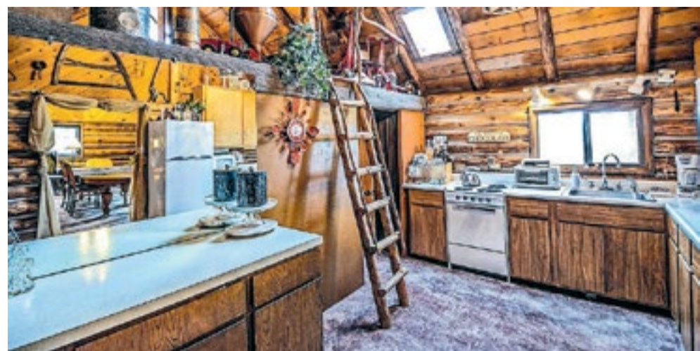
Een houten keuken sluit aan op de human nature look.

kkelijk werkblad, dan is het verstandig om voor kunststof of graniet te gaan. Hout ziet er prachtig uit, maar heeft wel meer onderhoud nodig. De mogelijkheden zijn eindeloos. Naast het aanrechtblad is ook de achterwand een echte sfeermaker. Je kunt kiezen uit natuursteen, (mozaïek)tegels, graniet, glas, RVS, kunststof of een gigantische foto. Houd wel rekening met de stijl van de keuken.