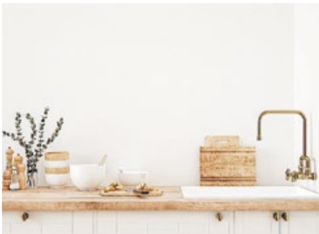
Een keuken moet passen én praktisch zijn.

2. Kijk goed naar de ruimte: welke vorm moet de keuken krijgen? Het moet passen, maar ook praktisch zijn. Denk aan een hoekkeuken of een keuken met een kookeiland. Is de ruimte beperkt, kies dan voor een enkele muurkeuken met grote bovenkasten.