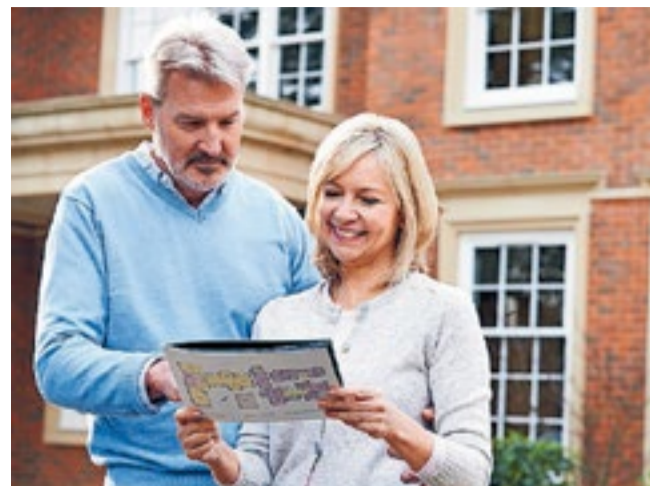
Interieurliefhebbers opgelet, want tijdens de Open Huizen Dag op 6 april kun je huizen bezichtigen zonder afspraak.

Bevalt het? Dan kun je na de bezichtiging verder onderhandelen met de NVM-makelaar. Deelnemen aan de Open Huizen Dag is de ideale manier om met jouw huizenzoektocht