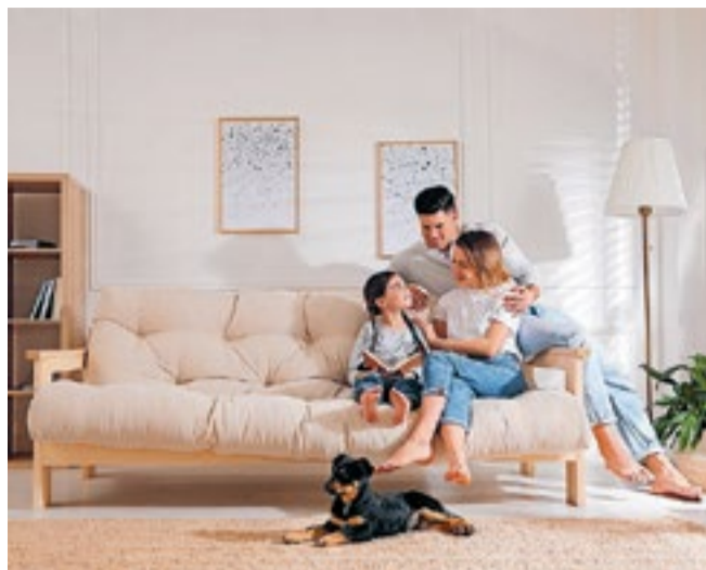
Welkom in onze speciale woonbijlage!

Daarnaast bieden we een schat aan praktische tips en adviezen, zodat je je huis kunt transformeren tot een oase van comfort en schoonheid. Of je nu op zoek bent naar handige organisatietips, slimme ruimtebesparende oplossingen of deskundig advies over kleur en verlichting, de adverteerders van deze krant zijn er om jouw droomhuis te realiseren. Stylingtips? Die hebben we