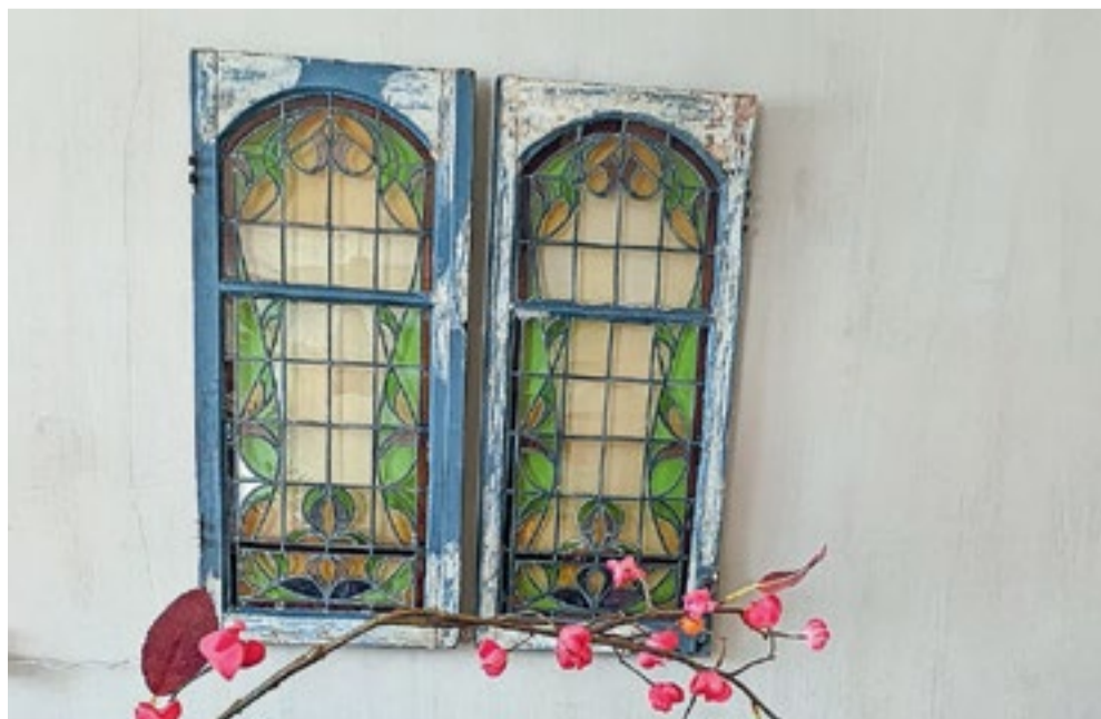
Deze 120 jaar oude art nouveau glas-in-loodramen viste Maarten uit een vuilcontainer.

woonstijl zou willen omschrijven. “Misschien is ‘eclectisch’ wel de meest passende term.