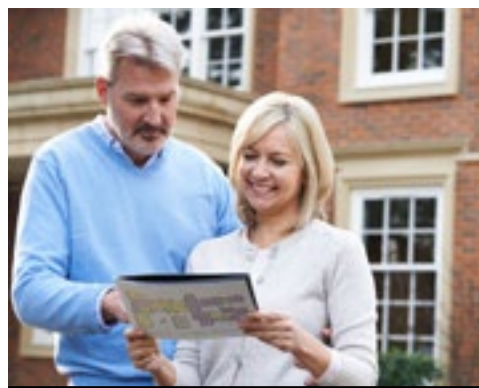
Doe wooninspiratie op tijdens Open Huizen Dag