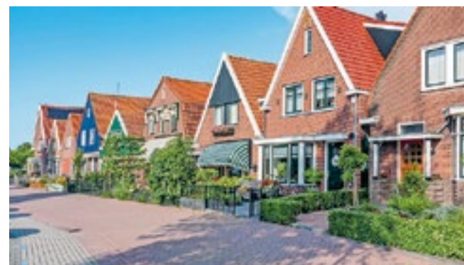
Benut de ruimte van een kleine voortuin optimaal.

Tip 7: een bloemenwand. Creëer een groene muur met klimrozen, jasmijn of kamperfoelie voor een betoverend én heerlijk ruikend entree.