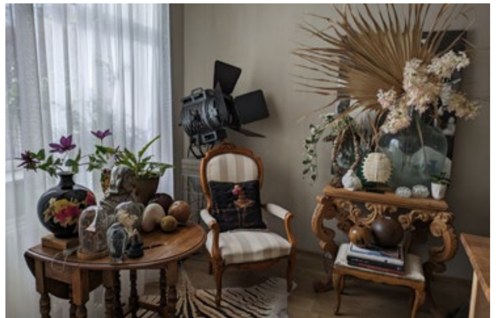
In iedere hoek van Maartens huis is wel iets verrassends te vinden.