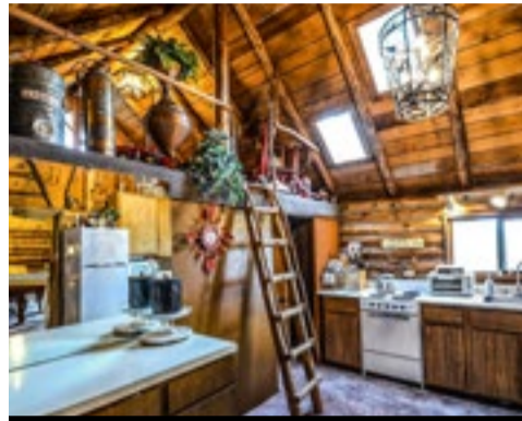
Tips voor een geweldige keuken