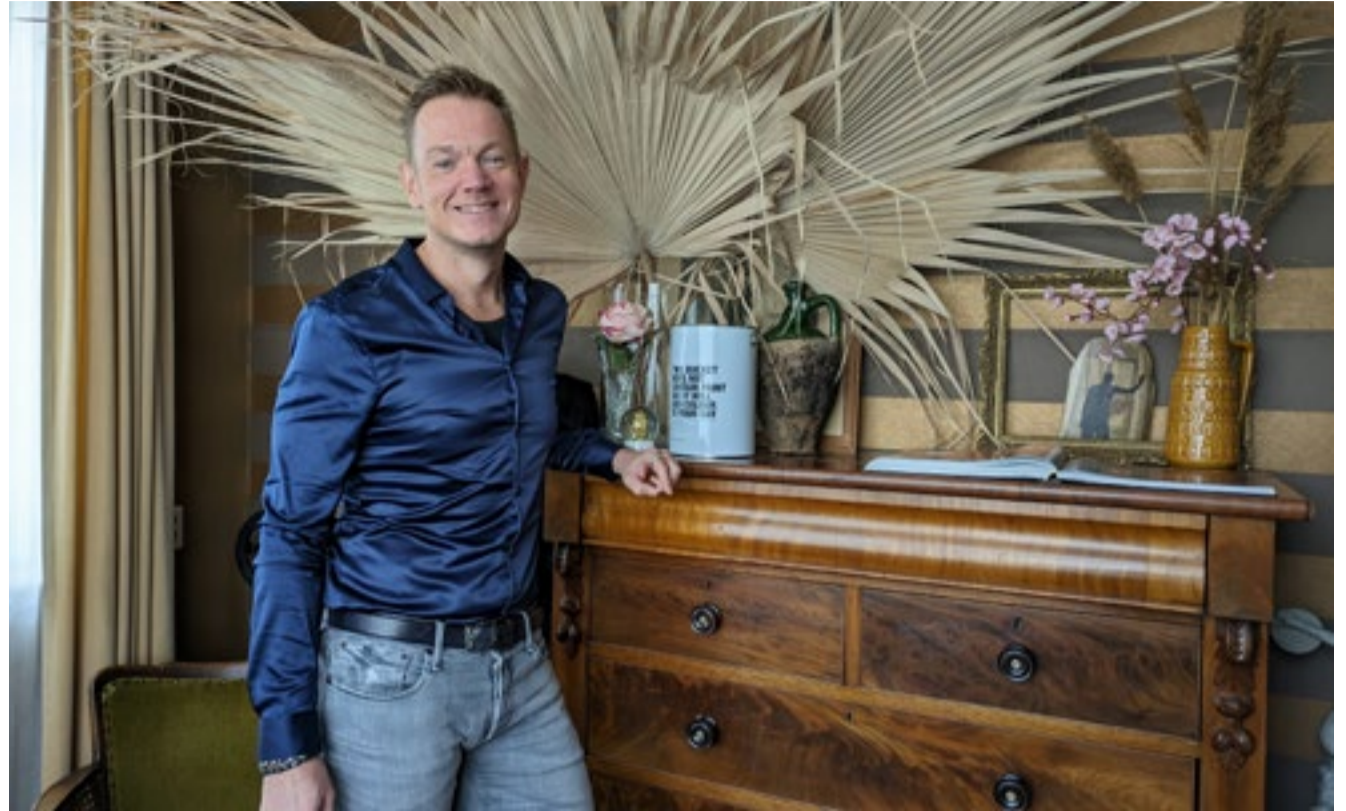
‘Het was een crime om deze zware Engelse kast in huis te krijgen’

Maarten moet even nadenken over de vraag hoe hij zijn eigen