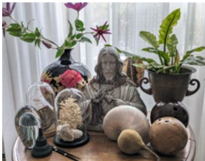
‘Groepeer spulletjes op kleur of vormgeving.’

me stad als Amsterdam of Rotterdam willen wonen. Ik ben te dorps voor een stad en te