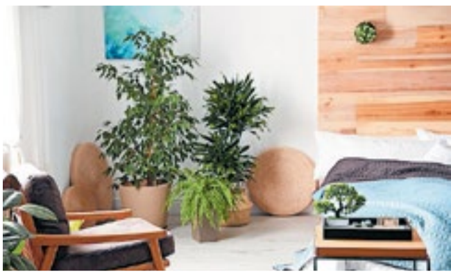
Kies kleuren en materialen die rust en balans bevorderen.

Feng shui, een eeuwenoude Chinese praktijk, benadrukt de harmonie tussen de mens en zijn leefomgeving. Bij het inrichten van je huis volgens feng shui-principes draait het om het creëren van een positieve energiestroom, ook wel bekend als chi. Begin met het opruimen van rommel en het creëren van een open, uitnodigende ruimte. Plaats meubels zodat de energie vrij kan stromen, vermijd scherpe hoeken en zorg voor voldoende natuurlijk licht. Kies kleuren en