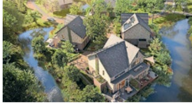
In dit gedeelte van het woonpark is het bestaande groen zoveel mogelijk behouden.

De tweekapper Excellent met vlonder heeft een ruime vlonder die over de kreek uitsteekt en de tweekapper Excellent met tuin heeft een tuin met veel privacy. De charmante houten vlonders, zowel voor als achter de woningen, de verspringende daken en pergola's