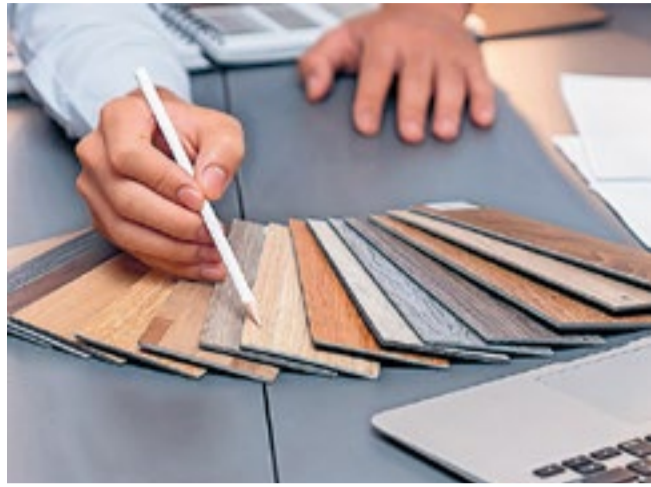
Hoe zorg je ervoor dat jouw interieur geen ratjetoe wordt? Volg deze tips!

Een interieurstylist stelt – nadat jij jouw woonwensen hebt laten zien – het kleurpalet samen, bepaalt de woonstijl, de