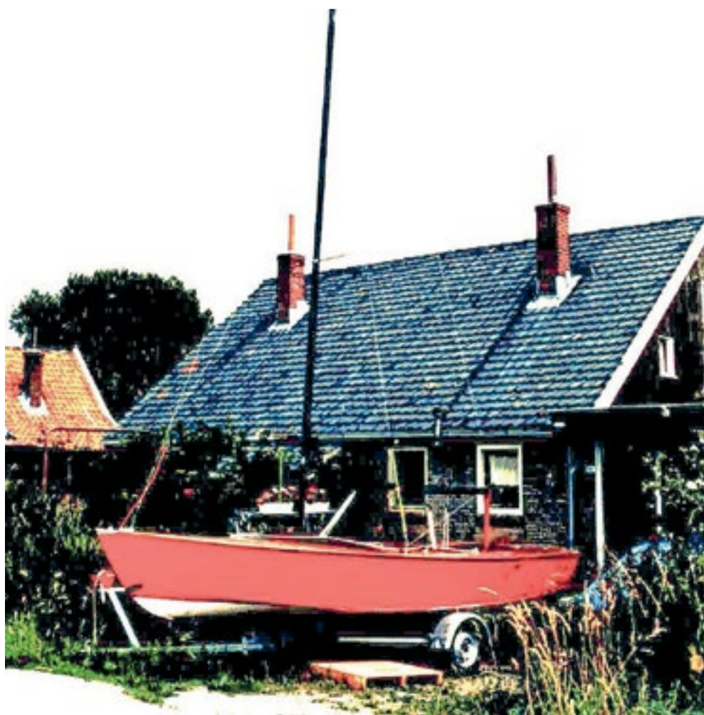
Het huis bij de Kooiboerderij, met de boot in de tuin.