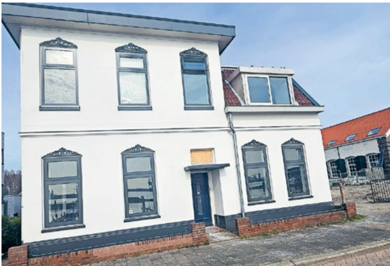
Het pand aan de Stationsweg dat in opdracht van OMA wordt opgeknapt.

Voor wat betreft de uitstraling van de woningen neemt Martin de Torpedoloods, met name Hotel het Badhuis als voorbeeld. "De kleurstelling en vorm en de kap van het gebouw nemen we als voorbeeld, zodat er een mooie samenhang in het gebied ontstaat en waarbij groen een belangrijke rol zal spelen in de buitenruimte van het perceel." Martin heeft bewust gekozen voor vier huurwoningen in plaats van koopwoningen. "Dat is qua ontwikkeling toch iets makkelijker dan koopwoningen. Wanneer de bouw van de woningen daadwerkelijk gaat beginnen, kan Martin nog niet zeggen. "Als de bouwvergunning na de inzagetermijn verleend is, kan er ook nog bezwaar ingediend worden. Ik hoop natuurlijk, omdat we alles echt op orde hebben, dat mensen niet uit frustratie bezwaar in gaan dienen en dat we snel kunnen beginnen, zodat we weer wat moois neer kunnen gaan zetten."