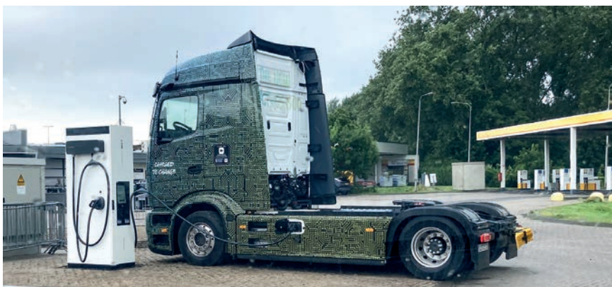
<< De eActros 600 bij laadplein Westgaag.

AGAM zich niet langer richt op de actualiteit én de toekomst. Sterker, de Mercedes-dealer is ontzettend trots op allerlei nieuwe ontwikkelingen binnen Mercedes: 'We zijn er voor alle vormen van transport, van bestelwagens tot truck en de laatste jaren ook natuurlijk de e-truck. Onze e-range wordt steeds breder en je ziet dat er met de eActros 600, recent gekozen tot Truck of the Year 2025, weer een parapedaardje aan het assortiment elektrische vrachtwagens is toegevoegd. We signaleren dat steeds meer ondernemers de stap gaan maken, al of niet ook gemotiveerd door hun klanten, die soms van hen vragen om de overstap te maken. Maar linksom of rechtsom: AGAM is er klaar voor om ook deze markt, die volop in beweging is, zo goed mogelijk te bedienen.'