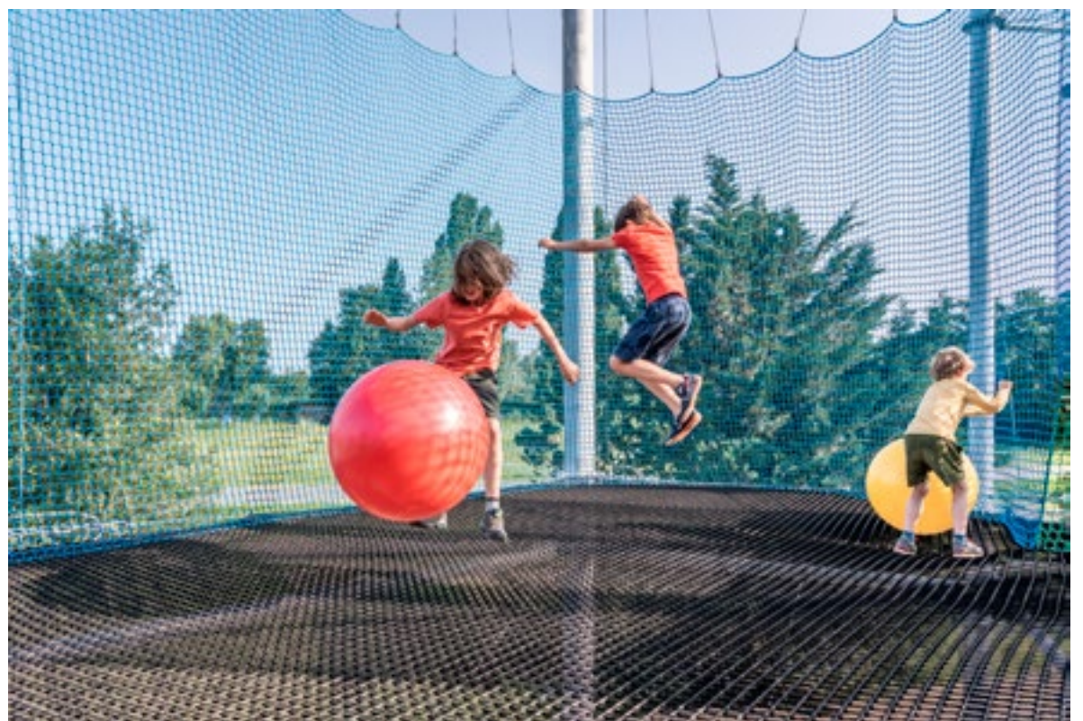
Net Adventure: de nieuwste activiteit bij Outdoor Valley.

vaste grond. Afgelopen woensdag kon er voor het eerst door publiek gesprongen worden in Net Adventure. Tijdens de opening sprongen kinderen dolenthousiast en onvermoeibaar tot grote hoogte. Als afsluiting streken de ouders met hun kinderen neer in de Pannenkoekhut, waar zij na het springen heerlijke pannenkoeken aten om de honger te stillen. Je kunt van woensdag tot en met zondag bij Net Adventure en de Pannenkoekhut van Outdoor Valley terecht.