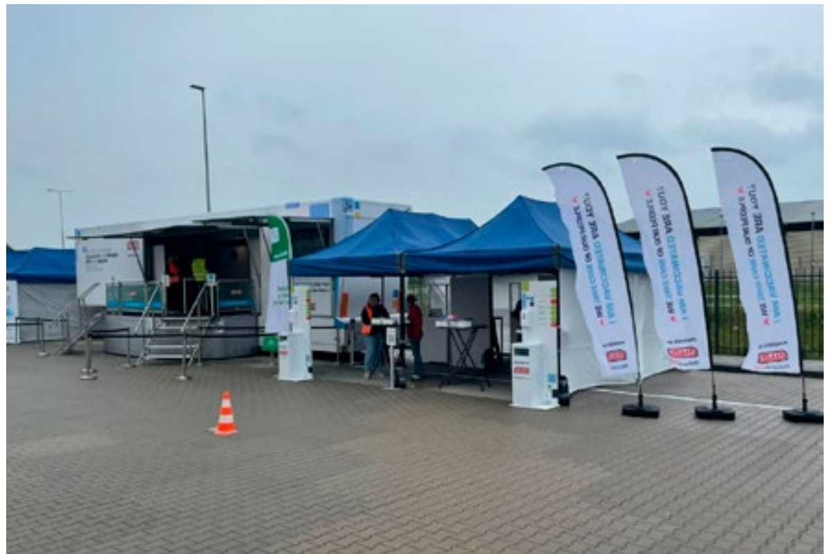
Het mobiele vaccinatiecentrum stond vorige week één dag aan de Laan van Mathenesse.