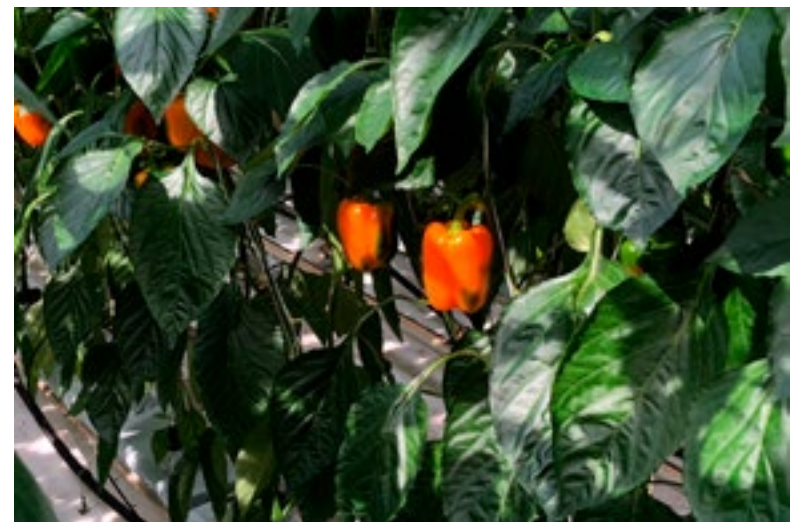
Het volledige programma en de inhoud van de diverse bijeenkomsten worden binnenkort bekend gemaakt.

toekomstplannen op thema's zoals onderwijs, werkgelegenheid en ruimte. Tijdens de 'Horti Science Park Event Weeks' staat onder andere de opening van het 'Fieldlab Vertical Farming' van WUR en Delphy op het programma. Daarnaast worden er door Gemeente, WUR en Delphy, samen met organisaties zoals Glastuinbouw Nederland en Greenport West-Holland nog ruim tien andere events georganiseerd. Zo is er de kennisdag voor tuinbouwondernemers, het WaterEvent en een middag over smaakonderzoek. Ook zijn er meet-ups over de 'Horti Science Visie' met tuinbouwjongeren en inwoners van de gemeente.