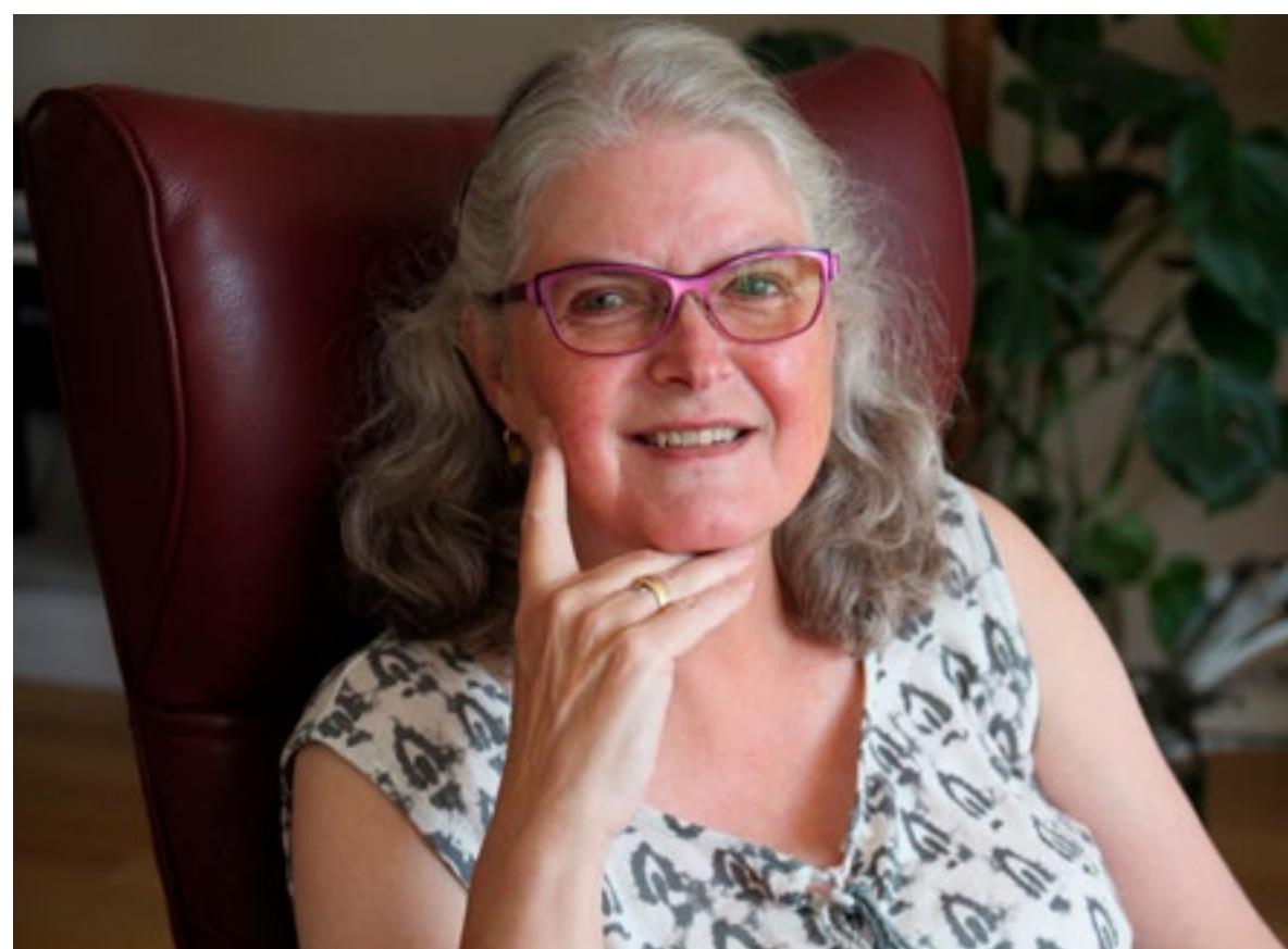
De Berkelse doet sinds een jaar als vrijwilliger de redactie van het parochieblad De Morgenster.

Heel jammer, maar dat is wat het nu is. (SO)