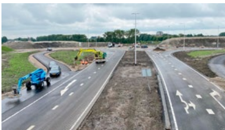
Berkel en Rodenrijs - De N209 tussen de N471 en N472 en de Ankie Verbeek-Ohrlaan tussen de Hazelaarweg en de N209 zijn afgesloten van vrijdag 27 augustus 20.00 uur tot maandag 30 augustus 06.00 uur. Fietsers worden omgeleid via de Bergweg-Zuid en de N472.