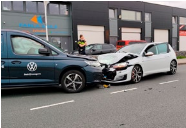
De bestuurder van een bestelbus raakte betrokken bij een ongeval, terwijl hij kort daarvoor veel te hard reed.

Kort daarop kregen de agenten een melding van een aanrijding op de Primalaan West in Bleiswijk. Hier bleek de bestuurder van de bestelbus betrokken te zijn geraakt. "Het rijbewijs van de bestuurder is ter plaatse voor de eerdere snelheidsovertreding ingevorderd. Ook zal er proces-verbaal opgemaakt worden voor het veroorzaken van een aanrijding", besluit de politie.