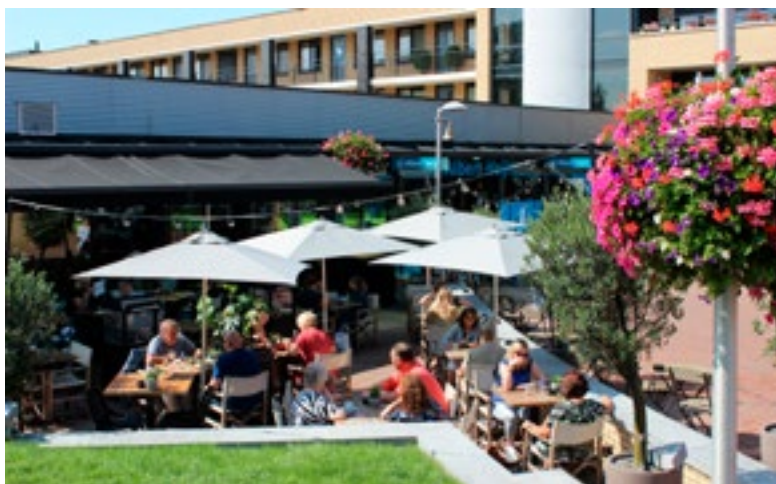
Berkel en Rodenrijs – Maandagmiddag dook ineens een zonnetje op boven Lansingerland. Het terras van Brasserie Edelweiss stroomde meteen vol! Het zomerweer valt vooralsnog een beetje tegen.