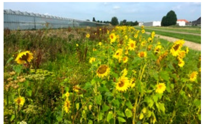
Lansingerland – "Kijk eens wat een prachtige zonnebloemen", schrijft fotograaf Ton Koorevaar aan onze redactie. "Deze foto is gemaakt op de landscheiding tussen Bleiswijk en Bergschenhoek."