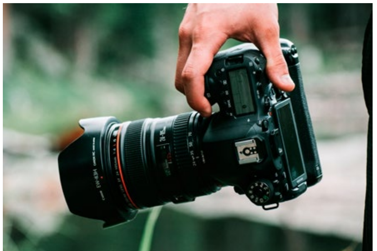
Een fotograaf van mediapartner 112 Lansingerland heeft aangifte gedaan van bedreiging.

nerschap met deze lokale nieuwsjagers. De hoofdredactie van deze krant is dan ook zeer ontstemd door de bedreiging. "Helaas is het niet de eerste keer dat persfotografen en journalisten te maken krijgen met agressie en geweld. Verslaggevers moeten ten allen tijde hun werk kunnen doen, vertellen wat er op straat gebeurt en zonder belemmering foto's en video's kunnen maken", laat de hoofdredactie van deze krant weten. "Wij vinden het dan ook een goede zaak dat de fotograaf aangifte heeft gedaan."