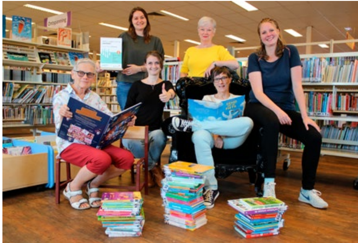
Medewerkers en vrijwilligers van Bibliotheek Oostland hebben zin in de open dag.