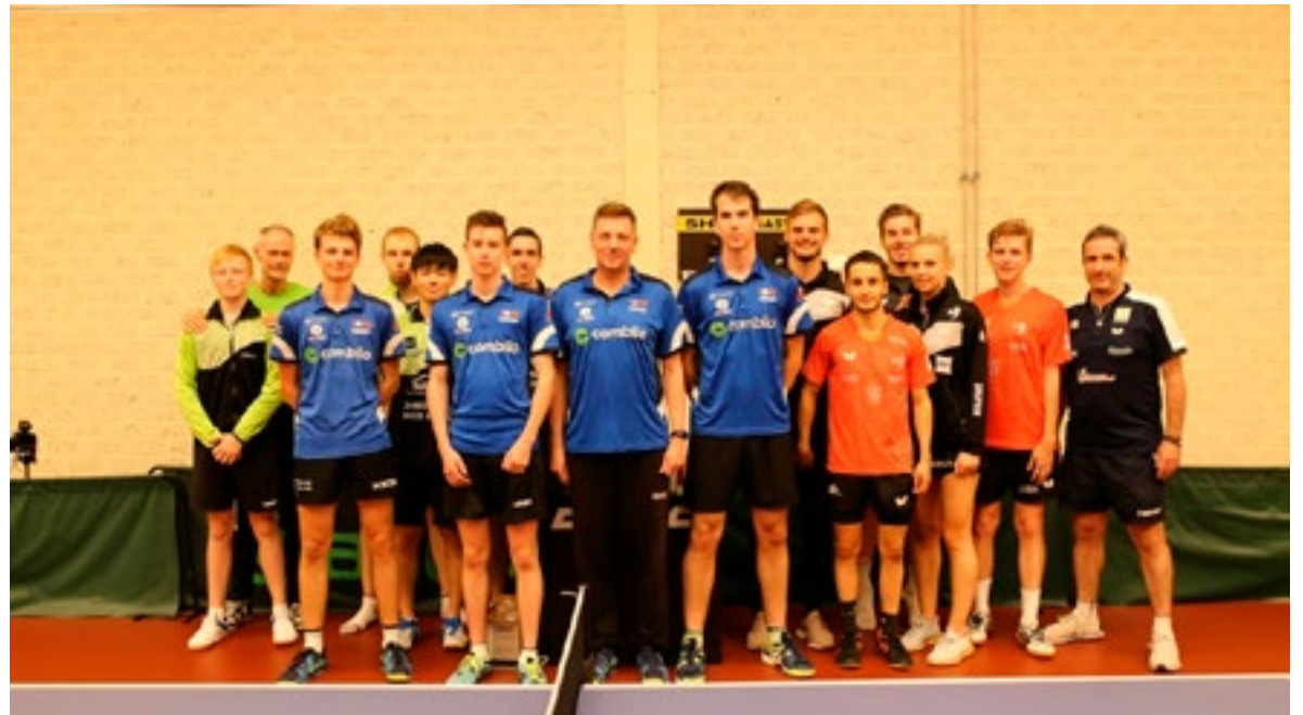
Het TOGB tafeltennisteam samen met andere deelnemende teams.

Berkel en Rodenrijs – Als voorbereiding op het komende eredivisie seizoen spelen de spelers van tafeltennisvereniging TOGB veel wedstrijden.