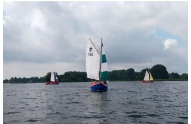
Zaterdag 14 augustus gaf de Scouting Bleiswijk een zeilcursus op de Rottemeren in het kader van Expeditie Lansingerland.

Op 3 september gaat het nieuwe scoutingseizoen van start. Met de verschillende speltakken en functies heeft Scouting Bleiswijk voor iedereen van 4 jaar en ouder een passende uitdaging. Lijkt het jou leuk om te ontdekken wat de scouting te bieden heeft? Neem dan contact op via het e-mail-adres info@scoutingbleiswijk.nl .