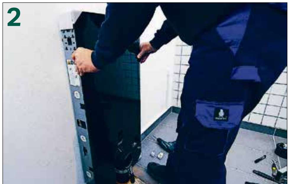
De Geberit Monolith sanitairmodule wordt aan de muur gemonteerd.