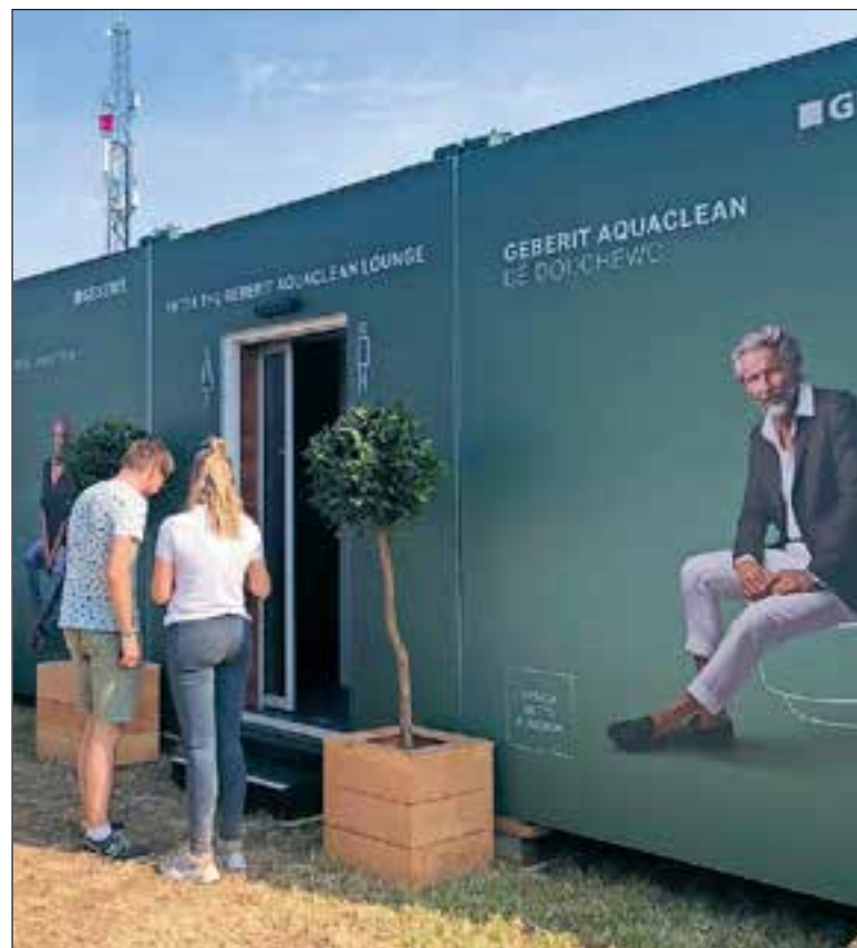
Geberit AquaClean prominent aanwezig op de Zwarte Cross.