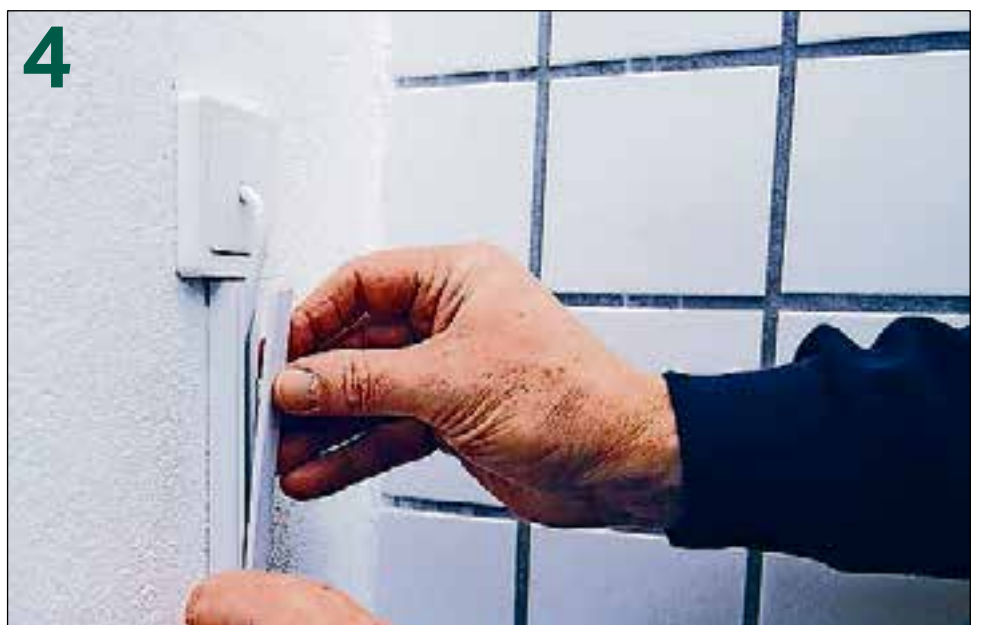
De douchewc kan zonder moeite via een externe aansluiting van elektriciteit worden voorzien.