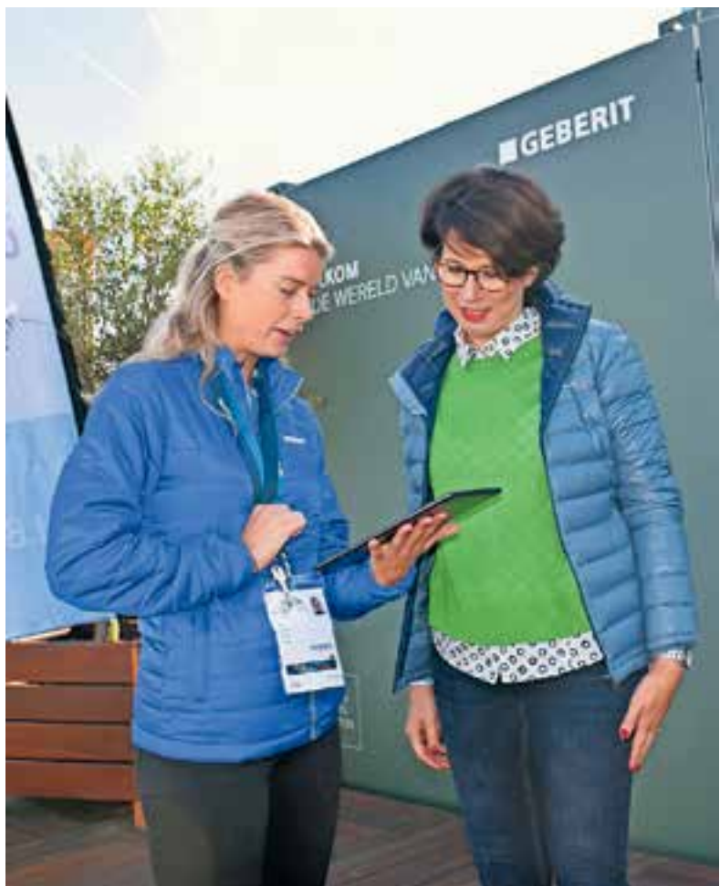
Gebruikers die overtuigd waren van de douchewc konden direct meer informatie aanvragen.