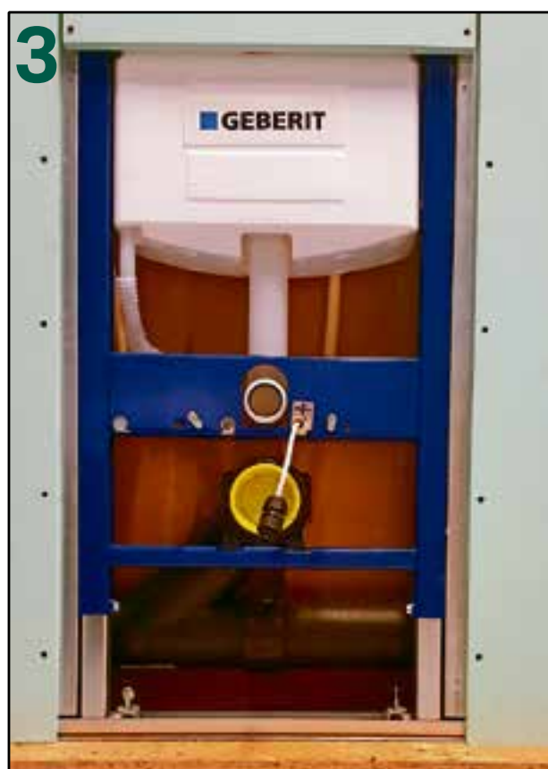
3 Breng het snoer aan en indien er direct een Geberit AquaClean douchewc wordt geplaatst dient de bijgeleverde aansluitstekker gemonteerd te worden en kan de spatwaterdichte lasdoos achterwege blijven.