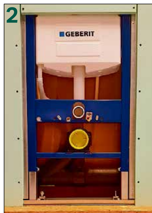
2 Fixeer de ribbenbuis met de twee flexbuisclips op het inbouwreservoir.