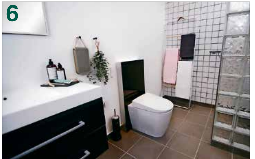
Het eindresultaat, in slechts een paar uur gerealiseerd met behulp van de Monolith sanitairmodule.