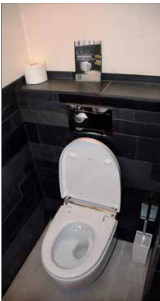
In het toilet van de kamers in De Droomhoeve is een verwijzing naar Test@hotel aanwezig.

Installateurs krijgen van steeds meer klanten de vraag of ze ergens een douchewc kunnen testen. Menigeen beschikt inmiddels over een testlocatie, bijvoorbeeld in de showroom waarmee wordt samengewerkt of zelfs bij de installateur thuis. Dit is niet voor iedereen weggelegd. Maar voor hen is er geen nood aan de man. Geberit werkt samen met een aantal gerenommeerde hotels en één bed and breakfast waar een Geberit AquaClean kan worden getest. Niet voor niets heet dit programma Test@hotel.