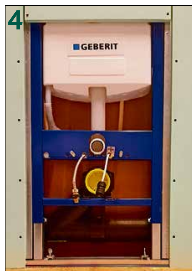
4 Voer de bijgeleverde waterslang door en sluit deze middels het meegeleverde Y-stukje aan op de hoekstopkraan.