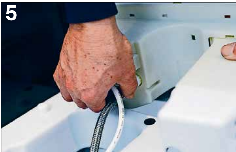
De aansluitingen voor elektriciteit en water zijn onzichtbaar in het closet weggewerkt.