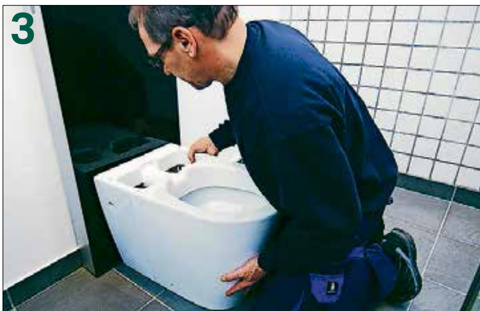
De Geberit AquaClean douchewc wordt aan de Monolith sanitairmodule bevestigd, zodat alles precies past.