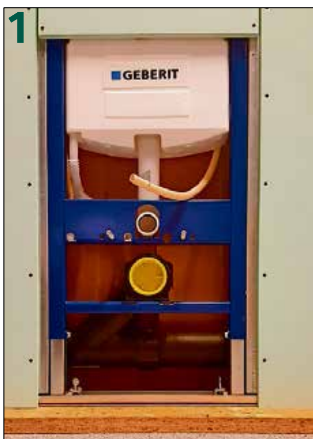
1 Breng de ribbenbuis vanuit de centraaldoos naar het inbouwreservoir

Geberit inbouwreservoirs bieden een uitgebreid geteste oplossing voor nieuwe badkamers. Alle noodzakelijke aansluitingen worden van tevoren gepland, zodat alle Geberit AquaClean modellen probleemloos kunnen worden geïnstalleerd en aangesloten op de water- en elektriciteitsaansluitingen. Geberit adviseert installateurs om direct een stroompunt voor te bereiden bij de montage van een inbouwreservoir, ook al heb je dat niet direct nodig.