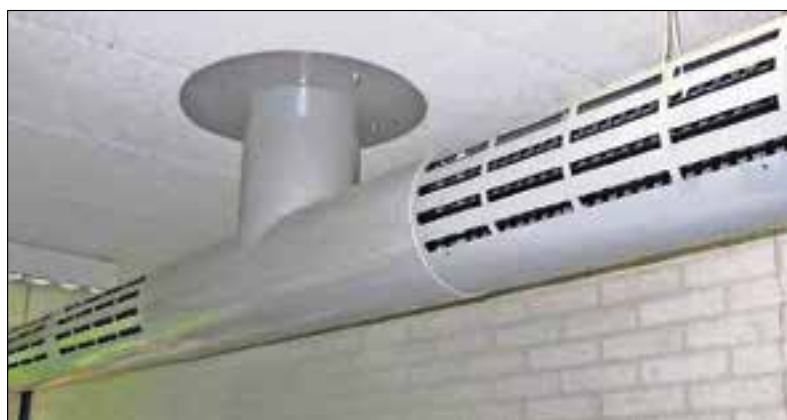
Er zijn twee nieuwe verordeningen voor ventilatiesystemen.

In de praktijk blijkt het niet eenvoudig om de verordeningen te interpreteren. UNETO-VNI en VLA kregen er veel vragen over. Van daar deze handleiding.