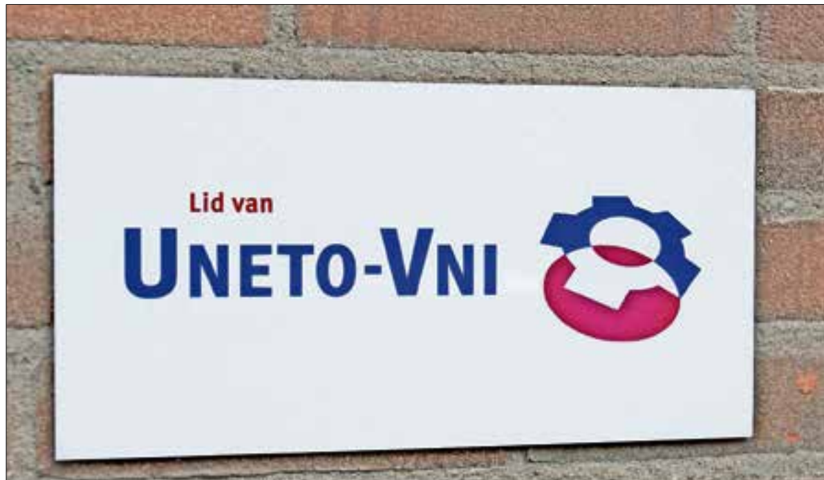
Op 15 januari worden de bordjes verhangen, ook aan de muur bij veel installatiebedrijven.