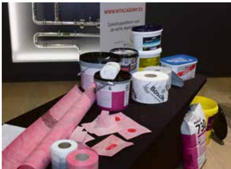
Goede producten zijn een voorwaarde voor een waterdichte douchevloer.

Schrijf u nu gratis in voor het seminar op 17 januari 2019 via www.geberit.nl/waterdichtdouchevloer . Wees er snel bij, want er zijn al aanmeldingen binnen.