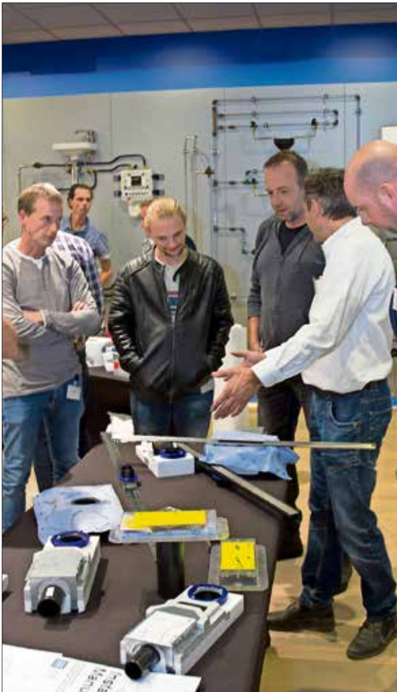
Tijdens het seminar worden de oplossingen van Geberit getoond.

Met succes: rond de 40 tegelzetter, installateurs en toonzaaladviseurs waren bij het seminar aanwezig in het Geberit Trainingscentrum in Nieuwegein. Naast een theorie-deel in het cursuslokaal vond er ook een