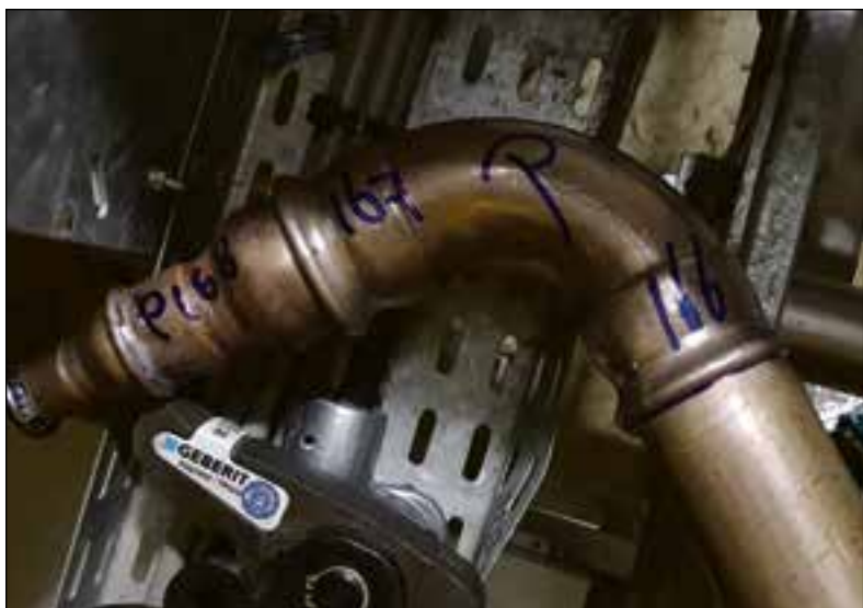
De leidingen zijn afgetekend.

De oorspronkelijke leidingen op het platform zijn van rvs, maar dat materiaal voldoet niet meer aan de huidige eisen van veiligheid. Daarom is gezocht naar een ander materiaal. Buienhuis: "In