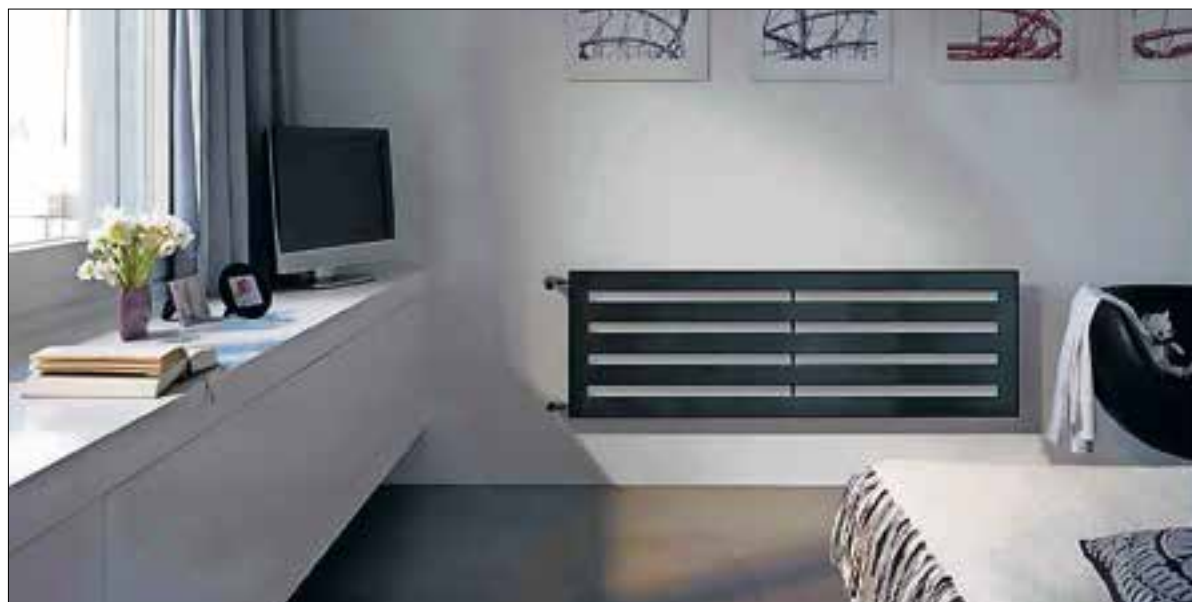
De Zehnder Metropolitan.