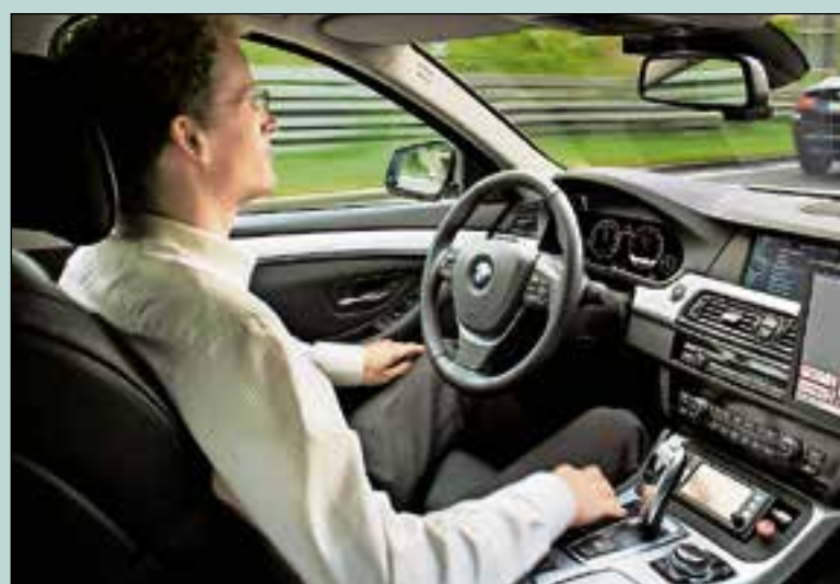
De zelfrijdende auto moet ook nadenken over verkeerssituaties.

"Zelfs als mensen het eens zouden kunnen worden over de vraag op welke vlakken zelfrijdende auto's veiliger zouden moeten zijn dan mensen, is nog niet gezegd dat de zelfsturende auto door iedereen wordt omarmd. Met nieuwe medicijnen moeten tests uitwijzen of het medicijn daadwerkelijk mensen beter maakt in plaats van dat er mensen ziek van worden. Dat moet met de zelfsturende auto ook. Testritten in allerlei omstandigheden zijn nodig om aan te tonen dat dit het geval is of niet", aldus Evans.