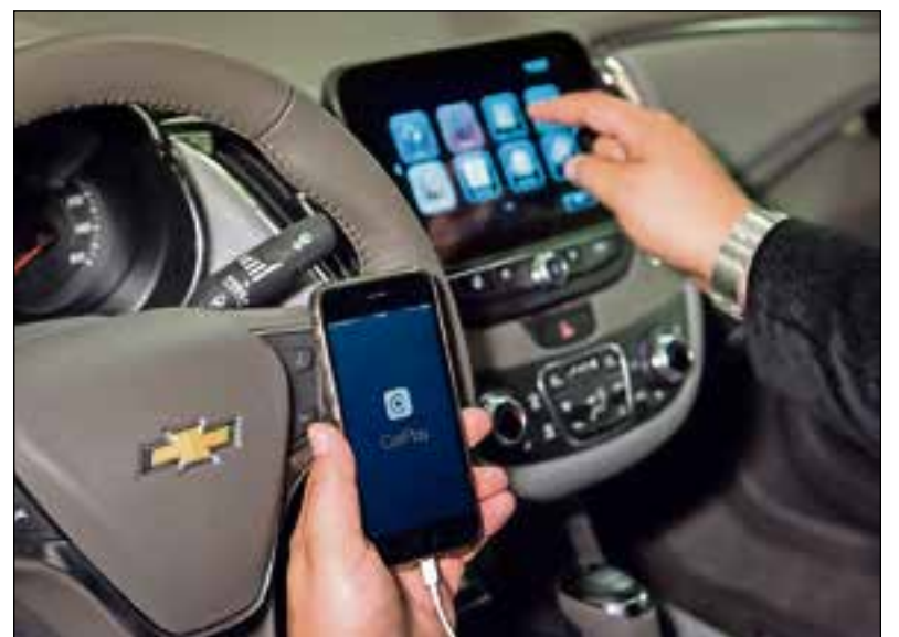
Experts buigen zich over veilig gebruik in de auto van de smartphone.

Begin september houdt Interpolis een 24 uur durende werksessie, waarbij de experts gezamenlijk werken aan een oplossing voor het probleem. Het is de bedoeling om de resultaten in september aan de minister aan te bieden.