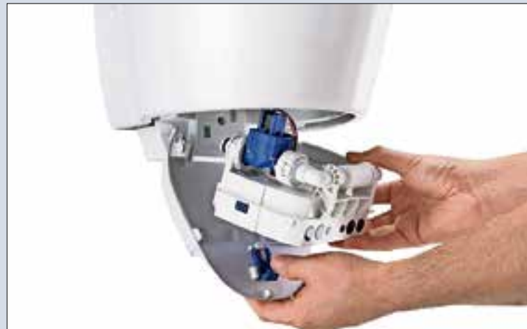
Het docking station onder het urinoir is eenvoudig te verwijderen.

In het docking station zit de geïntegreerde urinoirsturing. Deze bevat de bedieningselektronica, de elektrische voeding en een magneetklep. Daardoor heeft u slechts één hand nodig om het docking station te verwijderen. U hoeft er zelfs het water niet voor af te sluiten.