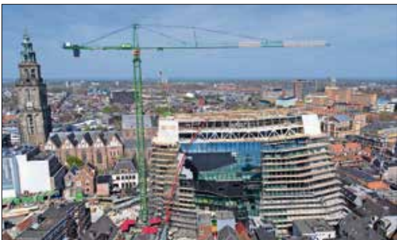
De omvang van het Groninger Forum is duidelijk te zien: de Martinitoren wordt zowat in de schaduw gezet.

Huter, dat begin deze eeuw is overgenomen door Geberit, is van origine gespecialiseerd in geprefabriceerde badkamerunits waar bijvoorbeeld in de hotelwereld en in projecten waar snel moet worden opgeleverd, gebruik van wordt gemaakt. De complete badkamerunit of desgewenst een deel ervan wordt in een geconditioneerde omgeving in de fabriek gebouwd, waarna op de bouwplaats alleen nog de leidingen worden aangesloten, althans voor zover die niet in het element zijn verwerkt.