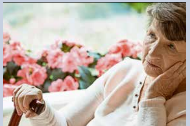
Goede ventilatie is heilzaam voor Alzheimerpatiënten.

Op www.zehnder.nl kunt u het volledige onderzoekresultaat lezen.