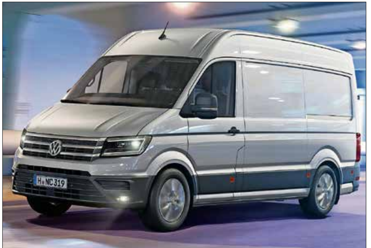
De VW Crafter is ondanks z'n formaat een ranke verschijning.

Voor de gelegenheid hadden we de beschikking over een L3H3-uitvoering, de langste en hoogste uitvoering die er is. De lengte daarvan is bijna 6 meter en de hoogte nagenoeg 2,60 meter. Dat