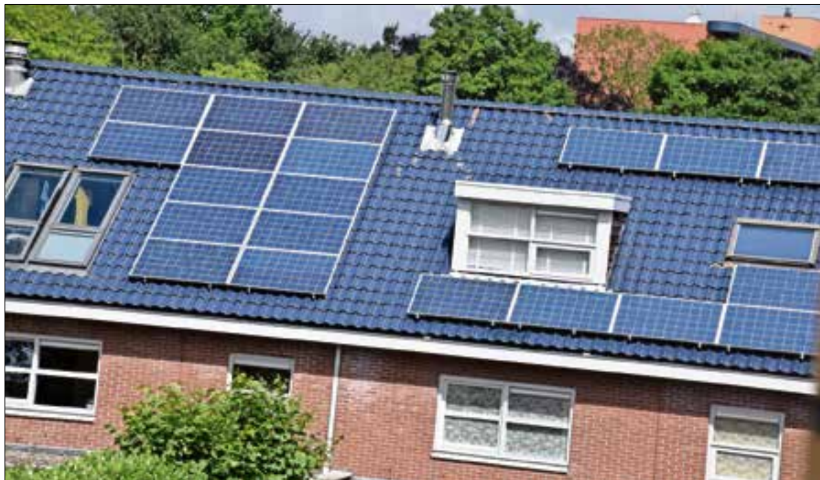
De investering in zonnepanelen moet kunnen worden terugverdiend.