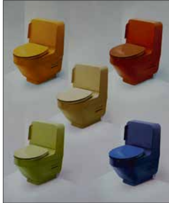
Een jaar na Geberella werd de 'Geberit-O-Mat' geïntroduceerd, het eerste complete systeem.

Een zakelijk succes werd het echter niet vanwege culturele verschillen van inzicht in het Europa van toen. Maar toen het patent van Maurer in 1977 afliep, grepen de Japanners hun kans. Het eerste Japanse product werd gelanceerd in 1980. Amper twee jaar later waren er al 20 leveranciers van douchetoiletten op de Japanse markt actief.