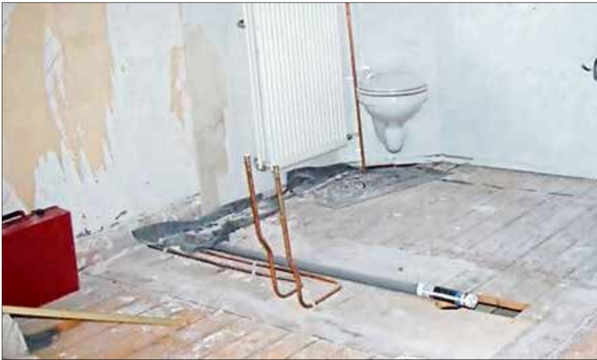
Steeds meer mensen renoveren hun badkamer.

In 2017 14 procent meer gerenoveerde badkamers