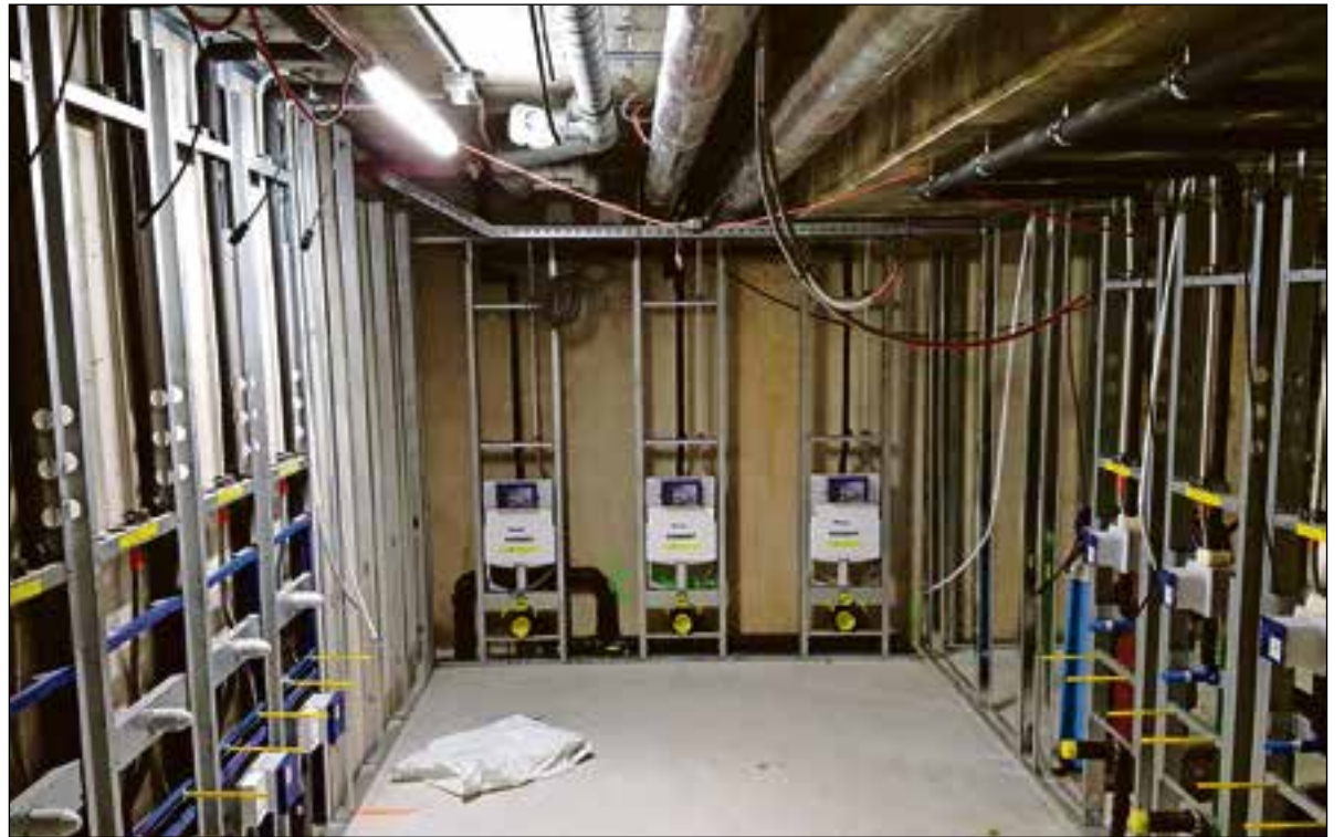
De urinoirs, toiletten en kranen zijn geïnstalleerd in Huter prefab-elementen van Geberit.