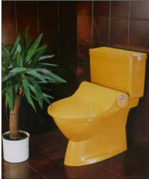
Het begon 40 jaar geleden allemaal met de Geberit douchewc Geberella, die in vele kleuren uitgevoerd was.

Naast het land van de rijzende zon is Japan ook het land van de douchewc's. In geen enkel ander land is een zachte reiniging met water zo diepgeworteld en wijdverspreid als in Japan. De wc's die je reinigen met water zijn werkelijk overal te vinden in Japan: van hotels tot en met treinstations en tempels. De Japanners, die bekend staan om hun hoge eisen aan lichaamsverzorging en persoonlijke hygiëne, erkenden al vroeg de voordelen van deze ingenieuze combinatie van toilet en bidet en zorgden ervoor dat deze innovatie begin jaren tachtig snel een succes werd. Sindsdien zijn er - volgens het vakblad Asiaspiegel - ruim 30 miljoen van deze zogeheten 'washlets' verkocht. Inmiddels heeft bijna 80 procent van alle Japanse huishoudens een douchewc.