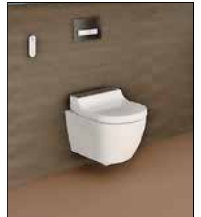
De AquaClean Tuma is een van de succesvolle douchewc's van Geberit.

Ga naar www.geberit-aquaclean.nl/40jaargeschiedenis voor meer over de geschiedenis van de douchewc.