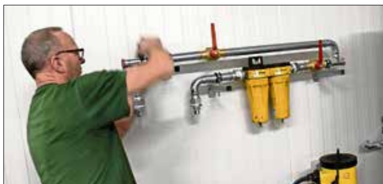
Er is weer subsidie beschikbaar voor projecten die zich richten op duurzame inzet van installateurs.

Meer informatie is te vinden op uitvoeringvanbeleidszw.nl .