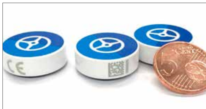
De SafeDrivePod is ongeveer zo groot als een munt van 5 eurocent.

De SafeDrivePod wordt ergens in de auto bevestigd en zendt een draadloos signaal uit om aan te geven of de auto rijdt. De app op je telefoon houdt bij of je aan het rijden bent en maakt dan de toegang tot alle apps onmogelijk. Alleen handsfree bellen en navigatie-apps zijn nog mogelijk. En dan, wat op de website van TLN het belangrijkste wordt genoemd: "Je baas krijgt een mailtje als je de app op je telefoon hebt uitgezet. De baas heeft met jou een afspraak dat jij veilig thuis komt, en de auto ook!"