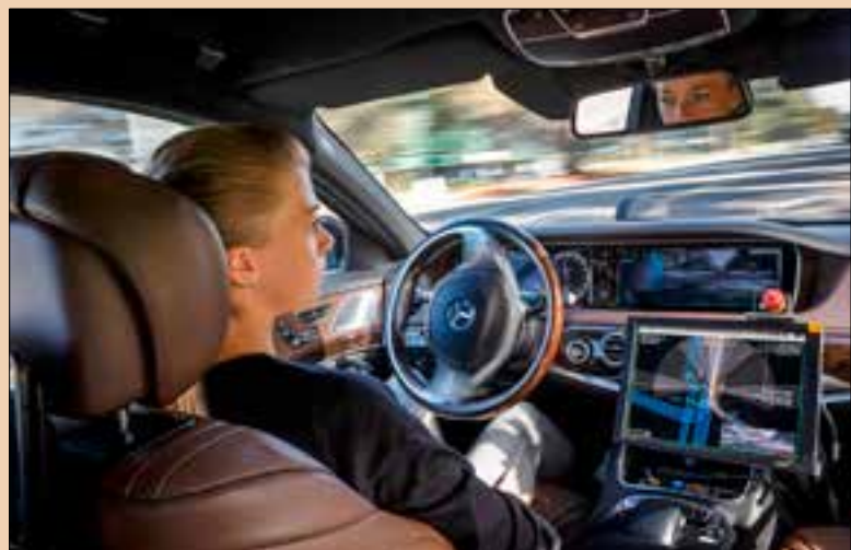
MercedesBenz heeft al een auto die vrijwel geheel zelfstandig kan rijden.