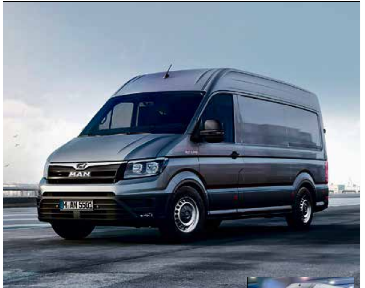
De MAN TGE met als inzet de VW Crafter: zoek de verschillen?

De TGE is volgens MAN dan ook 'uitermate geschikt voor de bouw' en biedt een grote keus aan carrossievormen, natuurlijk Euro 6 dieselmotoren en drie verschillende aandrijflijnen: afhankelijk van het totale toegelaten gewicht is er een keuze uit voorwiel-, achterwiel- en 4MOTION-aandrijving. In alle gevallen is die aandrijving te combineren met een handgeschakelde zesversnellingsbak of een achtrups automaat. De TGE beschikt verder over een chassis dat met specifieke opbouw- en toepassingsmogelijkheden 'custom made' te maken is. Maar omdat dat best een dure grap kan zijn, biedt MAN de TGE ook de mogelijkheid via de fabrikant een mobiele werkplaats mee te leveren. En voor wie het echt weten wil: later in het jaar komt er ook een pick-up.