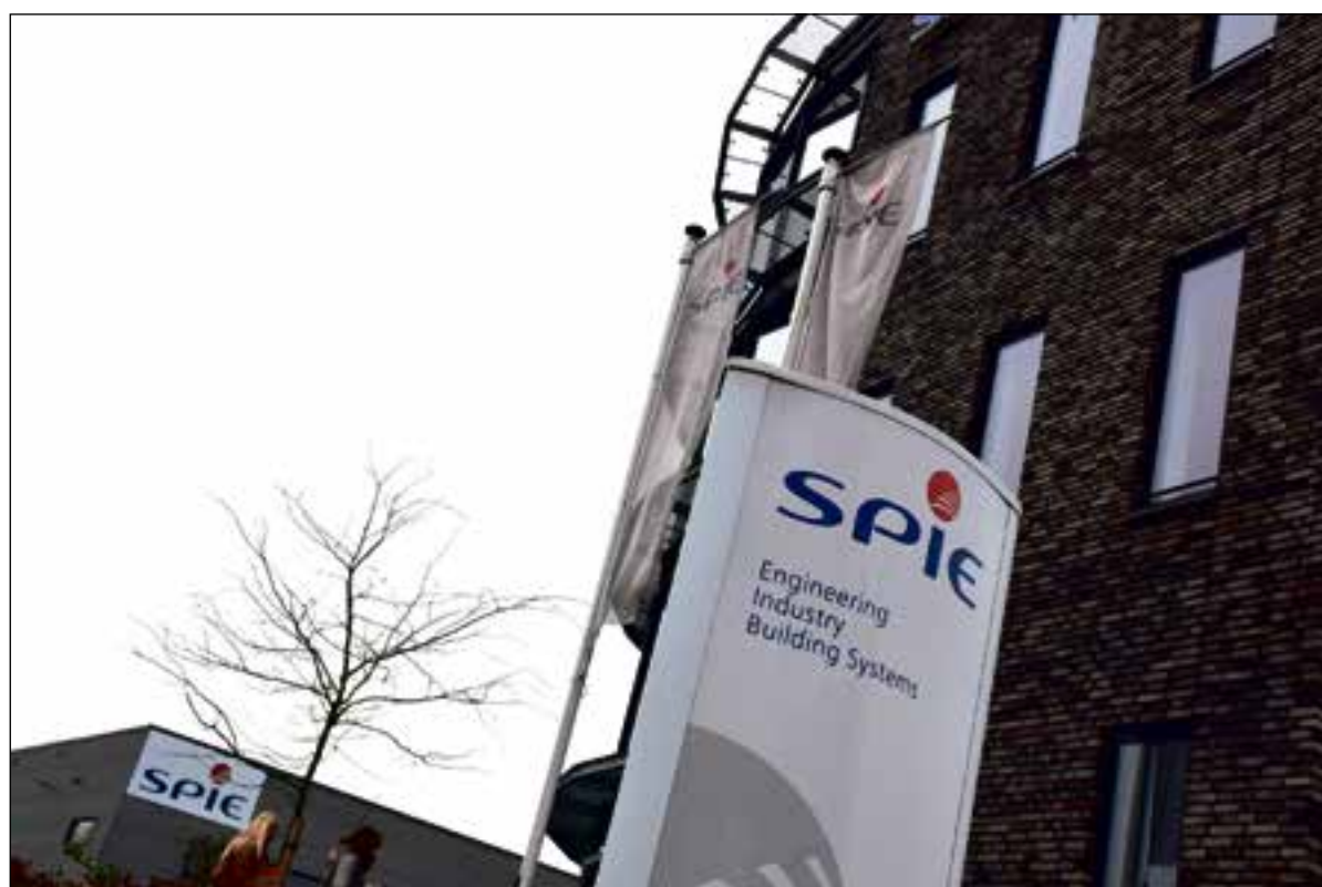
Het kantoor van Spie Building Systems in Elsloo.