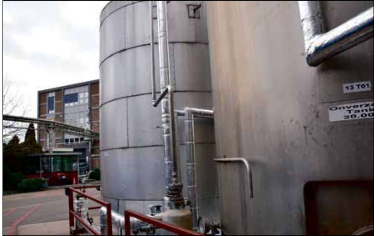
De Geberit Mapress leidingen zijn duidelijk zichtbaar op de tijdelijke buitenplant.

Inmiddels is helder dat het Mapress leidingsysteem voldoet en in de nieuwe productiehal annex