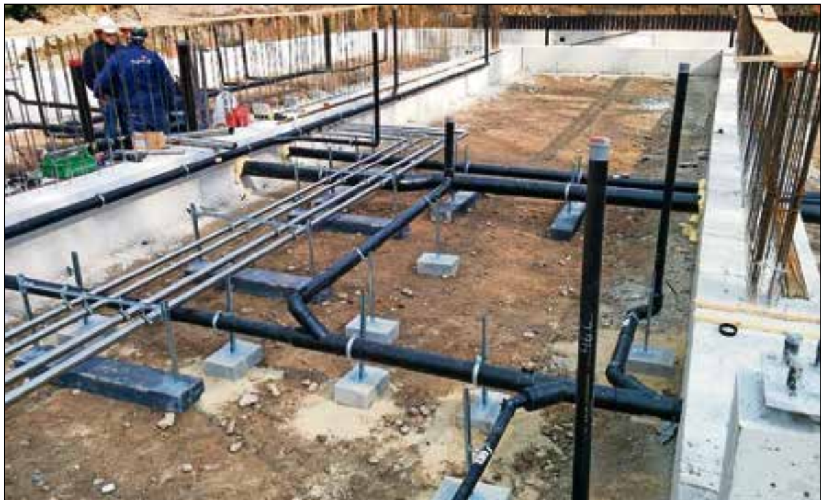
Bij de nieuwbouw van Château St. Gerlach in Valkenburg zijn Geberit PE-leidingen geïnstalleerd.

Momenteel heeft SPIE Building Systems Elsloo een aantal projecten onder handen die de diversiteit goed weergeven. Recent heeft het het distributiecentrum van