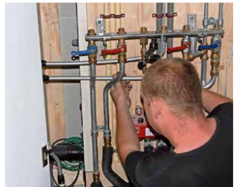
Er dreigt een tekort aan vakmensen in de installatiebranche.

Hij vindt ook dat het geld voor onderwijs niet bij voorbaat gelijk