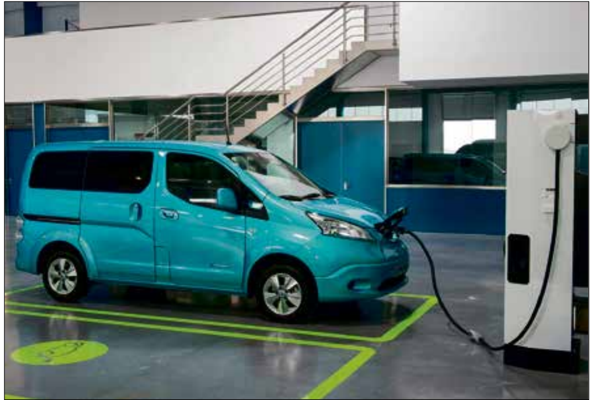
Nissan heeft de e-NV200 als elektrische bestelauto in het gamma.

stroom aan Renaults R75 elektromotor, een 76 pk sterke unit die we kennen uit de Renault Zoe. De bus heeft een topsnelheid van 115 km/h en heeft een actieradius van 200 kilometer. In zes uur is de Master Z.E. weer volledig opgeladen. Voor wat betreft de lading: de Master Z.E. is er in de modellen L1H1, L2H2, L3H2 en L3 Platform Cabine, die geschikt is voor een opbouw. Voor de goede orde: L1H1 staat voor de kleinste lengte en meest geringe hoogte, enzovoort. Renault had eerder al de elektrische bedrijfswagens Twingo