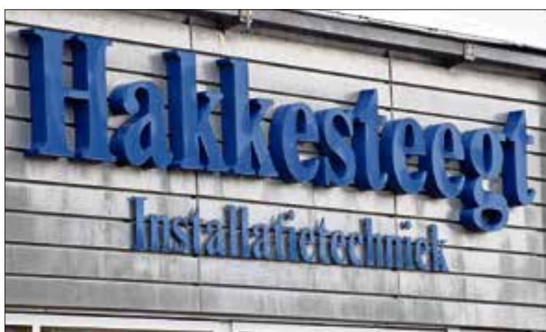
Hakkesteegt is al sinds 1980 een bekend fenomeen in Groot-Ammerz.

Momenteel heeft Hakkesteegt rond de 25 medewerkers en dat aantal was en is stabiel. "We zijn de crisis goed doorgekomen. De woningbouw lag in die jaren nagenoeg stil, maar onder andere omdat we een aantal vaste opdrachtgevers hebben, waaronder een woningbouwvereniging, hebben we geen mensen hoeven ontslaan en daar zijn we best trots op. Wij hebben een relatief jong medewerkersbestand en bieden jongeren ook graag een stageplek aan. Daarvoor werken we samen met de vakschool in Gorinchem. Heel af en toe blijft een goede jongen hangen en dat is waarvoor je het doet, want het vinden van goede medewerkers wordt natuurlijk wel een uitdaging. Maar voorlopig kunnen wij het nog goed handelen."