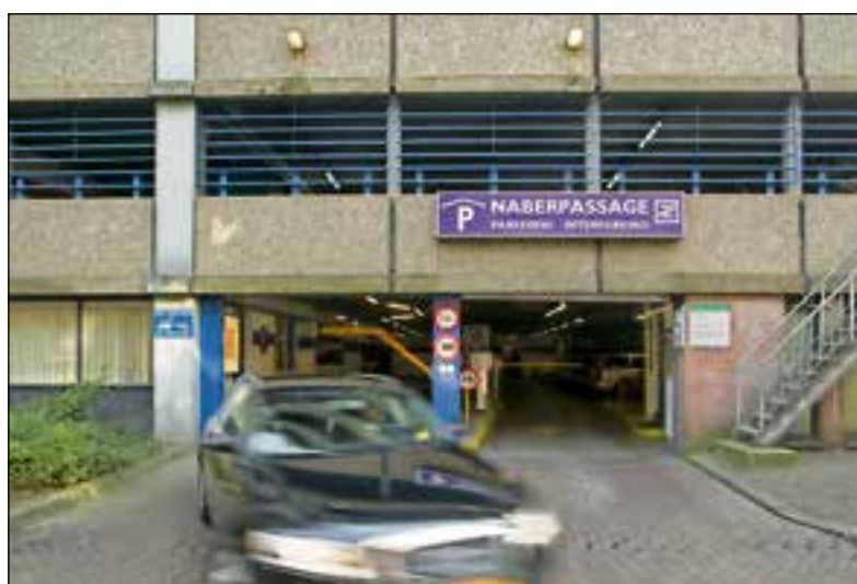
In Groningen wordt de hand gelicht met de door de gemeente verordonnerde maximum snelheid van 5 km/uur, want in deze garage mag je wel 15 km/uur.

Die 15 km/uur komt niet uit de lucht vallen. De Hoge Raad heeft namelijk in 1999 bepaald dat 15 km/uur stapvoets is (langzamer kan een auto ook bijna niet, maar dat terzijde). Dit betekent meteen ook dat een bepaling in de algemene voorwaarden voor het gebruik van parkeergarages van de gemeente Haarlem, waarin staat dat de maximumsnelheid van 5 km/uur is, in feite onhaalbaar is. Conclusie: 15 km/uur is stapvoets en deze snelheid is in een parkeergarage acceptabel. Maar ja, leg dat maar eens uit als je een bon krijgt in Haarlem of Groningen.