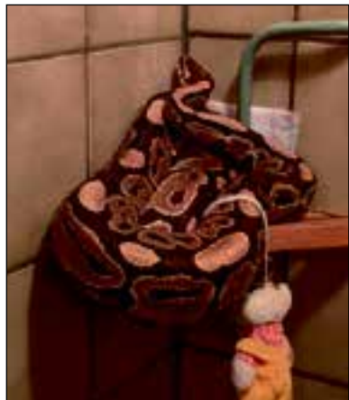
De slang zoals de politie deze aantroef op de foto zette.

Mogelijk denkt u na het lezen van dit bericht: 'Ja, kunst, Texas, daar heb je ratelslangen. In Nederland heb je hooguit een tuinslang en die kruipt niet, dus geen paniek.' Dat is een denkfout. Afgelopen december kreeg een inwoner van de Pijp in Amsterdam de schrik van zijn leven toen hij op zijn toilet een python vond die om de leiding gekruild zat. De bewoner belde meteen de politie, die het ongenodigde bezoek op foto's vastlegde en natuurlijk de slang door de die-ren ambulance liet weghalen.