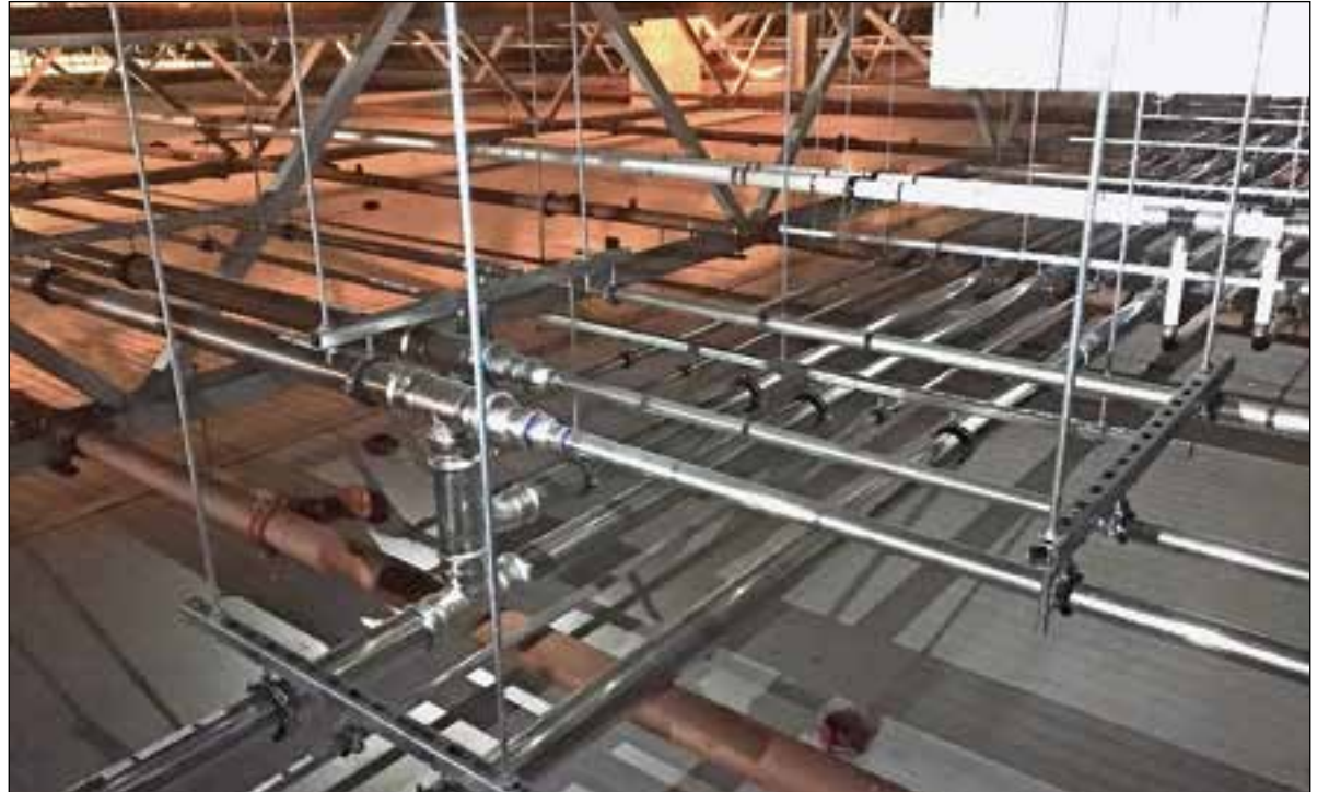
Het indrukwekkende leidingennetwerk op de zolder van de productiehal.