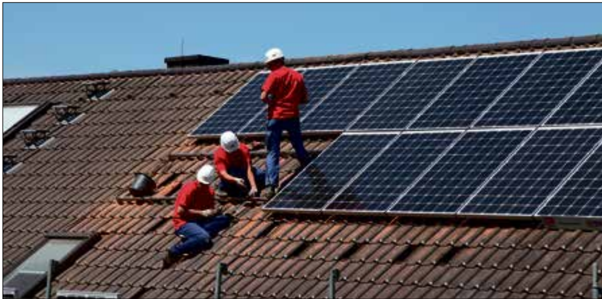
Om verder te verduurzamen zijn overheidsmaatregelen nodig.