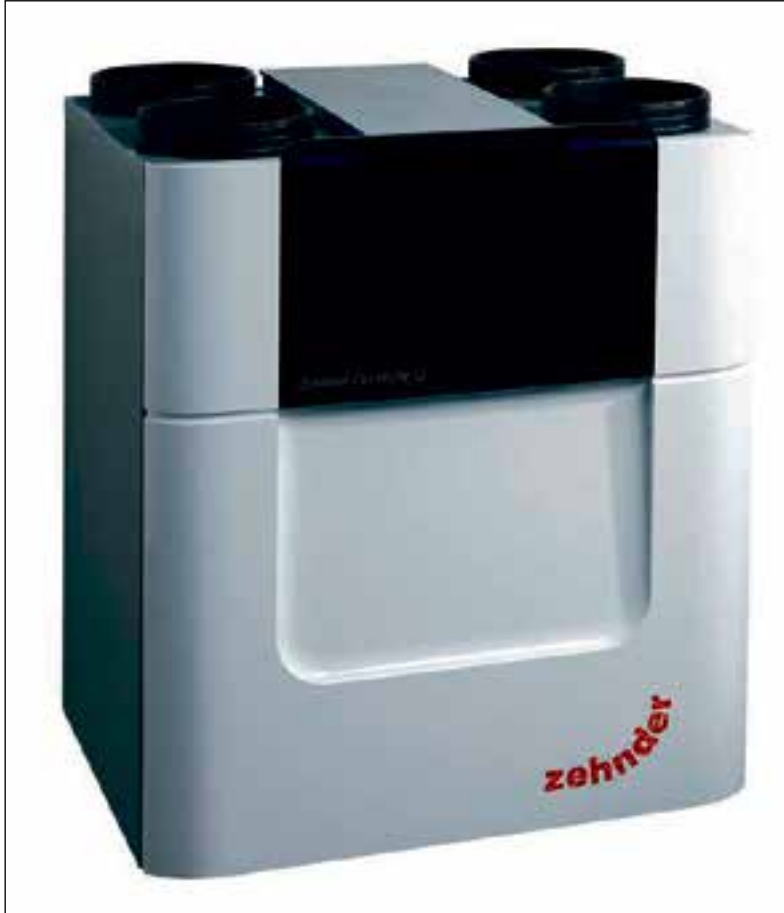
De Zehnder ComfoAir Q.

Meer informatie is te vinden op www.zehnder.nl .