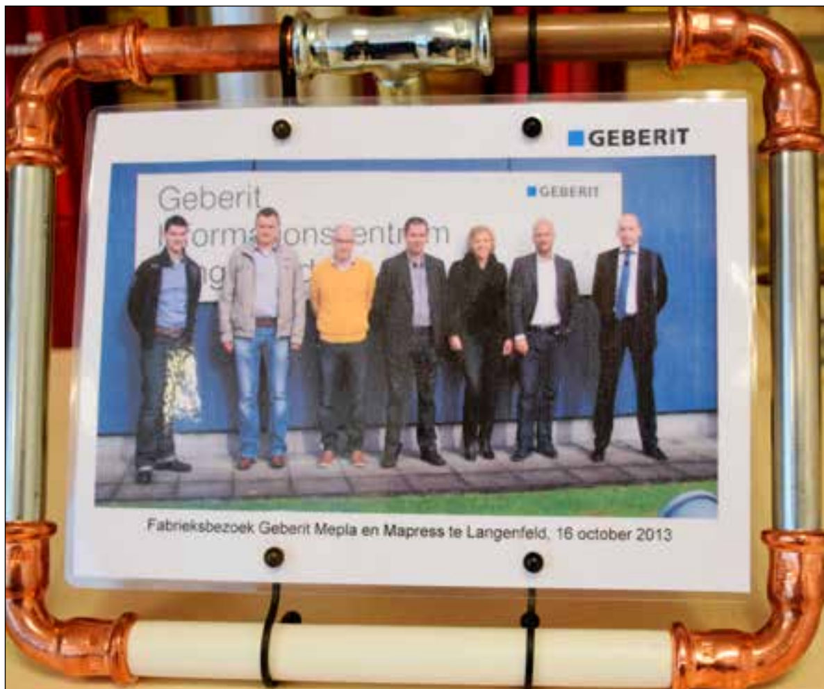
Het bezoek aan de fabriek van Mapress in Langenfeld in 2013 staat nog steeds in het geheugen (en op de kast).