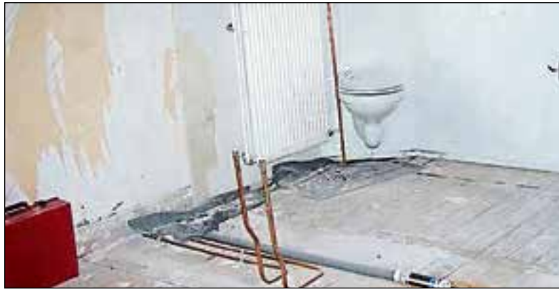
Een verbouwing van een badkamer is een ingrijpende en dure gebeurtenis.

Coen Hagendoorn Bouwgroep en combinatie B&U gaan in één dag een badkamer vernieuwen in een bewoond pand van corporatie Mitros. Dit is de prijs die zij wonnen met de zogeheten Badkamerrenovatie in één dag-challenge: een prijsvraag die was uitgeschreven door de Utrechtse woningcorporatie Mitros om partijen te bewegen na te denken over de renovatie van een badkamer in één dag. Er deden liefst 33 partijen mee aan de uitdaging. Voor Mitros is deze onverwacht grote interesse aanleiding om vaker dit soort prijsvragen uit te schrijven.