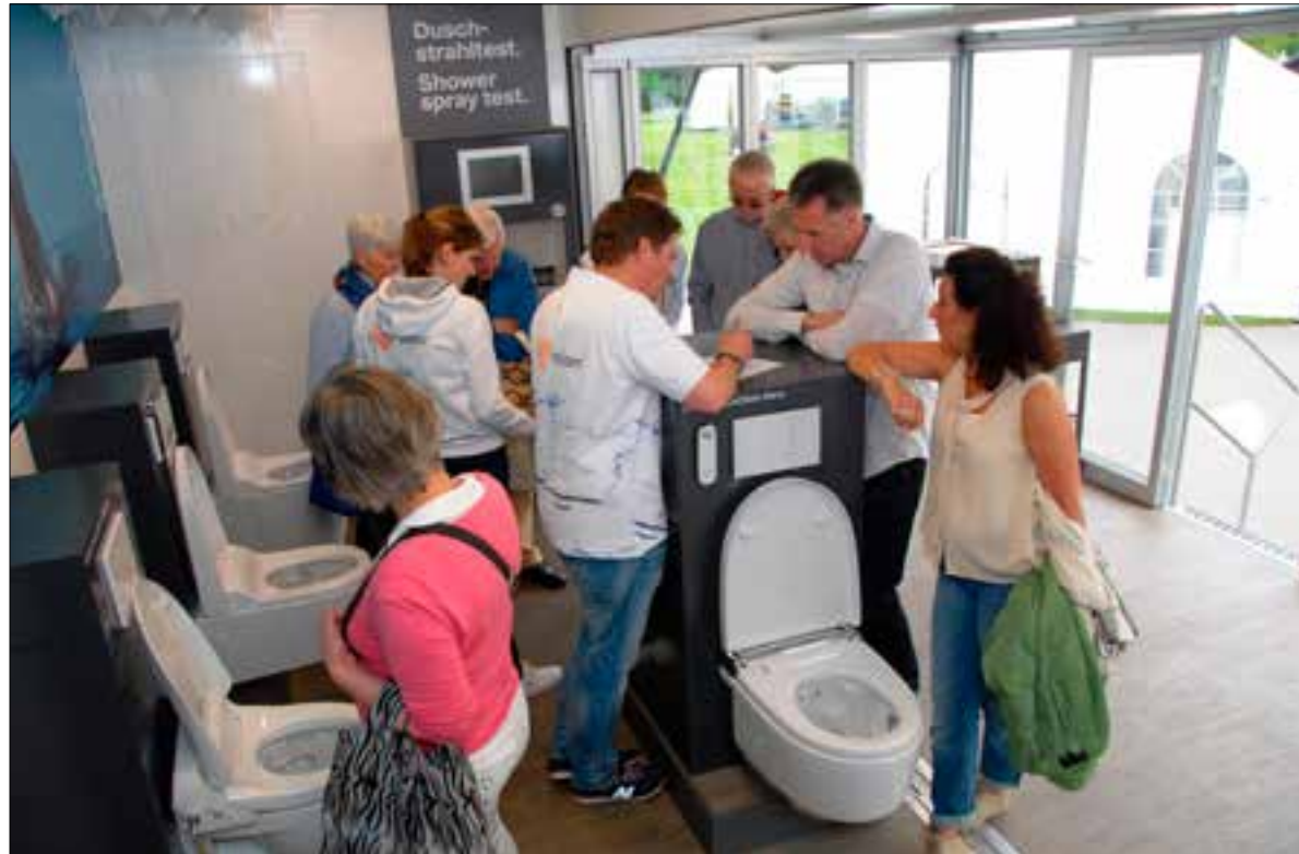
Het is een drukte van belang in de truck van de Geberit AquaClean.

En met ervaren bedoelen we ervaren in optima forma: in de opvallende truck zijn naast verschillende modellen van de Geberit AquaClean en een apparaat waarin je met je handen de waterstraal kunt ervaren, ook twee toiletten waar geïnteresseerden gebruik van kunnen maken. Geberit ziet de campagne als een extra stap in de richting van een nieuwe hygiëncultuur in Nederland en uit de reacties kan worden vastgesteld dat die stap ruimschoots wordt gezet.