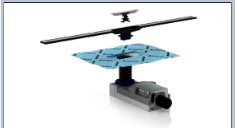
Het verwerken van de CleanLine is een eenvoudige klus.

Een belangrijke reden om klanten te wijzen op de CleanLine is voor Boonstra het design. "Het geheel ziet er exclusief uit en de goot is goed te verwerken."