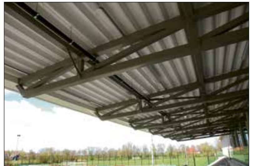
Het Geberit Pluvia systeem is voor de toeschouwers op de tribune duidelijk zichtbaar.