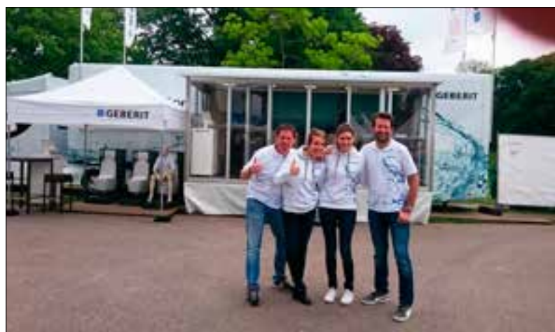
Het enthousiaste promotieteam.