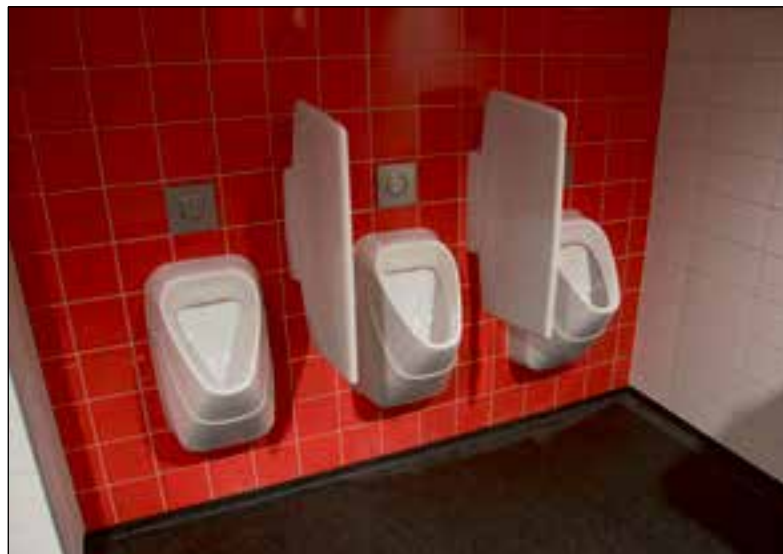
Geberit en Sphinx samen in een omgeving met de clubkleuren van AZ.

Bijzonder zichtbaar kenmerk is dat het licht aflopende dak begroeid is met zogeheten sedumplanten, waardoor het gebouw vanaf een afstand lijkt over te gaan in de groene voetbalvelden. Bovendien is dit milieuvriendelijk. De afvoerkanalen moesten hierdoor wel onzichtbaar worden weggewerkt (zie voor meer details hierover het hoofdartikel-red.).