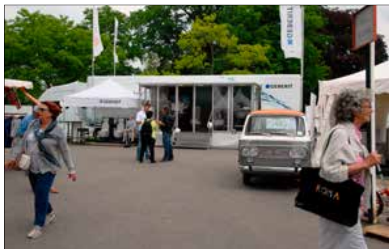
De Geberit AquaClean roadshow is niet te missen op het Italië Evenement.

Het druk bezochte Italië Evenement rond het pittoreske kasteel De Haar in Haarzuilens was het eerste event. In wat op het eerste gezicht een uithoek van het evenemententerrein lijkt, staat de truck keurig geparkeerd om bezoekers te informeren over de unieke kwaliteiten van de Geberit AquaClean. De locatie is echter ideaal. Allereerst omdat er twee paden samenkomen waardoor mensen zich gaan oriënteren en door het zien van de truck op de