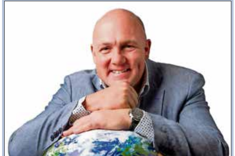
Er wordt tijdens Zehnder Connect een verbinding tot stand gebracht met André Kuipers.

Je kunt je aanmelden op zehnder.nl . Let op: er is een beperkt aantal plaatsen beschikbaar, dus wees er snel bij.