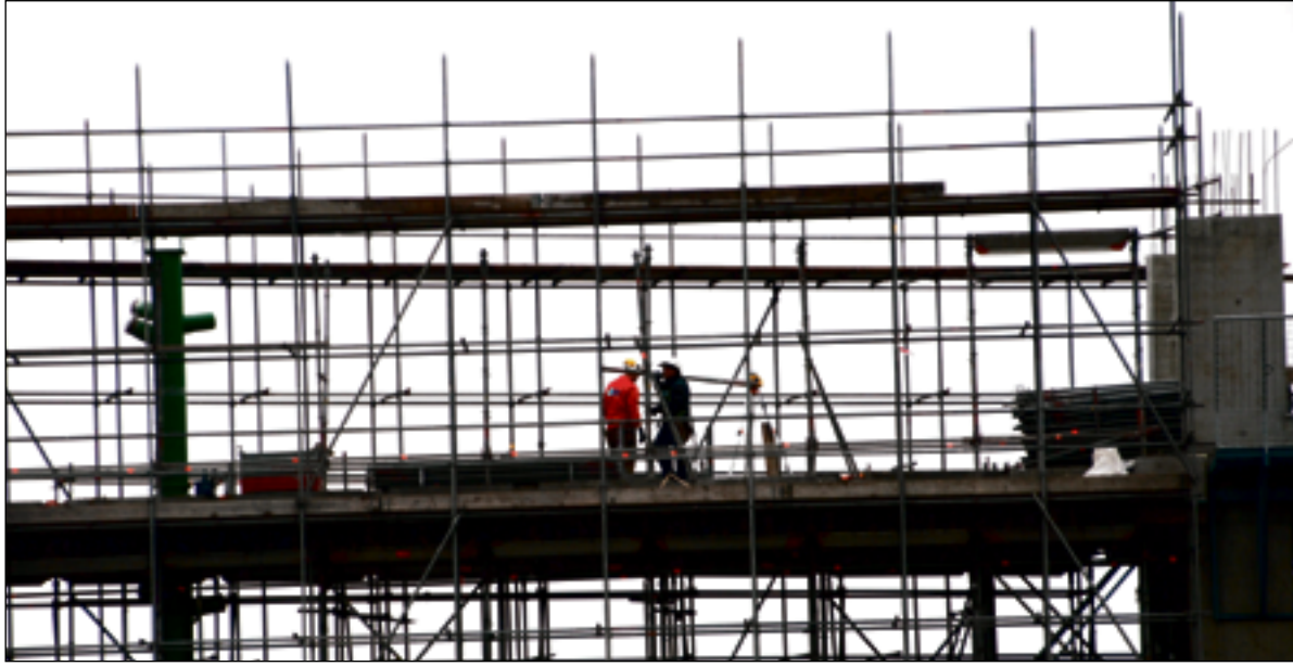
Veilig werken is het onderwerp in een nieuwe arbocatalogus.