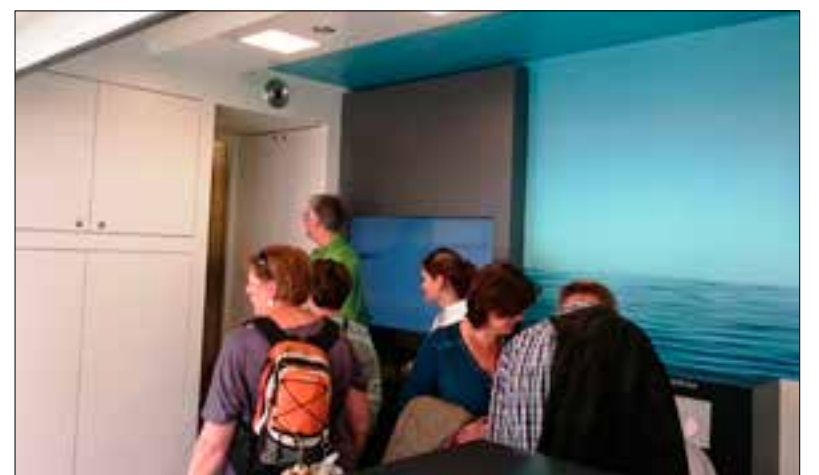
Er staan zelfs rijen voor de toiletten waar de AquaClean kan worden ervaren.