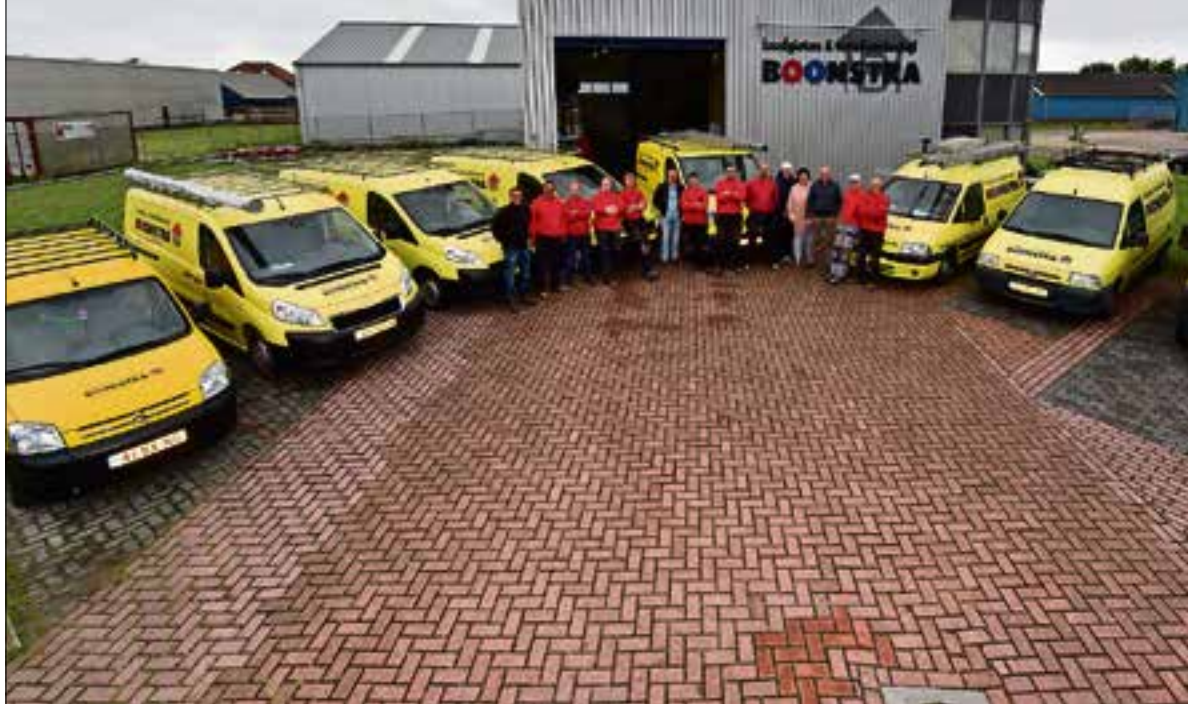
Het complete team van Loodgieters & Installatiebedrijf Boonstra in Stiens.

Wat is eigenlijk zijn geheim? Boonstra: "Mijn filosofie is dat je niet alles moet willen en dat je ook eens af en toe iets moet weggeven. Een dubbeltje weggeven om twee dubbeltjes te verdienen, is een solide verdienmodel. En