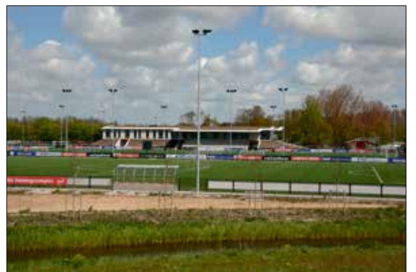
Het AFAS trainingscomplex is een blikvanger in een voornamelijk groene omgeving.