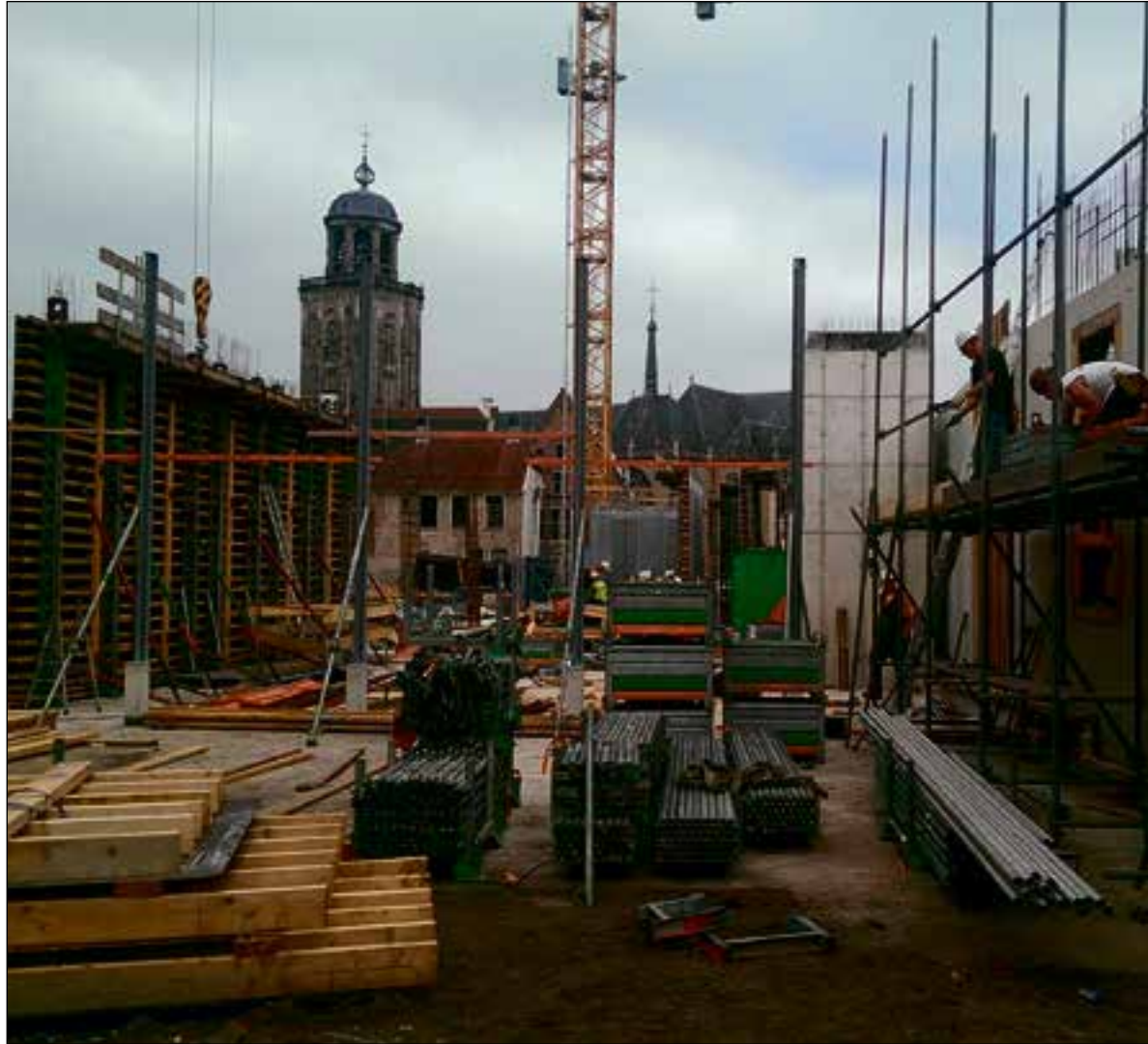
De bouw van het Stadhuiskwartier Deventer in volle gang.

Het pad erheen startte in mei 2013 toen BAM Utiliteitsbouw in Apeldoorn Van Niel Installatietechniek uitnodigde een offerte op te stellen voor alle sanitaire installaties, het systeem voor hemelwaterafvoer en een deel van de leidingen voor brandbestrijding in zowel het te renoveren oude gemeentehuis als de nieuwbouw die