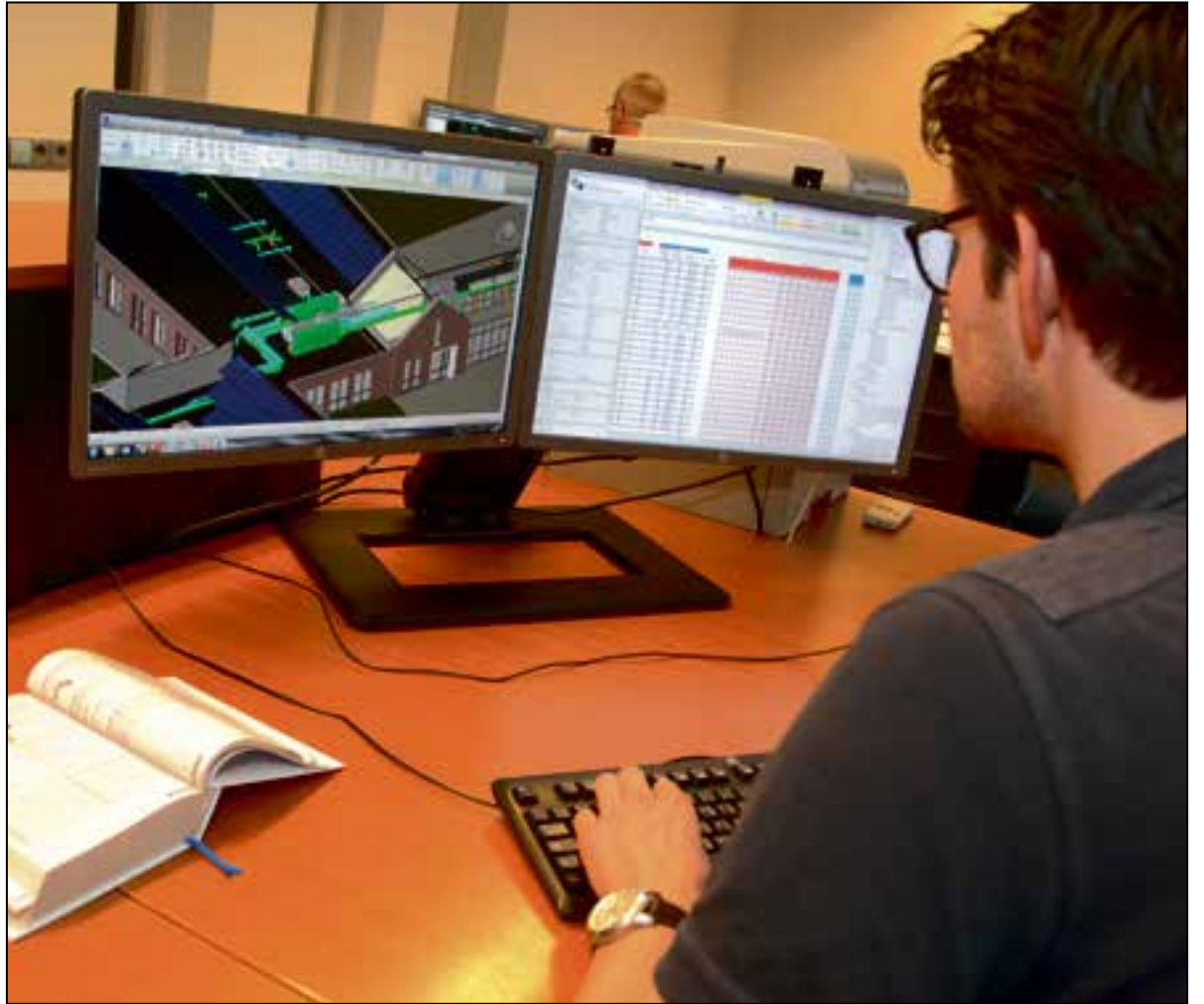
Een van de zes werkplekken bij tibo-veen waar wordt gebimd.

In het kwaliteitsdenken van tibo-veen past ook het uitgangspunt ‘Voorzorg voorkomt nazorg’. Oftewel: voorkomen is beter dan genezen. Hierom worden bij voorkeur