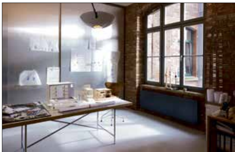
De Zehnder Lateo is een voorbeeld van stromingswarmte.

relatief kleine warmtehoeveelheid die snel voorradig is. Kleine convectoren - eventueel uitgerust met ventilatoren voor een sterkere circulatie - zorgen voor een veel snellere opwarming van de lucht dan een traag reagerende vloerverwarming. Dit levert meer comfort en besparing op de verwarmingskosten op, want een vloerverwarming moet constant warmte leveren om aan het comfort te voldoen. “Bij een wisselende en relatief lage warmtevraag heeft het gebruik van convectoren dus de voorkeur boven vloerverwarming. Op systeemniveau zijn convectoren ook goed te combineren met een warmtepomp die ‘s winters voor verwarming en ‘s zomers voor koeling zorgt.”