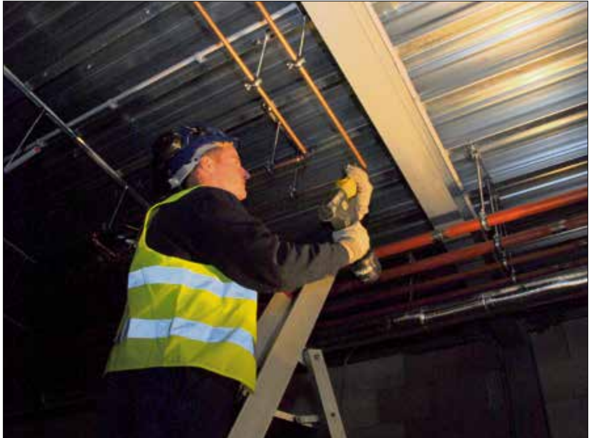
De Geberit Mapress die in het restaurant wordt geïnstalleerd wordt natuurlijk weggewerkt, in tegenstelling tot de leidingen in de dierenverblijven.