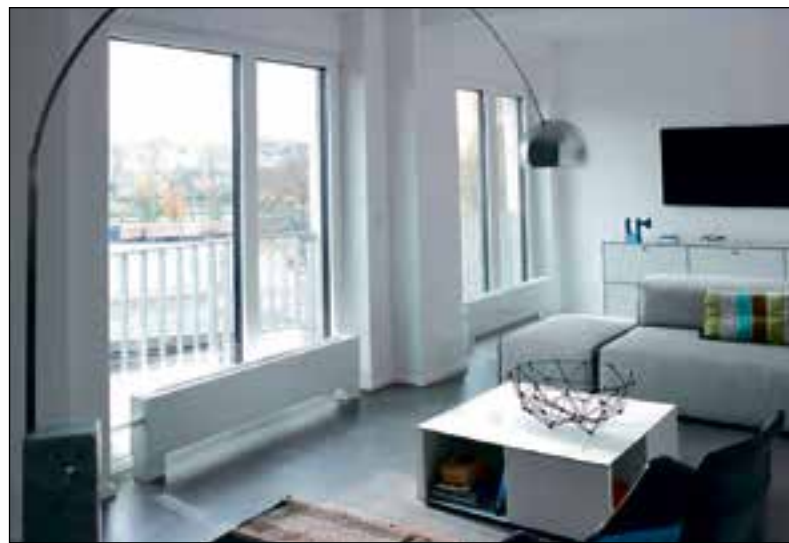
Dankzij Zehnder Stana kan verwarmde lucht zich optimaal in de ruimte verspreiden.