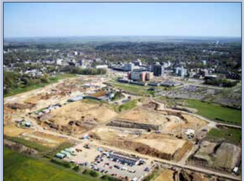
Wildlands Adventure Zoo wordt ruim twee keer zo groot als het huidige Noorder Dierenpark.

Naast Wildlands werkt De Groot Installatiegroep momenteel ook aan onder andere een nieuwe zuivelfabriek van Friesland Campina in Leeuwarden en aan een aantal ziekenhuizen.