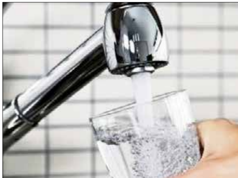
De norm NEN 1006 bevat alle eisen waar een leidingwaterinstallatie aan moet voldoen uit het oogpunt van volksgezondheid, veiligheid en doelmatigheid.

verwerkt en opgenomen worden in de herziening van NEN 1006: