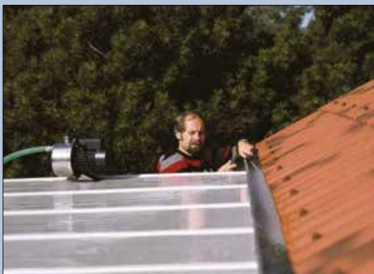
Opgevangen regenwater kan met behulp van een pomp makkelijk worden hergebruikt.

Om nuttig gebruik te maken van regenwater is het opvangen van water vanaf bijvoorbeeld daken of bestratingen voldoende. Dit is goed voor gemiddeld 46 procent van de waterbehoefte per jaar. In veel commerciële gebouwen en scholen kan de winst nog veel groter zijn. Verder vindt de installateur in de Grundfos Ecademy informatie over welke pompen je kunt gebruiken voor dompelbare of droog opgestelde oplossingen voor regenwater. Leer er meer over op de Grundfos Ecademy, www.grundfos.nl/ecademy .