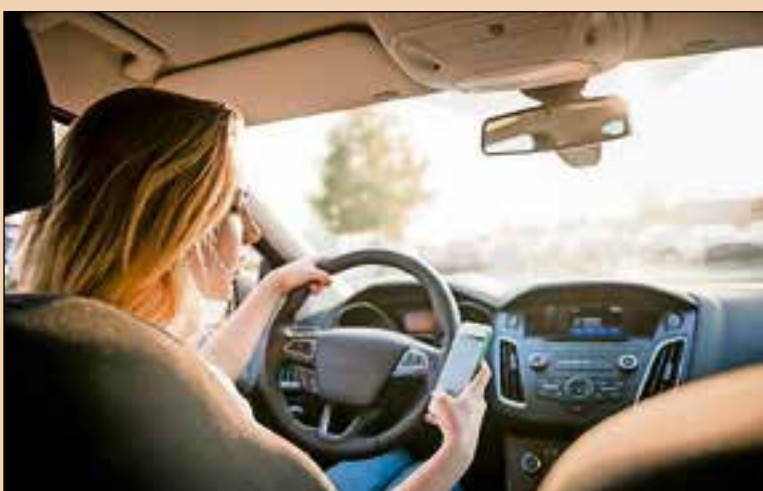
Naarmate iemand meer rijdt, wordt de smartphone meer gebruikt.

Het smartphonegebruik tijdens het autorijden hangt ook sterk samen met het aantal gereden kilometers per jaar: des te meer er wordt gereden, des te meer de telefoon wordt gebuikt. Bijvoorbeeld: bij een jaarkilometrage van 0 tot 10.000 kilometer per jaar geeft 52 procent aan de smartphone in de auto te gebruiken, tussen 10.000 en 20.000 geldt dit voor 72 procent, waarna de teller oploopt naar een gebruik door 82 procent van automobilisten die meer dan 20.000 kilometer rijden.