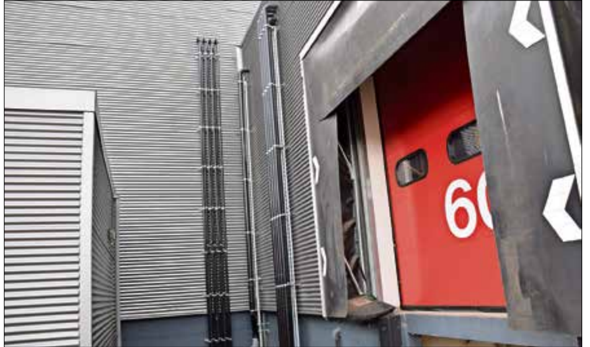
Rensa neemt het zekere voor het onzekere en dat is goed zichtbaar.

Geberit maakte, zoals dat altijd het geval is, alle berekeningen en op basis daarvan installeerde Technisch Buro Pola Zevenaar het nieuwe systeem, waarna het oude systeem vakkundig is verwijderd. Bolk zegt over deze logische volgorde: "Je kunt natuurlijk niet hebben dat er een zware regenbui