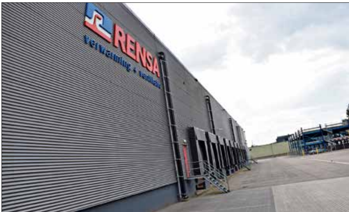
Aan de buitenkant van de bedrijfshal is duidelijk te zien dat er iets veranderd is om het hemelwaterafvoer te laten afvloeien.

Aan de buitenkant van DC4 is inmiddels goed te zien dat er iets veranderd is. Hier en daar zitten grote gaten in de wand van het oude systeem dat is verwijderd met vaak daarnaast en om de zoveel meter de PE-leidingen van de noodoverstort van het Geberit Pluvia systeem. Het is het zichtbare bewijs dat Rensa met het Geberit Pluvia systeem het zekere voor het onzekere heeft genomen.