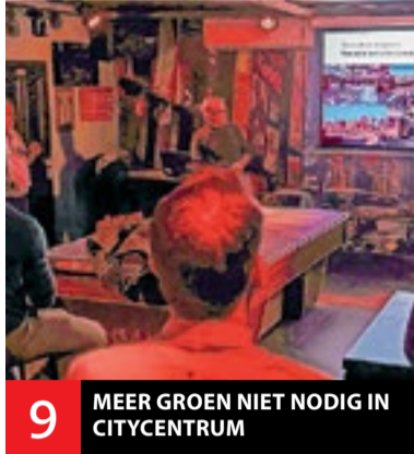
9 MEER GROEN NIET NODIG IN CITYCENTRUM