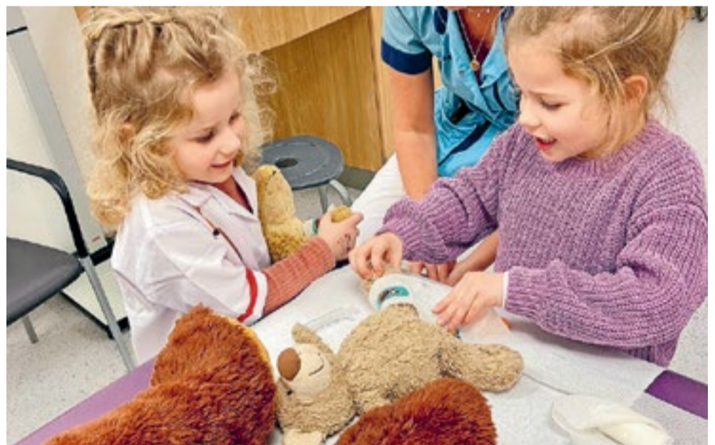
Máxima MC presenteert zaterdag 3 februari van 11.00 tot 13.00 uur het Teddyberenziemenhuis.