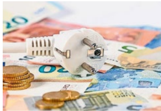
Geen energietoeslag gehad in 2023?

In verband met de privacywetgeving, wijst Veldhovens Weekblad de lezers erop dat zij met het insturen van een advertentie akkoord gaan met het vermelden van eventuele adresgegevens in de krant en daarmee tevens in het krantenarchief op het internet.