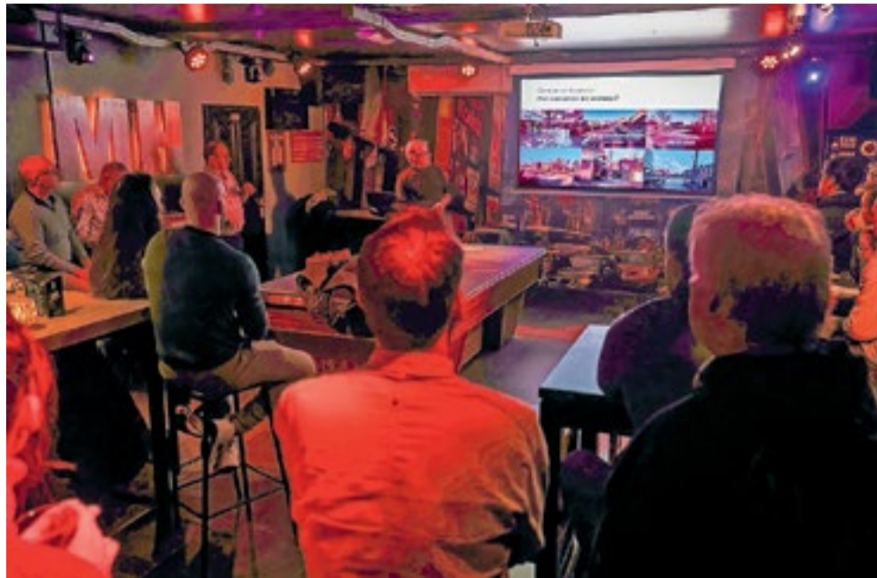
Circa 15 jongvolwassenen tot de leeftijd van 40 jaar zijn donderdag 11 januari aanwezig om hun mening te geven over de toekomst van het CityCentrum.

Er mag ook in de hoogte worden gebouwd. “Hoogte is voor mij geen probleem, er is een groot woningtekort. Groen is