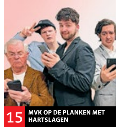
15 MVK OP DE PLANKEN MET HARTSLAGEN