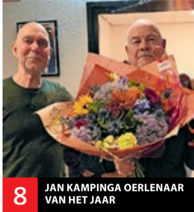
8 JAN KAMPINGA OERLENAAR VAN HET JAAR

De huis-aan-huiskrant van Veldhoven - Advertenties: adverteren@veldhovensweekblad.nl - Redactie: redactie@veldhovensweekblad.nl - www.veldhovensweekblad.nl