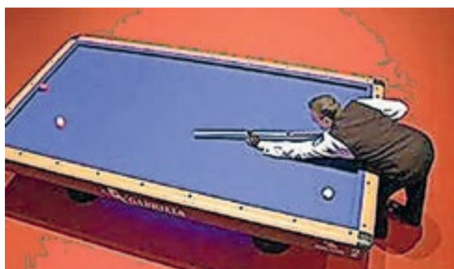
De organisatie van dit NK is in handen van Biljartvereniging D'n Babel, KNBB District Kempenland.

aan de finale. Zij spelen zaterdagavond en zondagmorgen vanaf 11.00 uur. Zondagmiddag rond 16.00 uur klinkt voor één van de finalisten het Wilhelmus als bekroning van zijn Nederlands Kampioenschap. De biljartpartijen gaan over 300 punten (caramboles). De spelers krijgen max. 12 beurten. Voor de gemiddelde biljarter zijn de deelnemers aan dit kampioenschap baltovenaars. Toegang gratis.