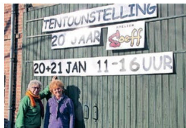
Atelier Soeff bestaat 20 jaar. FOTO: Atelier Soeff.

Zondag 21 januari 2024, 10.00 uur, gaat Pieter van Winden voor in de viering van Immanuel, de Protestantse Gemeente te Veldhoven. Het doortieners mede voorbereide thema is: Hoe ga je om met het vreemde? Ben je bang of benieuwd?. Ook online te volgen: immanuelkerkveldhoven.nl