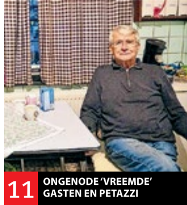
11 ONGENODE 'VREEMDE' GASTEN EN PETAZZI