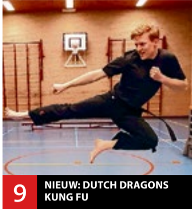
9 NIEUW: DUTCH DRAGONS KUNG FU

De huis-aan-huiskrant van Veldhoven - Advertenties: adverteren@veldhovensweekblad.nl - Redactie: redactie@veldhovensweekblad.nl - www.veldhovensweekblad.nl