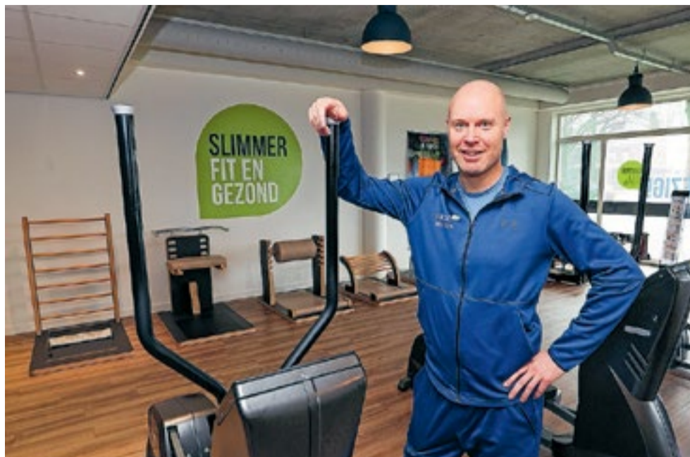
Mensen die prikkelgevoelig zijn, sporten niet zo graag in een sportschool waar de muziek het tempo van de sporters nog even opvoert. Bij SlimBezig hebben ze daar iets op bedacht...

Tijdens de prikkelarme middagen worden maximaal 6 sporters per half uur toegelaten tot de trainingsruimte zodat er altijd maximaal 12 tegelijk binnen kunnen zijn en er wordt