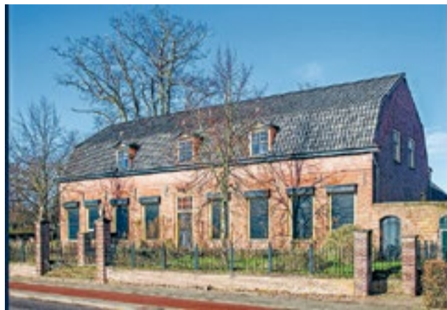
Uitsnede coverfoto Jaarboek Veldhoven-Dorp 2021.

VELDHOVEN – Cordaad Welzijn deelt vanaf dinsdag 21 december op 4 plaatsen gratis soep uit. Cordaad wil hiermee eenzaamheid tegengaan. De actie start dinsdag 21 december bij 't Tweespan. Een vrouwengroep maakt 's morgens een verse linzensoep zonder vlees. De pannen daarvoor zijn beschikbaar gesteld door Scouting St. Aloysius. De soep wordt tussen 12.00 en 14.00 uur gratis uitgedeeld. Woensdag 22 december maken jongeren in Odeon soep. Tussen 16.00 en 17.00 uur delen ze die uit in en rond de Burgemeester Van Hoofflaan. Donderdag 23 december zijn de cliënten van Voedselbank Veldhoven aan de beurt. Ook hier wordt tussen 13.00 en 15.00 uur soep uitgedeeld. Vrijdag 24 december sluit de soepactie bij Sentrum 70. Van 12.00 tot 14.00 uur.