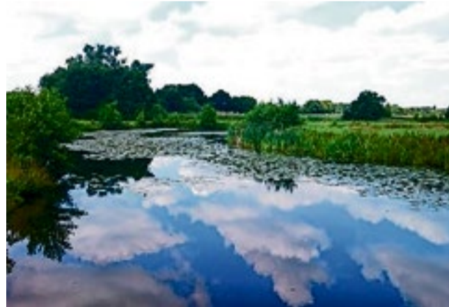
Waterschap de Dommel zet in op een toekomstbestendige waterhuishouding.