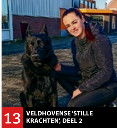
13 VELDHOVENSE 'STILLE KRACHTEN', DEEL 2