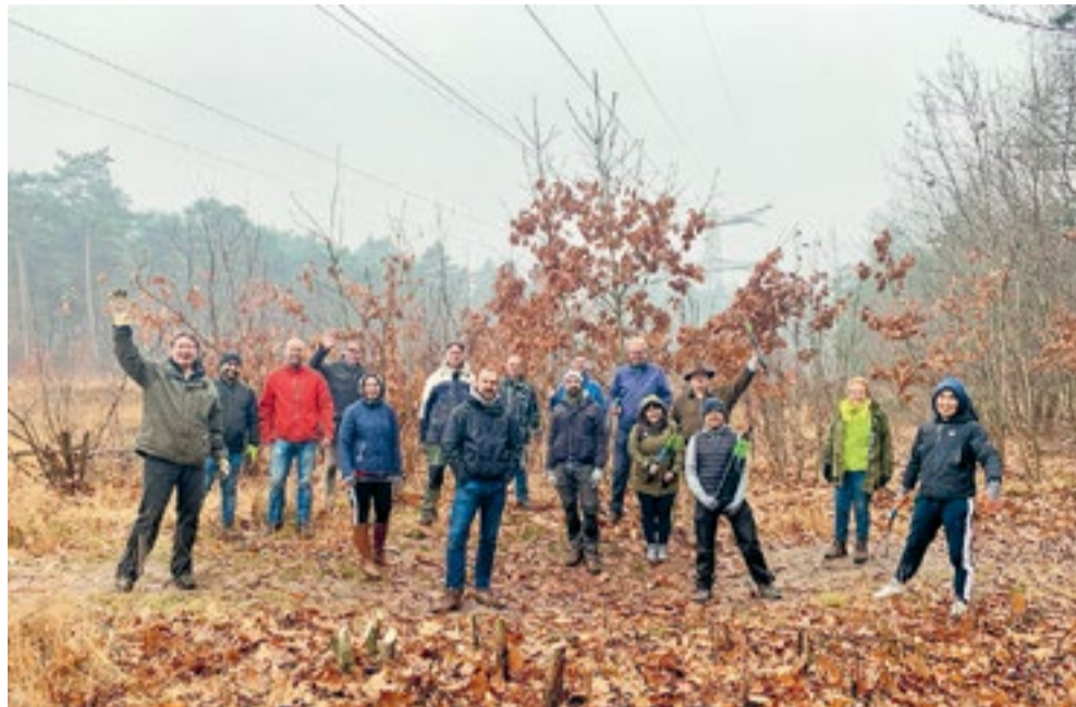
Groep ASML-werknemers die aan de gang gaan in natuurgebied de Sprankel. Op de voorgrond stronken van reeds afgezaagde Amerikaanse eiken.

In de namen 'Heersche Heide' en 'Heerscheheideweg' is nog iets terug te vinden van de vergane glorie van de heidevelden. Dwars door het gebied loopt nu een hoogspanningsleiding. Het is daar dat de heide weer een kans krijgt, omdat het bos over een brede strook gerooid moest worden. Om te voorkomen dat vonken van de stroomkabels overslaan,