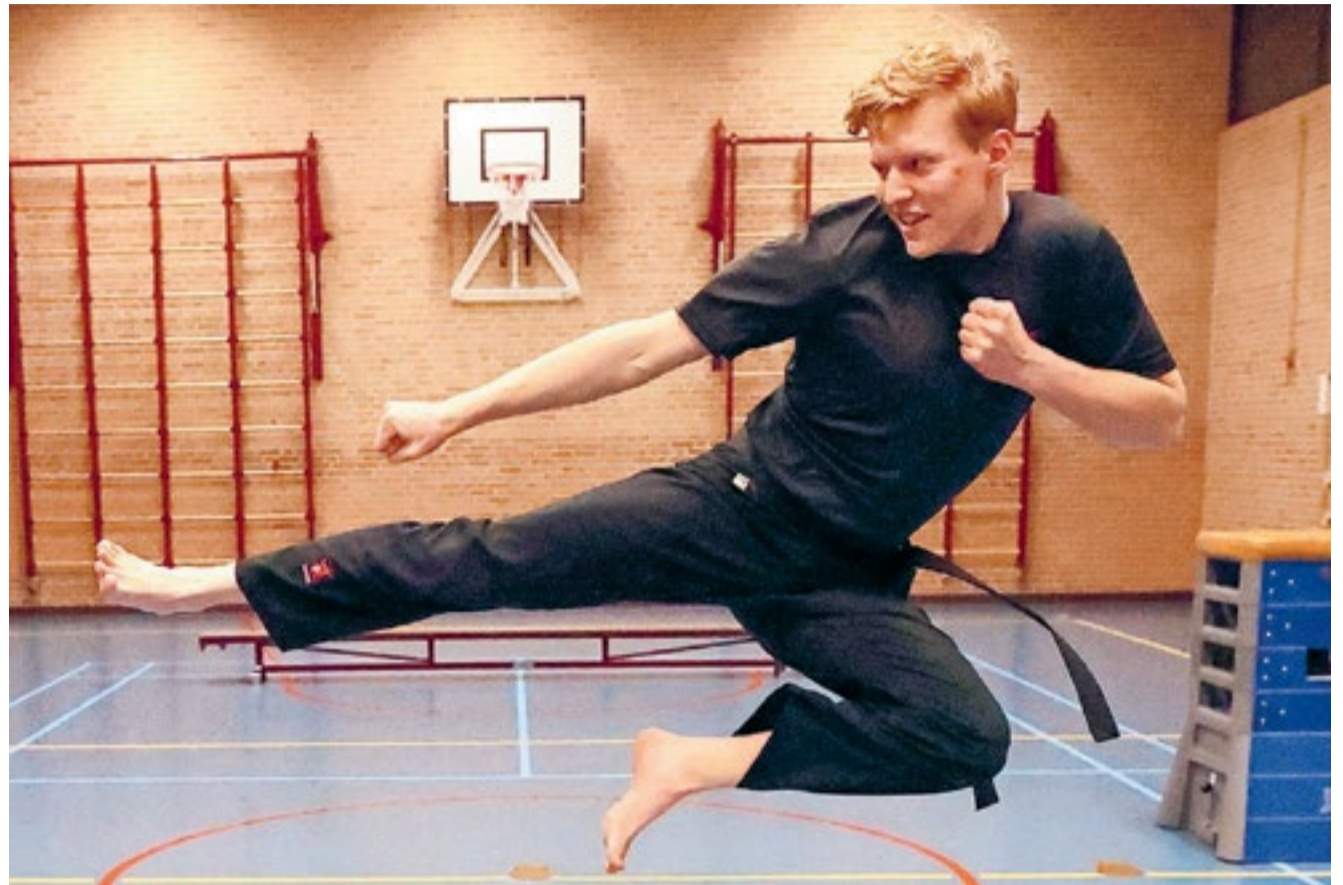
"Het is een traditionele en respectvolle vechtsport. Zelf heb ik 6 jaar les gehad en geef nu lessen als ervaringsdeskundige."

De Kung Fu-lessen zijn intensief, leerzaam en erg leuk, ze zorgen voor kracht, conditie, lenigheid en zelfvertrouwen. Onderlinge competitie staat niet voorop, je beoefent het voor jezelf. Van den Heuvel: "Je bent nooit klaar met leren in Kung Fu. Ook al train je ja-