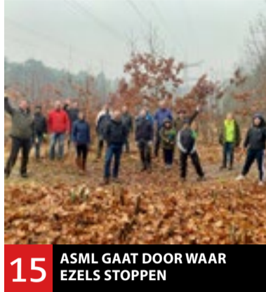
15 ASML GAAT DOOR WAAR EZELS STOPPEN