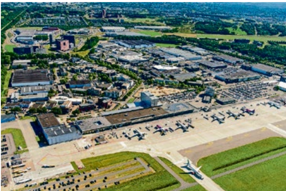
Luchtfoto Eindhoven Airport.

"Het is belangrijk om het gebied toekomstbestendig te maken. Eindhoven Airport Dis-