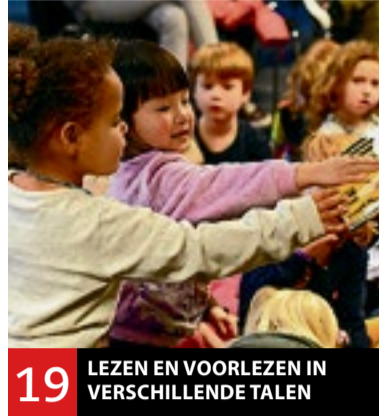
19 LEZEN EN VORLEZEN IN VERSCHILLENDE TALEN