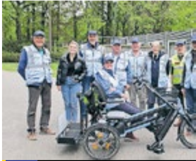
3 Cliënten Eckardal beleven topdag op duofiets

De huis-aan-huiskrant van Nuenen c.a. - Advertenties: advertiser@denuenensekrant.nl - Redactie: redactie@denuenensekrant.nl - www.denuenensekrant.nl