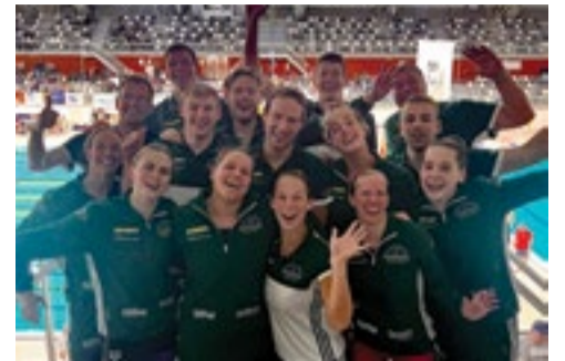
Het team van Z&PV Nuenen bij de ONMK 2024.