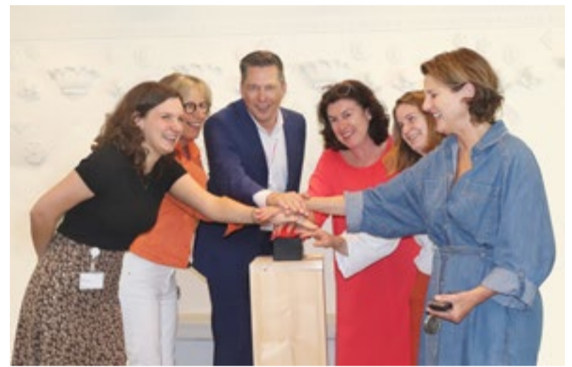
Door Elkerliek en BeterDichtbij werd samen het startsein gegeven voor de laatste polikliniek om aan te sluiten op BeterDichtbij.

BeterDichtbij is een app waarmee een patiënt een vraag rechtstreeks aan zijn of haar zorgverlener kan stellen. Het afgelopen jaar heeft het Elkerliek ziekenhuis deze app stapsgewijs per polikliniek in gebruik genomen als nieuw communicatiemiddel voor contact met patiënten. Vanaf 2 mei zijn alle poliklinieken van het Elkerliek via deze app voor patiënten bereikbaar.