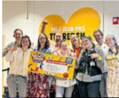
6 Jumbo-cheque 'Betere buurt' gaat naar de Buufkes