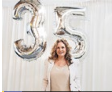
5 Cachet Models bestaat 35 jaar