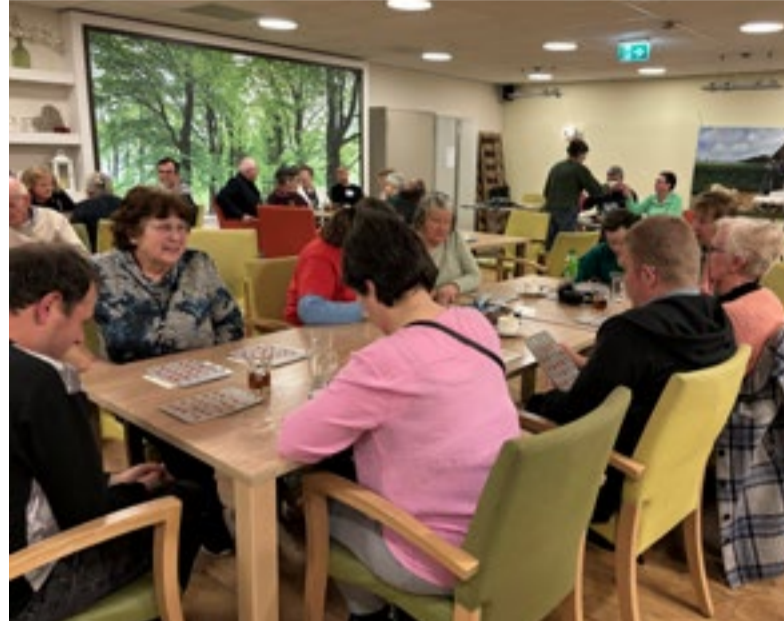
Prima opkomst in Buurthuis Gastvrij.