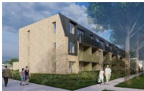
Impressie van de nieuwbouw.

Het plan voor de Wederikdreef is tot stand gekomen in samenwerking met gemeente Nuenen, Lunet, VFO Architects en Bouwbedrijf Peter Peters.