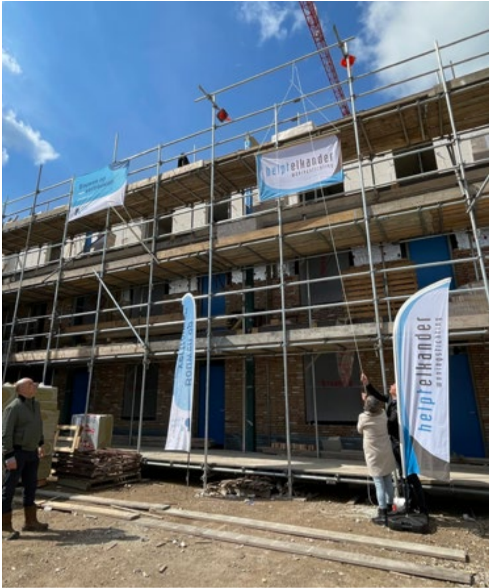
'Hijsen van de vlag'.

Bij de bouw van het wooncomplex aan de Wederikdreef in Nuenen is het hoogste punt bereikt; een mijlpaal voor Woningstichting Helpt Elkander.