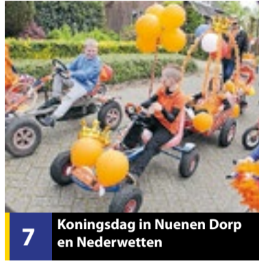
7 Koningsdag in Nuenen Dorp en Nederwetten