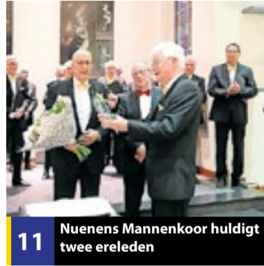
11 Nuenens Mannenkoor huldigt twee ereleden