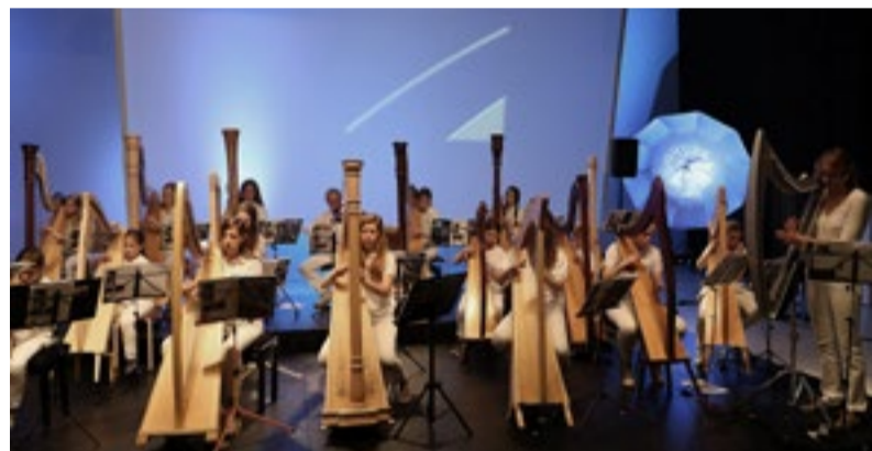
Blue Planet Harp Ensemble.

Woensdag 15 mei, 15.00-16.30 uur in bibliotheek Son en Breugel. Woensdag 22 mei, 15.00-16.30 uur in bibliotheek Nuenen. Deelname gratis, na aanmelding via www.bibliotheekdommeldal.nl/activiteiten .