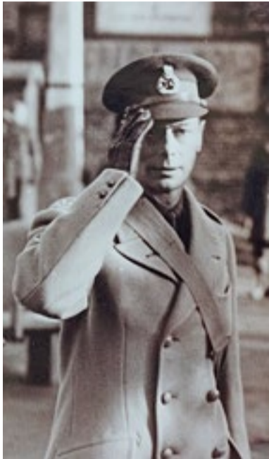
Koning George VI van het Verenigd Koninkrijk bezoekt in 1944 zijn troepen in Nuenen. Datum en locatie tot nu toe onbekend.

Het is in september 80 jaar geleden dat Nuenen, Gerwen en Nederwetten zijn bevrijd van de Duitse overheersing. Heemkundekring De Driehornick organiseert, onder auspiciën van de Stichting Herdenkingen Nuenen, een 'bevrijdingsroute' op zaterdag 21 en zondag 22 september.