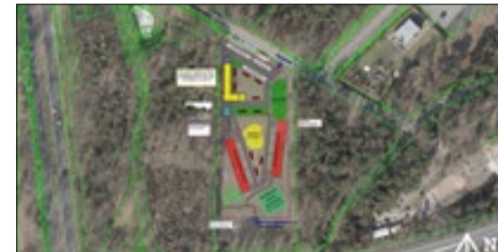
Situatieschets azc Pastoorsmast.

zoals in Budel en Ter Apel – waarmee de vrees voor overlastgevend veiligelanders dus bij voorbaat ongegrond is. Er komen veiligheidsvoorzieningen, bestrate looproutes en nieuwe straatverlichting. Wel moet de gemeenteraad nog instemmen met het plan. Als zij dat niet doet, zal waarschijnlijk de overheid de gemeente Nuenen overrulen, waarmee Nuenen meteen de regie kwijt is over locatie, aantal en/of duur van de opvang. Aan de raad dus de keuze.