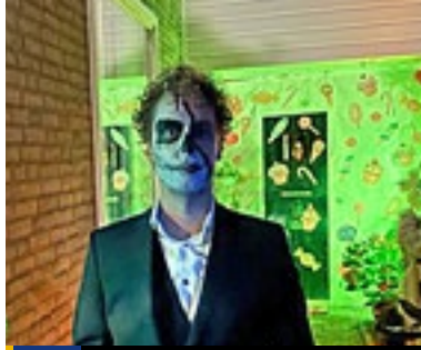
3/7 Halloween in de Molvense Erven en bij de Buufkes

Al vanaf het begin van het aantreden van het hui je positieve daadkracht. Je voelt de vibe: wij 9 Niks meer op de lange termijn schuiven. Nee, nu dan ook de titel van het stuk waarin de begroting staat. Heel sterk dat een paginagrote adverte werd geplaatst. Iedere inwoner en andere bela den daar in één oogopslag bekijken wat de inko gaan zijn in 2024 en meteen zien dat er een posi