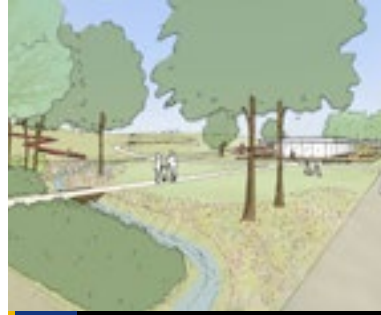
5 Gulbergen als regionaal stadspark van de Brainportregio