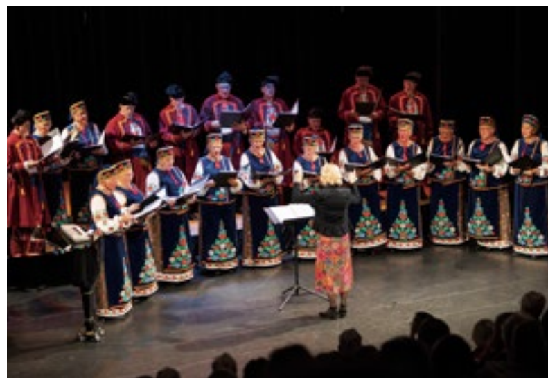
Helmonds Slavisch Koor.