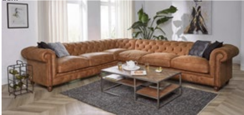
Chesterfields te kust en te keur bij Delta Chesterfield aan de Leenderweg in Eindhoven.

Delta Chesterfield is een mooi familiebedrijf dat zich sinds 1997 specialiseert in de origineel Engelse Chesterfield banken. De Chesterfield collectie is uitgebreid met Chesterfield hoekbanken, stoelen en zelfs relaxfauteuils, die te bezichtigen zijn in de vier vestigingen.