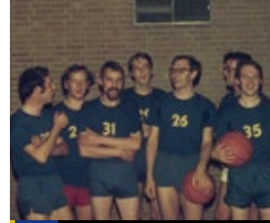
9 Basketbalvereniging Achilles '71, meer dan vijftig jaar actief