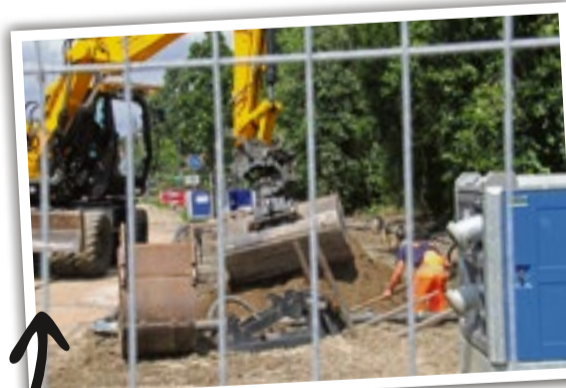
5 juli jl.