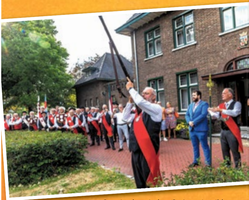
Opening kermis door St. Antoniusgilde.

Voor meer foto's, zie onze Facebookpagina.