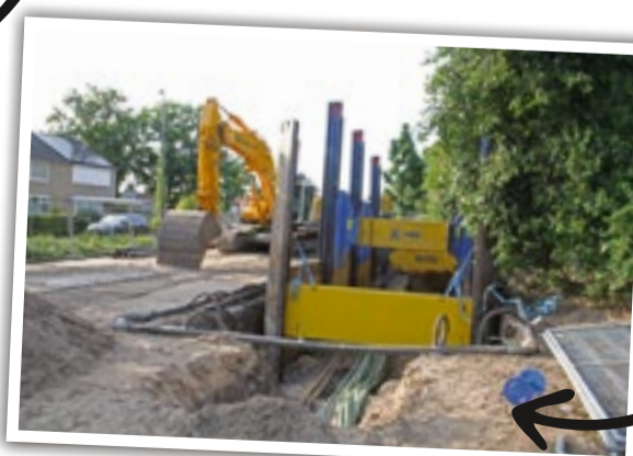
10 juli jl.