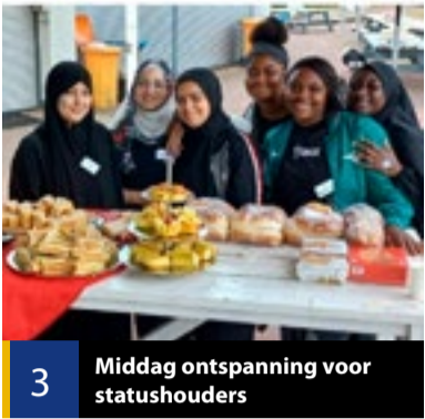
3 Middag ontspanning voor statushouders

De huis-aan-huiskrant van Nuenen c.a. - Advertenties: adverteren@denuenensekrant.nl - Redactie: redactie@denuenensekrant.nl - www.denuenensekrant.nl