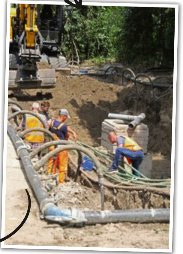
6 juli jl.