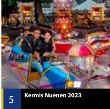
5 Kermis Nuenen 2023