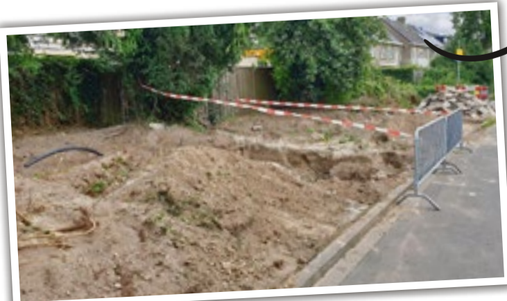
3 juli jl.