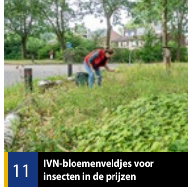
11 IVN-bloemenveldjes voor insecten in de prijzen