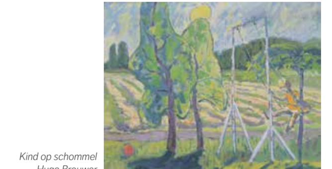
Kind op schommel - Hugo Brouwer