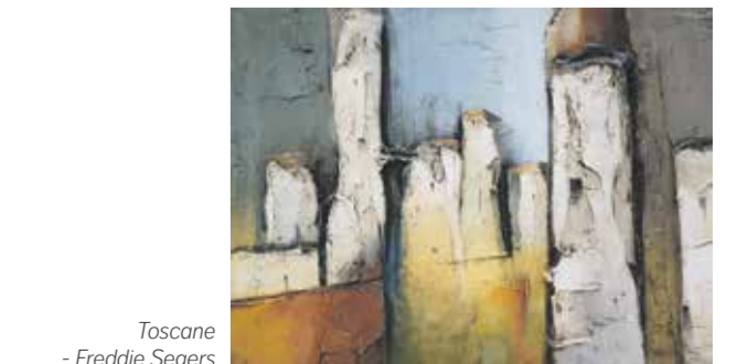
Toscane - Freddie Segers