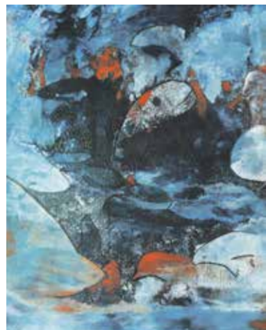
De horizon voorbij II van Marianne Schellekens. Een onderdeel uit de serie van 5 werken.

Op zondag 25 augustus om 15.00 uur is de vernissage van de nieuwe expositie 'Na Zomer' van KuBra-Art in Galerie De Ruimte aan de Molenstraat 2 in Geldrop. 'Na Zomer' is een indrukwekkende tentoonstelling met vier Brabantse kunstenaars, waarbij de diversiteit een eenheid vormt.