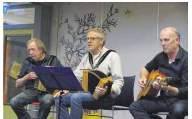
De Heren van het Atelier met folk-liederen.