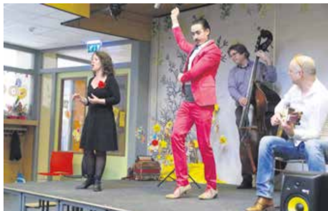
De groep Duende verraste met Spaanstalige liederen en dans.