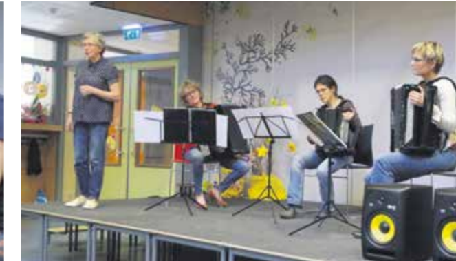
Losse Tongen: muzikale vertellingen op muziek van onder andere Piazzolla.