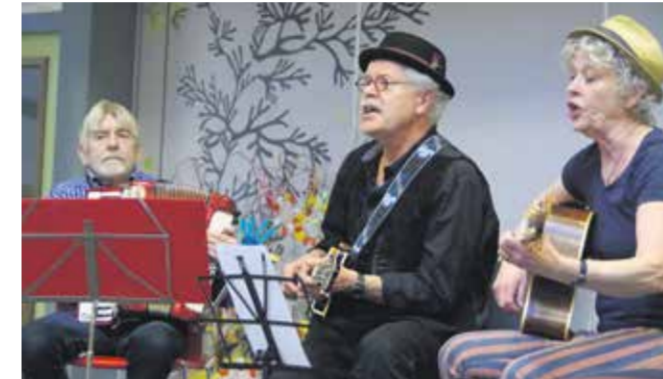
Gravelroad met Americana: folk en blues.