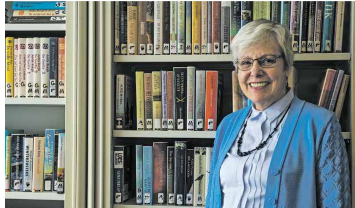
Een lener van het uitleenpunt in Gasterij Jo van Dijkhof.

meegebracht over schrijvers. Ze is erg tevreden over het uitleenpunt van de bibliotheek. Ze schuift aan voor een kop koffie, besteld bij het restaurant van de Gasterij. 'Ik val steeds meer buiten de maatschappij', zegt ze. 'Ik ben te oud en pas hier niet meer. Mijn gehoor is niet goed meer. Gelukkig ben ik niet eenzaam.' Ze vraagt om de boeken uit de krantenknipsels. De vrijwilligster maakt een praatje met haar. 'Kan ik misschien iets voor u doen?' 'Dat ik af en toe hier koffie kan drinken. Verder niets. Ik wil het zelf oplossen.'