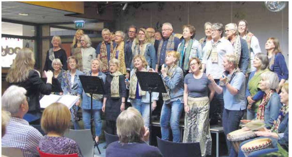
Wereldkoor Keskedee met een spetterend openingsoptreden in BS De Dassenburcht.