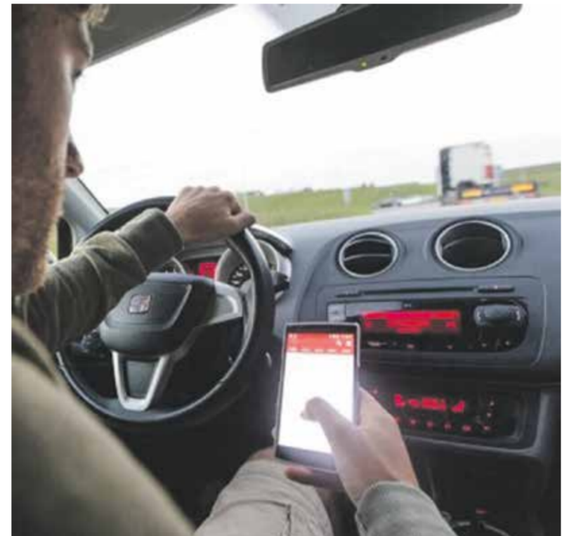
Het gaat meestal goed, even op je mobieltje kijken of zoeken naar die andere radiozender of dat goede nummer.

verkeer veiliger te maken, is je realiseren dat de gevaren groter zijn dan je denkt. Het probleem van veel onveilig gedrag is dat het zo vaak goed gaat! Daardoor denken we dat het wel kan en daarom blijven we het doen.