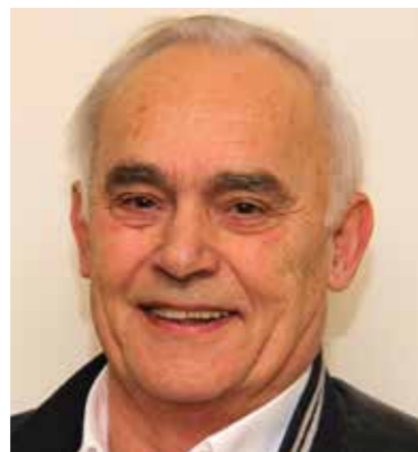
Lieve schat, zoon, (schoon-)papa en opa; 70 jaar jong! Gefeliciteerd van ons allemaal.