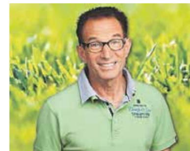
GroenRijk Geldrop, Zwembadweg 6. GroenRijk Veldhoven, Polderstraat 17.

Rob Verlinden is presentator van het bekende TV-programma 'Robs Grote Tuinverbouwing' bij SBS 6. Ivo is in actie te zien tijdens zijn tour langs de diverse GroenRijk tuincentra. Met zijn enorme enthousiasme, creativiteit en vakmanschap geeft hij tijdens zijn twee uur durende Groenshow talloze tips en adviezen op het gebied van tuin- en kamerplanten. Het bijwonen van Robs Groenshow is geheel gratis.