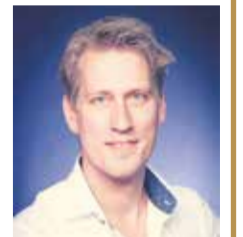
Dr. RPM Ceulen Dermatoloog

ALTIJD* VERGOED NA VERWIJZING DOOR UW HUISARTS *geldt niet voor medisch niet noodzakelijke behandelingen