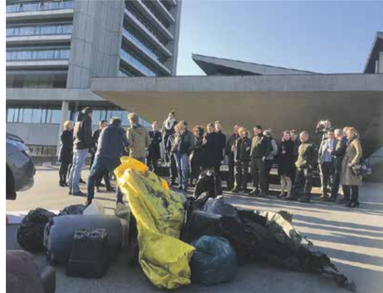
Bij het provinciehuis in Den Bosch.

Boswachters van Brabants Landschap, Natuurmonumenten en Staatsbosbeheer togen vorige week met enkele aanhangers vol met afval, gevonden in de natuur, naar het provinciehuis in Den Bosch. Met deze actie vragen ze aandacht voor problemen in het buitengebied, zoals afvaldumpingen, maar ook andere illegale activiteiten die de veiligheid in het buitengebied bedreigen en de natuur (beleving) verpesten. Denk hierbij aan brandstichting, stroperij, wietplantages en wildcross. Boswachters besteden noodgedwongen steeds meer tijd aan toezicht en handhaving en missen een toereikende inzet en ondersteunende capaciteit van de politie.