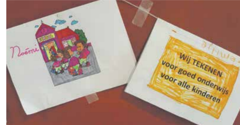
Verslag en foto: Gemma Eerdmans

Ook in Nuenen wordt vrijdag gestaakt in het basisonderwijs. Leerkrachten van OBS de Rietpluim hebben het voortouw genomen en aan de Nuenense scholen voorgesteld om met z'n allen naar het Stadhuisplein in Eindhoven te fietsen, alwaar een manifestatie wordt gehouden. Er wordt verzameld bij de kiosk in het park om 08.45 uur. Niet iedereen gaat daar naartoe. Sommigen hebben een andere invulling voor die dag gepland, zoals inhalen van werk dat is blijven liggen.