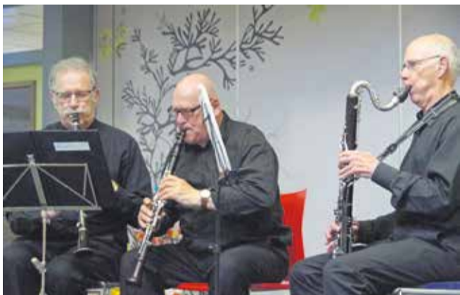
Klarinettrio El Viento ging klassiek.