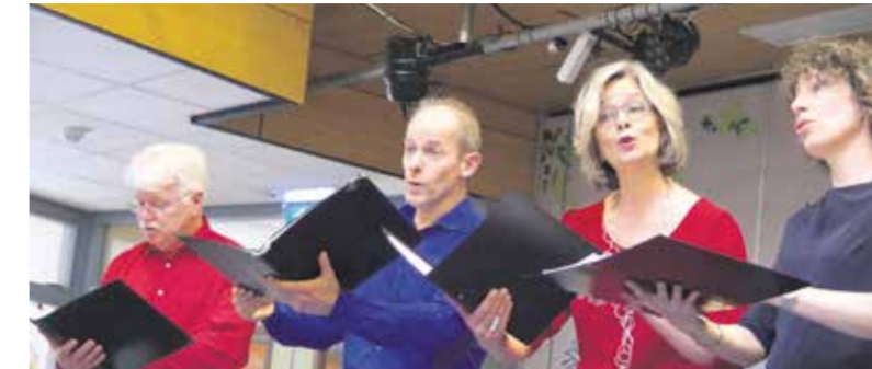
Petit Fours met humoristische liedjes.