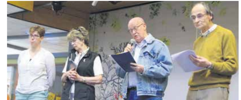
Leden van het Dichterscollectief Nuenen; muzikale intermezzi van Paul Weijmans.