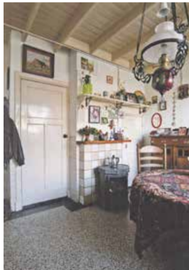
Het boereninterieur van toen, nu door Marie Louise Nijnsing vastgelegd.

'Nu in Toen: historische boereninterieurs in Nuenen c.a.' heet de foto-expositie die te zien is in het Heemhuis van heemkundekring De Drijehornick. Deze foto reportage van fotografe Marie Louise Nijnsing geeft een beeld van het historisch boereninterieur zoals daar vandaag de dag nog in geleeft wordt. Boereninterieurs met een hoog gehalte van 'toen', maar nog steeds volop in gebruik door de bewoners.