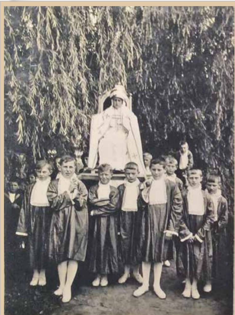
Pausgroep uit de Kindshuis optocht in Nuenen.