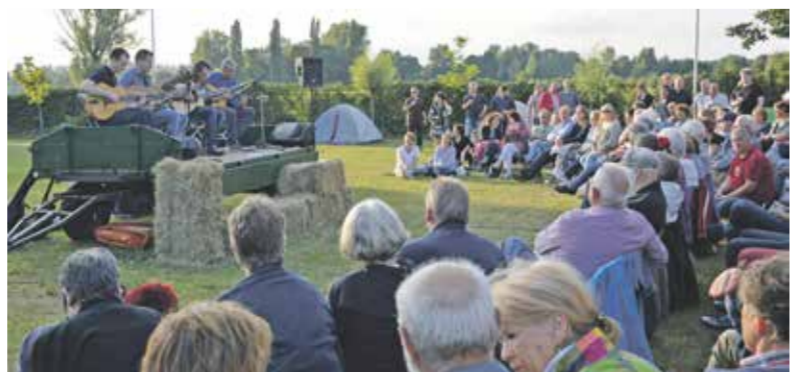
Optredens in de openlucht bij 't Huysven in Gerwen.

Poort open: 19.30 uur, aanvang 20.00 uur, parkeren kan op het Kerkplein in de dorpskern Gerwen. Met de fiets en te voet is 't Huysven ook goed bereikbaar. Locatie: 't Huysven, Huikert 35, 5674 RG Gerwen.