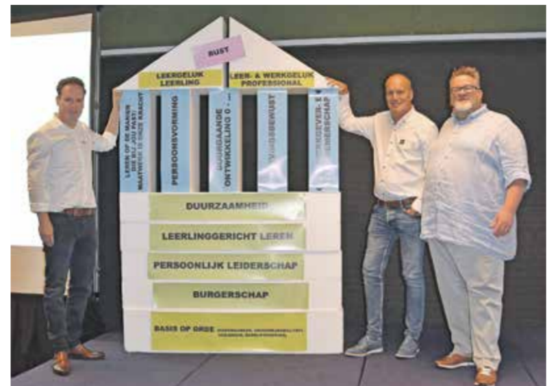
Huis als metafoor voor het Koersplan: ter leergeluk en werkgeluk.

Een keer in de twee jaar organiseert Eenbes voor al haar medewerkers een dag vol ontmoeting, verbinding en inspiratie. In HUP in Mierlo troffen zo'n 600 onderwijsprofessionals elkaar 's morgens voor kennisoverdracht, 's middags voor sportieve activiteiten.