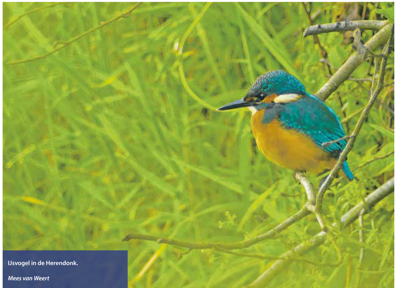
IJsvogel in de Herendonk.

vrijdag 21 juni Informatiebijeenkomst (aankomend) vrijwilligers ANWB AutoMaatje Nuenen Het Kwetternest, 10.00 tot 12.00 uur