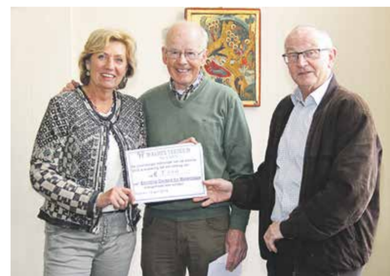
Overhandiging cheque aan Stichting 'Doctors for Mozambique'.

Heeft u ook een leuke/bijzondere foto? Stuur deze met uw tekst naar redactie@denuenensekrant.nl