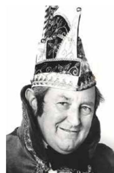
hij voor CV De Wetters heeft gedaan.