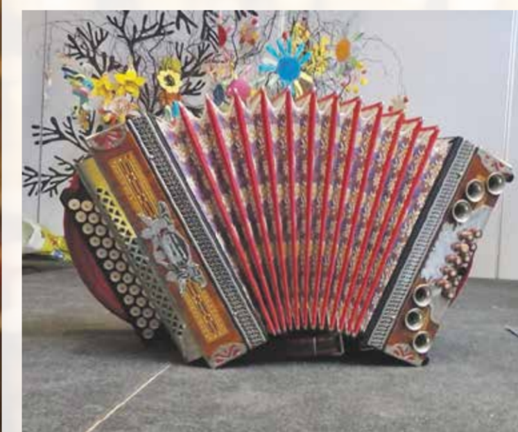
Steirische Harmonica.