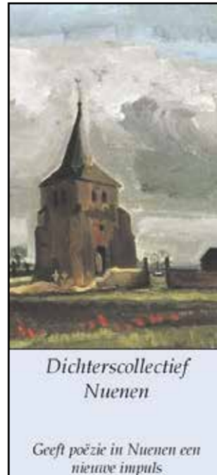
Dichterscollectief Nuenen Geeft poëzie in Nuenen een nieuwe impuls

regen die niet tot huid lijkt door te dringen vormt parels in zijn vacht het huisdier niet bewust de drager van juwelenspruit laat de betovering verdampen bij het lui vertoeven