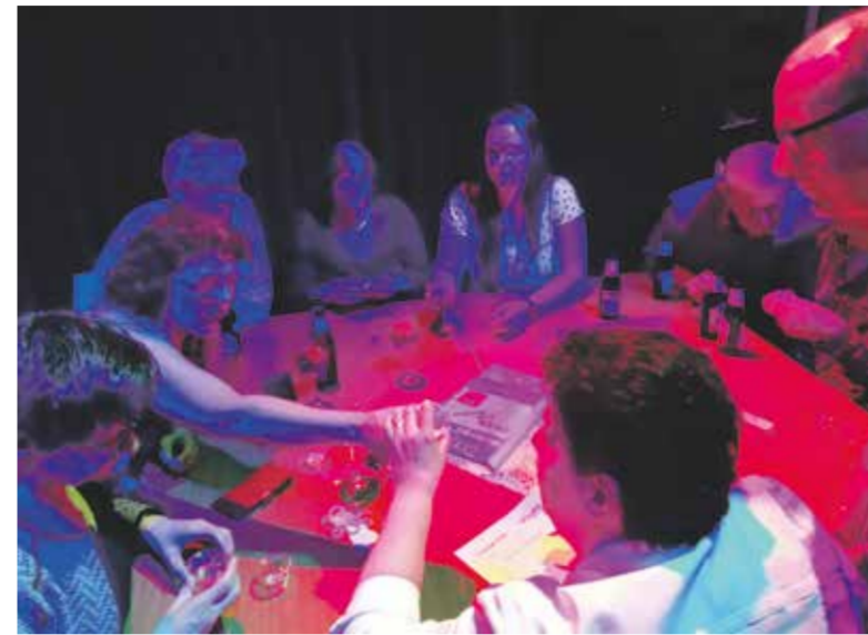
De 'Hoeksteentjes' proeven en ruiken tijdens de laatste opdracht.

Na het uitvoeren van alle opdrachten en het maken van de vragen op vrijdag 6 april jl., zaten de teams daarna een week lang in spanning. Wie zou er winnaar worden van de Wèttegij't Quiz 2018? Team 2 'Heuhj' ging er uiteindelijk met de eerste prijs vandoor!