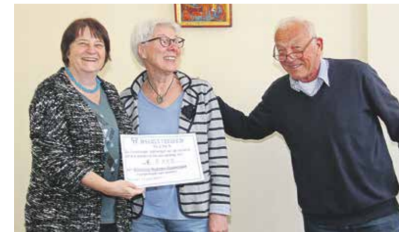
Overhandiging cheque aan Stichting 'Nuenen Guatemala'.