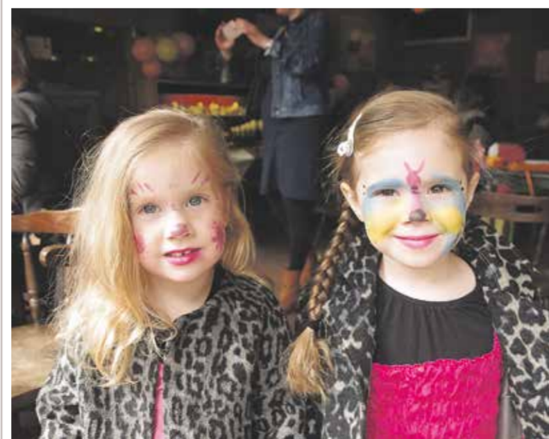
Prinsjes &amp; Prinsjesdag op Weverkeshof 2017.

Afhankelijk van de belangstelling, gaan vervolgens de prinsjes & prinsesjes feestelijk paraderen over het terrein van Weverkeshof, langs de dieren en langs het aanwezige publiek. En natuurlijk hebben de prinsjes & prinsesjes voorrang in onze prachtige speeltuin. Graag tot dan!