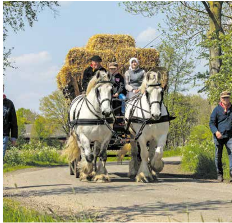
Foto uit de historische optocht 2022.

Het museum is geopend van dinsdag tot en met zondag, van 13 tot 17 uur. Op maandag is het museum