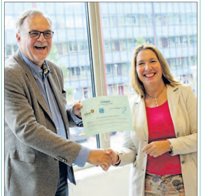
De wethouder overhandigde een cheque ter waarde van 30000 euro ter ondersteuning.