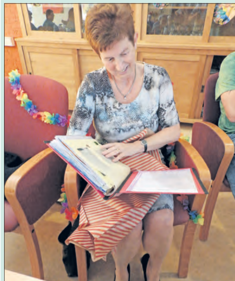
Joke bekijkt het prachtige afscheidboek boordevol herinneringen.