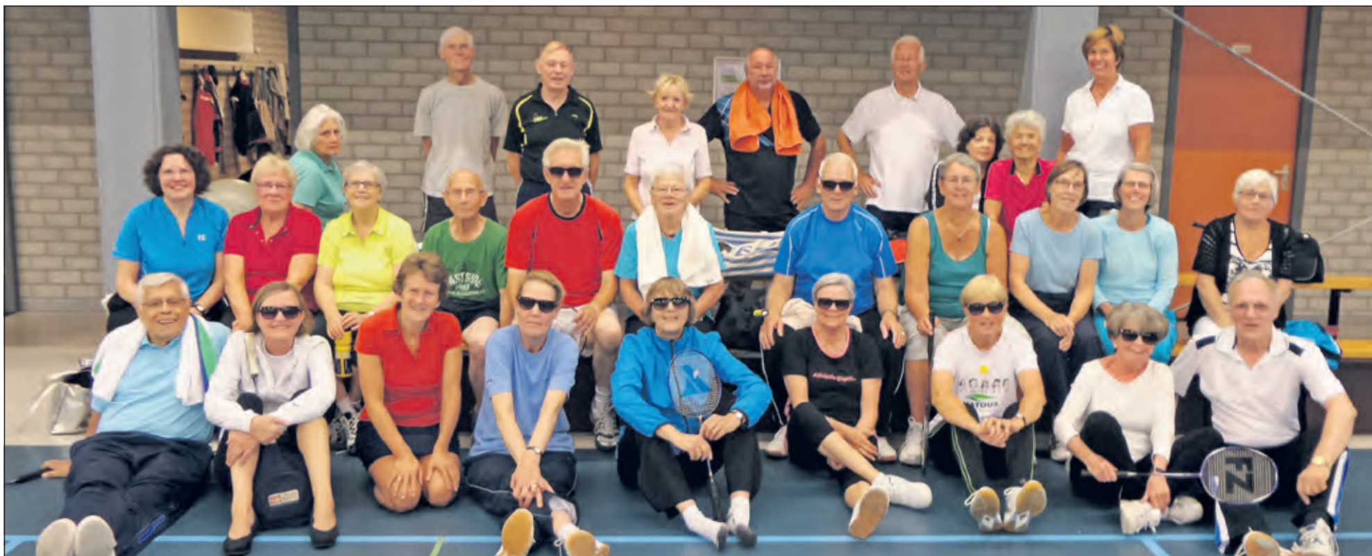
Zonnige training bij SV Irene badminton.