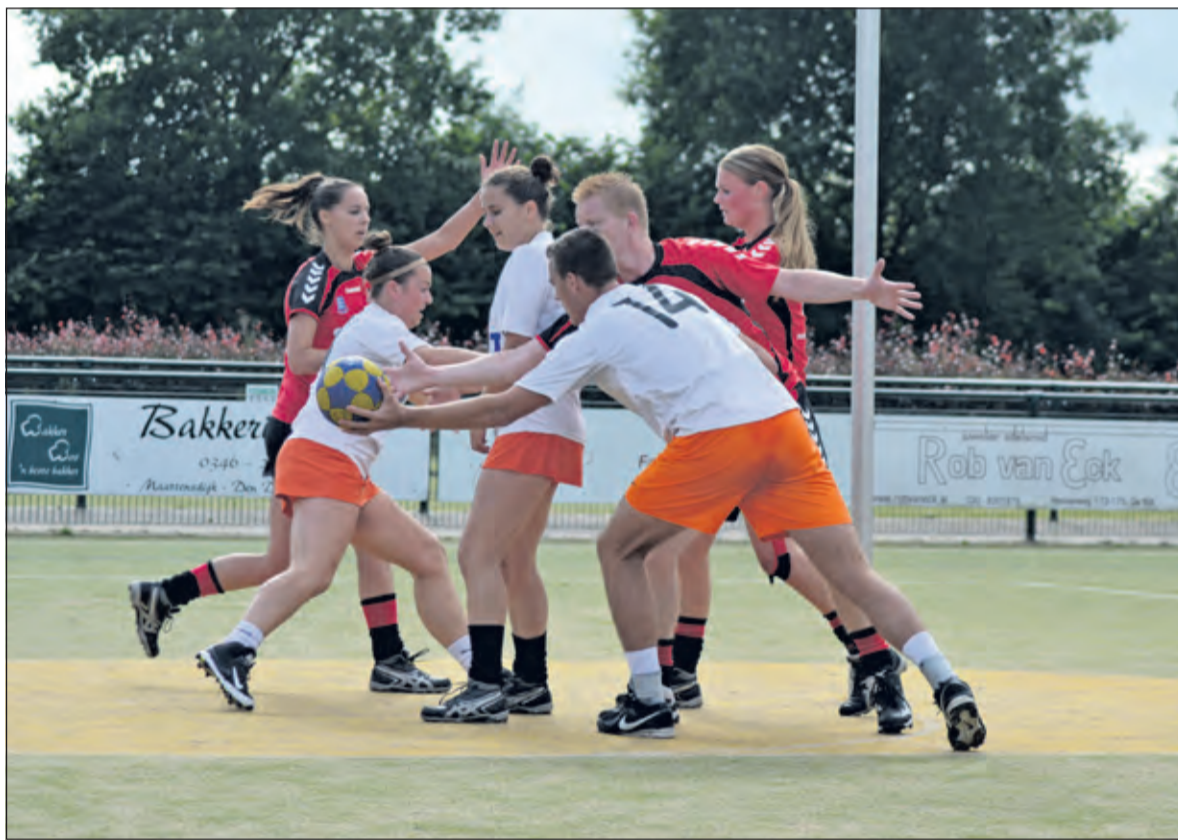
Spelmoment uit TZ – KVS.

Het is duidelijk dat de vorm van het vorige seizoen er nog niet is. Dat is jammer, want in dat geval hadden er de eerste twee wedstrijden zeker al punten in gezeten. Dit zal snel anders moeten, omdat alle andere ploegen al punten hebben gehaald. Volgende week wacht de uitwedstrijd tegen Avanti.