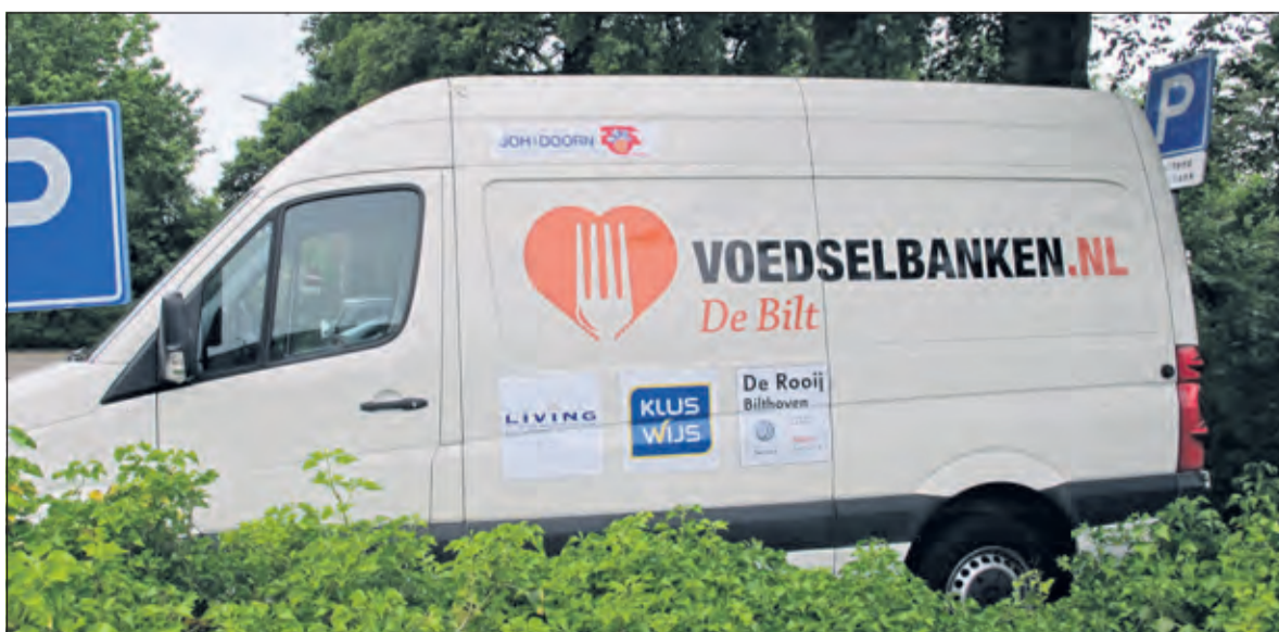
Er zijn al diverse bedrijven die het werk van de Voedselbank met een vaste financiële bijdrage per jaar steunen.

Bedrijven die de Voedselbank een warm hart toedragen en ook geïnteresseerd zijn in vermelding op de bus, kunnen contact opnemen via sponsor@voedselbankdebilt.nl .