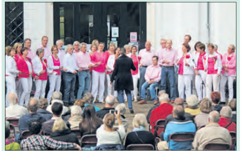
De 49 leden van Valsch & Gemeen zingen verrassend veelstemmig.