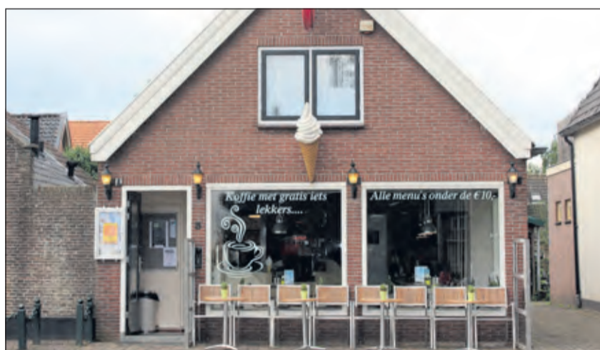
Cafeteria de Gram wordt per 1 oktober 'Cafeteria Coen'.