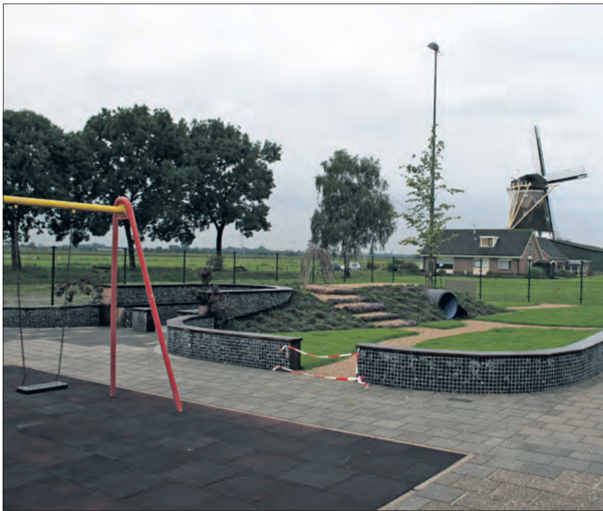
Het nieuwe schoolplein van 't Kompas ligt er strak bij.

Het schoolbestuur wil dan ook iedereen uitnodigen om op donderdag 17 september om 15.15 uur bij de opening aanwezig te zijn en aansluitend ons nieuwe schoolplein te bekijken'.