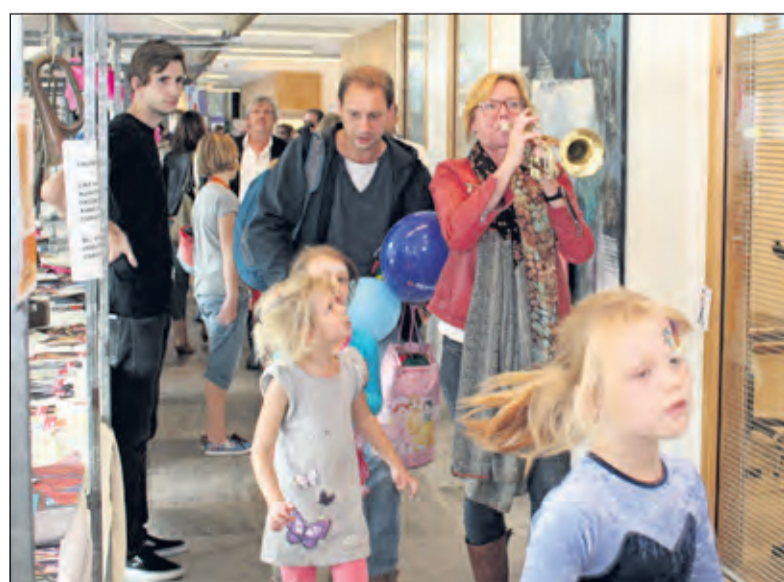
Voor de eigenlijke onthulling werd het publiek 'opgetrommeld'.

kunnen burens vaak nog een normaal gesprek met elkaar voeren'. Sinds 2009 is Buurtbemiddeling De Bilt actief binnen deze gemeente. Buurtbemiddeling De Bilt bestaat uit een groep geschoolde vrijwilligers, met compassie voor mensen en een goed luisterend oor, die bemiddelingsgesprekken aangaan. De vrijwilligers dragen geen directe oplossingen aan maar proberen de onderlinge communicatie te herstellen. Alle inwoners van de gemeente De Bilt kunnen gratis gebruik maken van Buurtbemiddeling De Bilt.