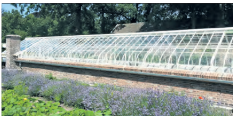
Eén van de gerestaureerde kassen.

Er is live muziek van 'Pierre et les Optimistes'.