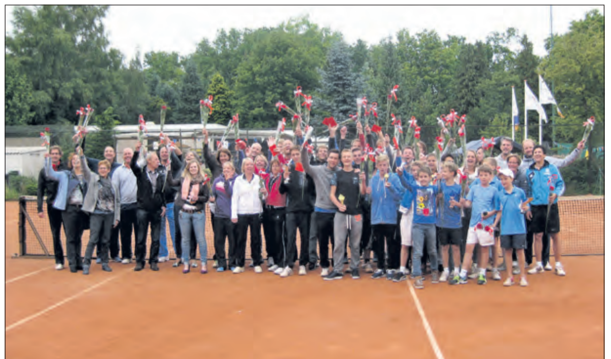
Veel winnaars bij Meijenhagen.