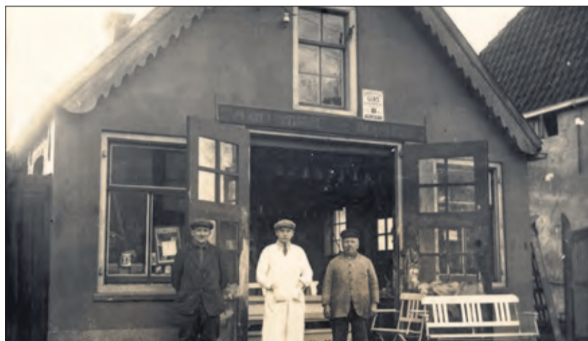
Kerkdijk 3 in Westbroek voordat er een cafeteria was gevestigd.