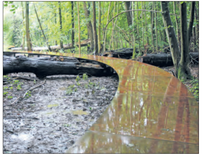
Zo'n 100 meter cortenstaal door het bos.

'Ik vertoef graag op Oostbroek; bij Oostbroek denk ik aan het ontstaan van onze gemeente, het is immers de bakermat van de gemeente De Bilt. Bij Oostbroek denk ik aan het klooster van St. Laurentius, de patroon van De Bilt. Mijn ouders hebben mij bij mijn geboorte die naam gegeven, waar ik best trots op ben