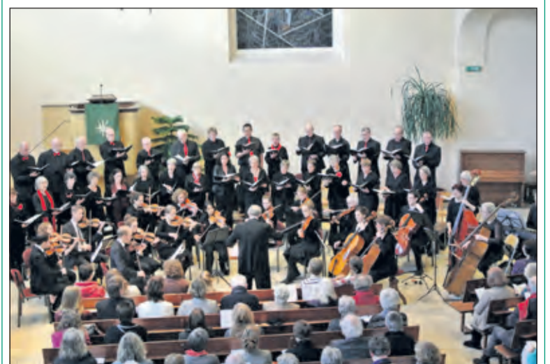
Het Schütz Projectkoor en het Carezza Ensemble in 2015, bij de uitvoering van Arvo Pärt's Te Deum.

Het Schütz Projectkoor is een ambitieus kamerkoor uit Bilthoven met een vaste kern van ongeveer 20 geoefende zangers dat jaarlijks aangevuld wordt met projectzangers. De zangers bereiden zich thuis voor en tijdens de repetities worden de koorklank en muzikale presentatie opgebouwd. De 'inzeepdag' is op 10 oktober. de uitvoeringen zijn op 31 januari 2016 en op 7 februari in de Opstandingskerk, Bilthoven. Voor dit project is er nog dringend behoefte aan een ervaren bas. Geïnteresseerden kunnen zich wenden tot info@schutzprojectkoor.nl . Voor nadere informatie zie www.schutzprojectkoor.nl