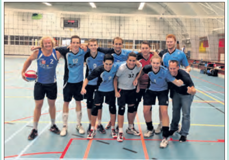
Heren 1 van Irene.

Aanstaande zaterdag, 12 september speelt Irene H1 in de Kees Boekhal in Bilthoven een driekamp in de eerste ronde van de nationale beker. Om 13.00 uur treedt Irene aan voor de eerste wedstrijd. De winnaar van de driekamp gaat naar de volgende ronde. (Jack van Asperdt)