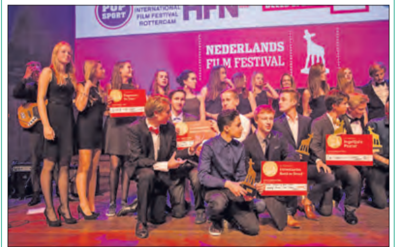
Het Nieuwe Lyceum ging dit jaar naar huis met maar liefst 4 gouden kalveren voor filmposter, montage, camerawerk en beste filmidee.

Maandag 28 september was het Junior Gouden Kalveren Gala 2015 in Tivoli Utrecht. Leerlingen uit Havo 4 en VWO 4 van Het Nieuwe Lyceum hebben in een workshop van drie uur een film van 1-minuut gemaakt. Tijdens het spetterend gala streden de beste films uit de workshops om de absolute hoofdprijs: het Junior Kalf. (Lucienne van de Sluis)