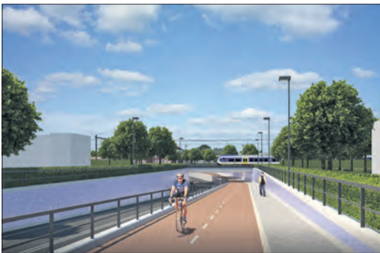
Zo komt de Leijenseweg er na de ondertunneling uit te zien.

'Het plan is overigens niet in beton gegoten,' benadrukt Corsel. 'We monitoren voortdurend hoe het gaat en na een week of zes gaan we weer met de werkgroep om tafel. Als het nodig of wenselijk is, nemen we dan eventuele aanvullende maatregelen, aldus Corsel die zich goed kan voorstellen dat de wijkbewoners opzien tegen de werkzaamheden en de afsluiting van de Leijenseweg. 'Maar we moeten vooral voor ogen blijven houden waarom de gemeente en ProRail deze onderdoorgang realiseren. Straks is het hier een stuk veiliger en hoeven de mensen niet meer zo vaak en lang voor de slagbomen te wachten.'