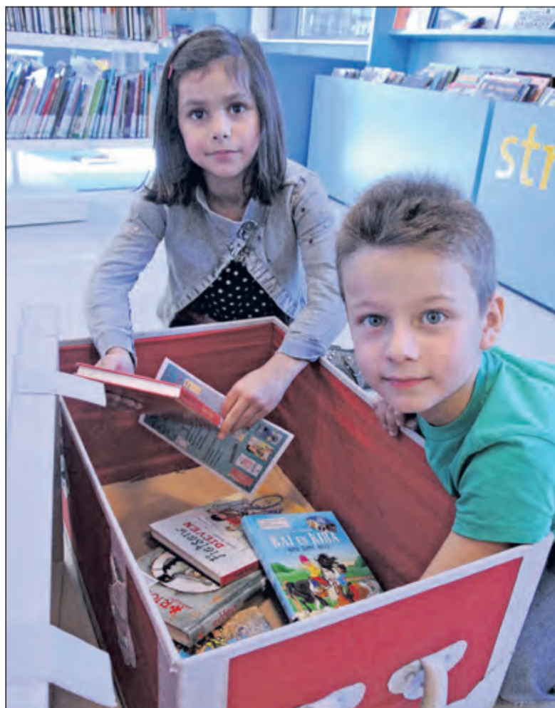
Grabbelen in een boekenkist.