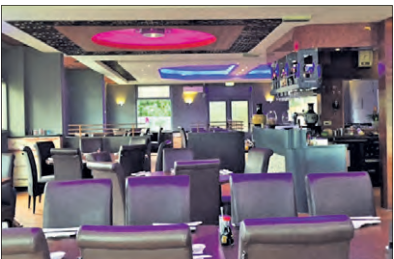
Oosterse en Italiaanse keuken in een vernieuwde ambiance.