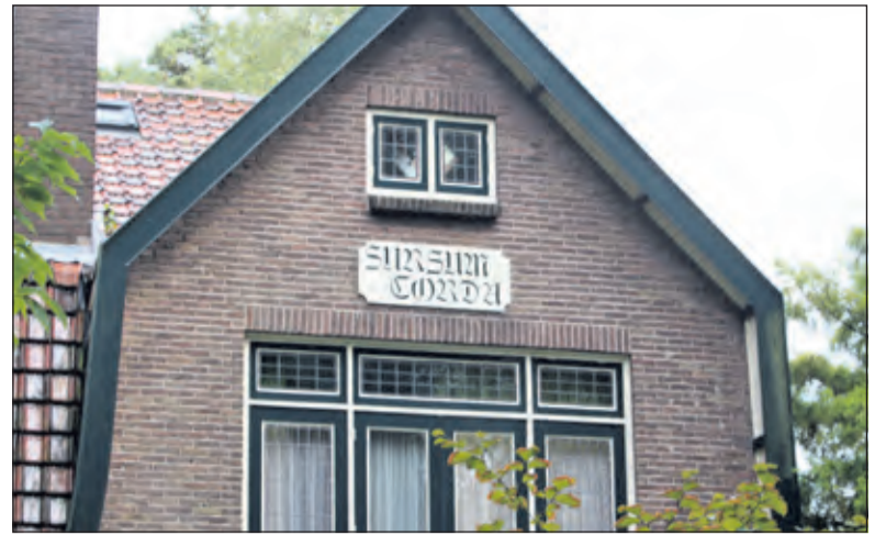
Er zijn drie betekenissen voor Sursum Corda: 'De harten omhoog', 'Haal jullie harten op' en 'Verheft uw hart'.