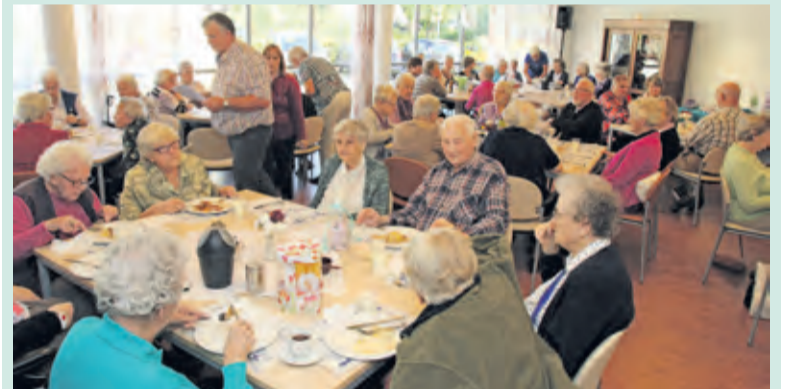
In het Rode Kruis gebouw wordt van de pannenkoeken gesmuld.

Het Rode Kruis afdeling De Bilt verzorgde woensdag 30 september een gezellige dag vanaf 10.30 uur voor gasten van Maartensdijk en De Bilt. Er stond die ochtend een pannenkoekenkraam voor het Rode Kruis gebouw aan de St. Laurensweg, waarin de lekkerste pannenkoeken werden gebakken. Daarnaast draaide die dag het Rad van Fortuin volop en was er een enveloppespel met heel mooie prijzen gesponsord door de plaatselijke middenstand.