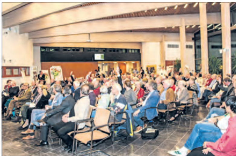
Ruime belangstelling voor de ontwikkelingen van het Vinkenplein.

Het streven is dat Synchroon na de zomer in 2016 start met de bouw van het Vinkenplein project. De oplevering moet naar verwachting eind 2017 plaatsvinden. Op de website www.bilthovenbouw.nl vindt men uitgebreide informatie over het totaalplan om het centrum van Bilthoven verder te verbeteren. Voor specifieke informatie over het Vinkenplein heeft Synchroon een aparte website ontwikkeld: www.vinkenpleinbilthoven.nl .