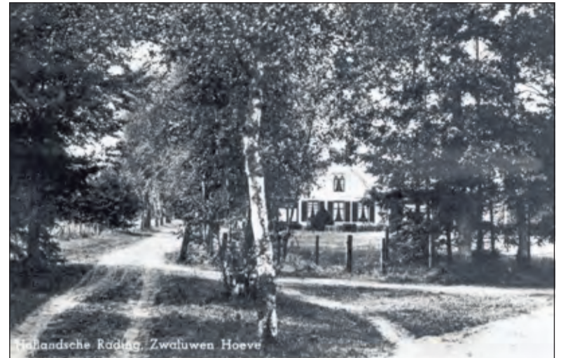
De Zwaluwenhoeve in 1949.