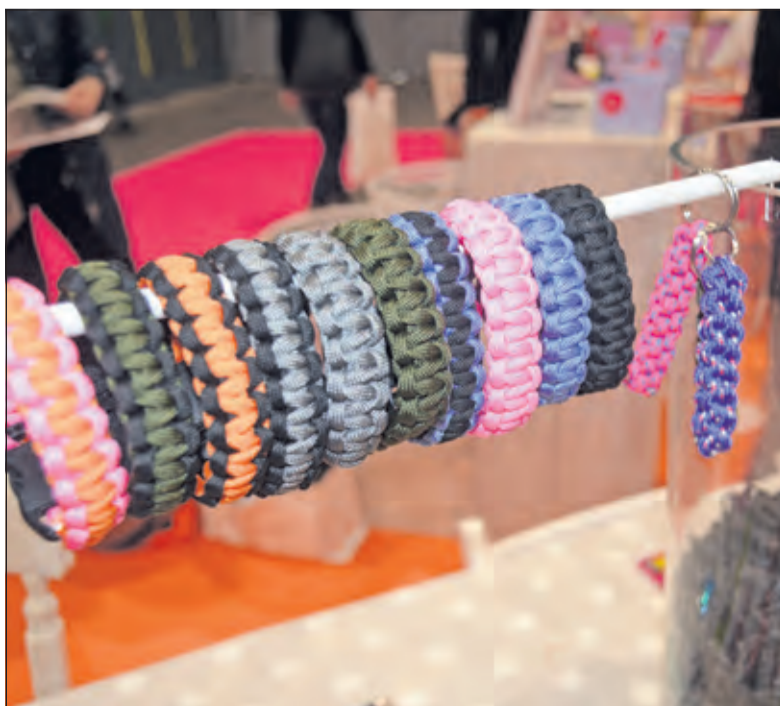
De nieuwste creatieve trends vind je op KreaDoe.

Voor de Vierklanklezers zijn er 10 gratis kaarten beschikbaar. Stuur een mail naar info@vierklank.nl en je ontvangt een digitale code voor een e-ticket. op = op