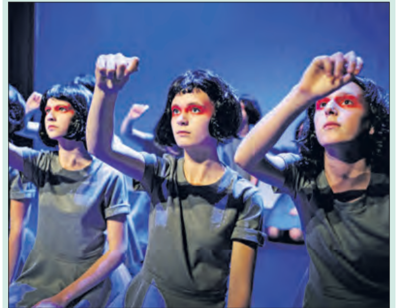
Theaterschool Masquerade speelt 'wij zijn Antigone'.

In deze voorstelling vertellen 13 jonge vrouwen het verhaal van Antigone. Haar broer heeft zich schuldig gemaakt aan landverraad en ligt dood buiten de poorten van de stad. Haar oom, de koning, verbiedt de inwoners hem te begraven op straffe van de dood. Antigone is ervan overtuigd dat haar broer ondanks zijn misstap zielenrust verdient. Midden in de nacht begraaft ze hem, maar wordt betrapt. Haar oom en haar verloofde proberen haar leven te sparen, maar Antigone heeft geen oor voor hun smeekbeden en eist gelijk behandeld te worden. Ze sterft. De spelers verbinden het verhaal met hun eigen wereld. Wat kunnen we van Antigone leren? Zou jij alles opgeven voor je idealen? En wat zijn deze idealen dan? (Corinne Weeda)