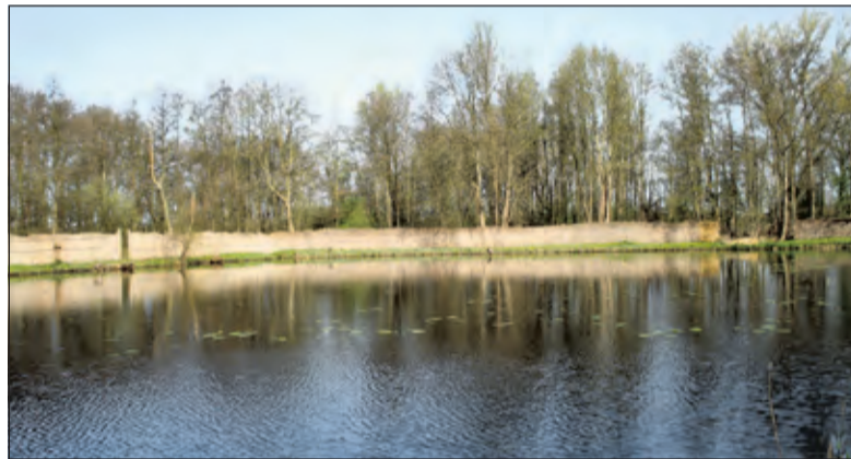
De eendenkooi is dit jaar nog 4 dagen onder begeleiding van een gids te bezoeken.

Dit jaar zijn er op 17, 18, 24 en 25 oktober nog rondleidingen in de eeuwenoude eendenkooi van Breukeleveen. In de afgelopen jaren heeft Natuurmonumenten met vele vrijwilligers de eendenkooi grotendeels gerestaureerd. Vroeger werden daar eenden voor de consumptie gevangen, maar sinds tientallen jaren gebeurt dat niet meer en wordt de eendenkooi in verband met de grote natuur en cultuurhistorische waarden door Natuurmonumenten in stand gehouden.