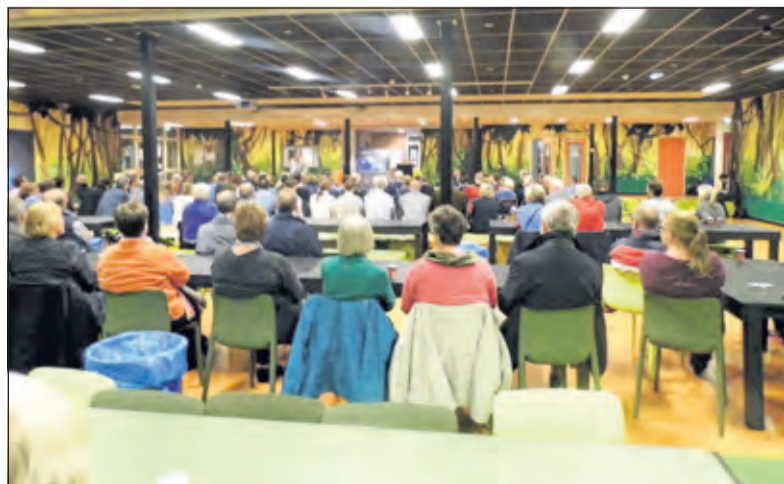
Voorlichting in de aula van het GroenhorstCollege.