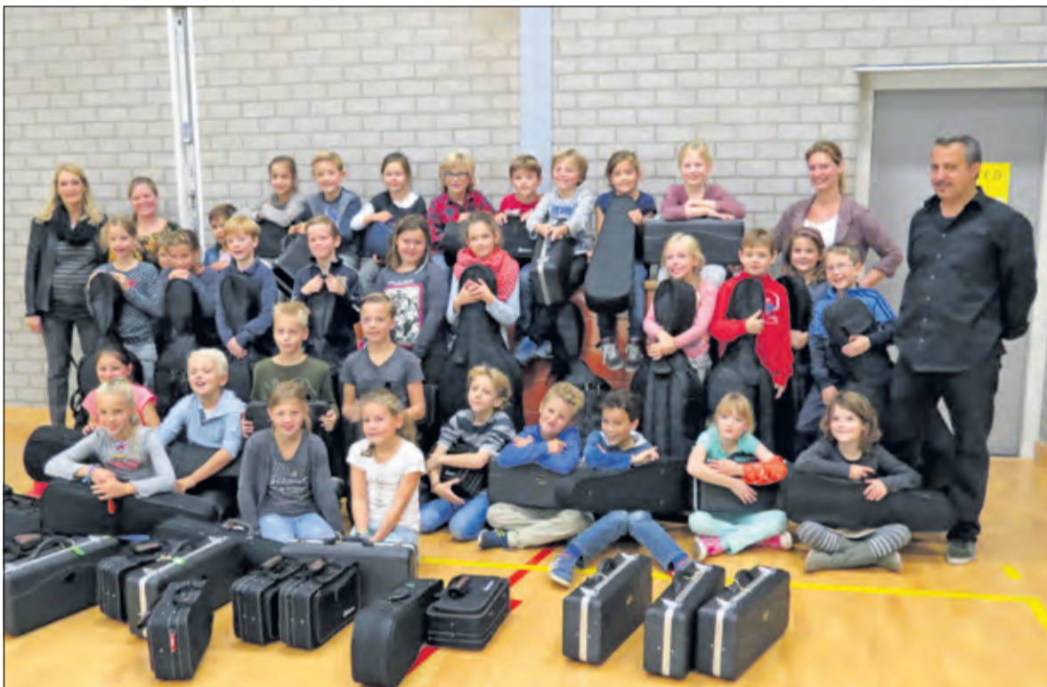
Leerlingen van groep 5 van de Julianaschool nemen de muziekinstrumenten in ontvangst.