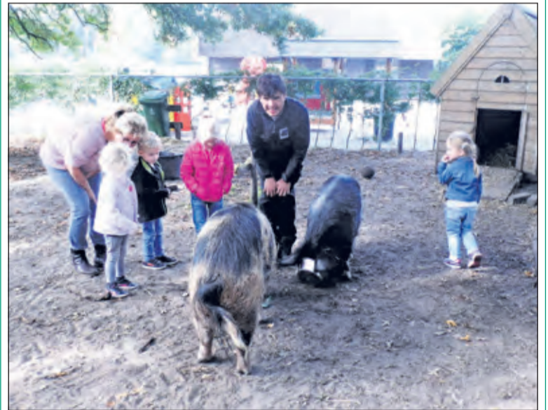
De buurtboerderij De Schaapskooi is nu ook elke zaterdag geopend.