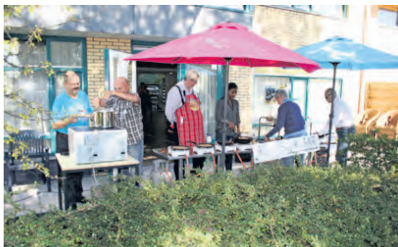
De buitenkeuken van de BoodschappenPlusbus vrijwilligers.

Terwijl de gasten aanschoven, werden hele stapels pannenkoeken opgediend, drie pannenkoeken naturel, ééntje met spek en dan weer drie naturel. Elke tafel kreeg zo een grote stapel. Alma: 'Eind augustus zijn wij al begonnen met de voor-