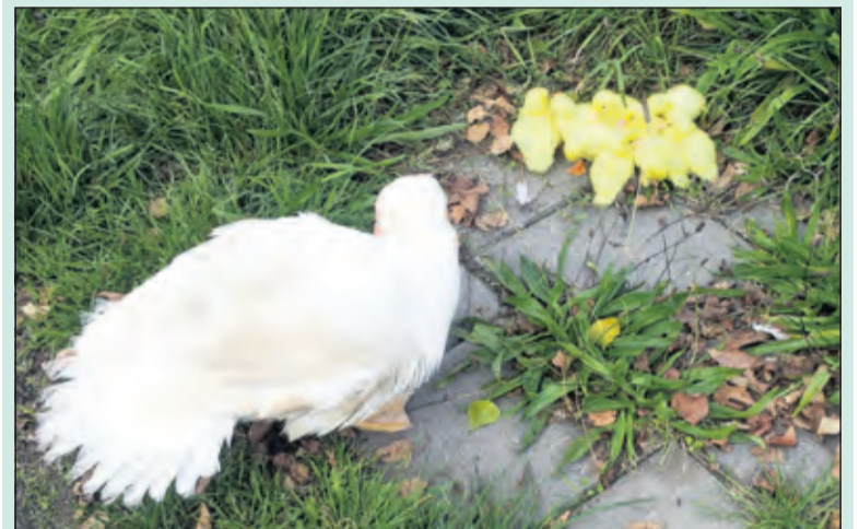
Eendenkuikens op de Ruigenhoeksedijk in Groenekan in oktober. Hoezo in de war?