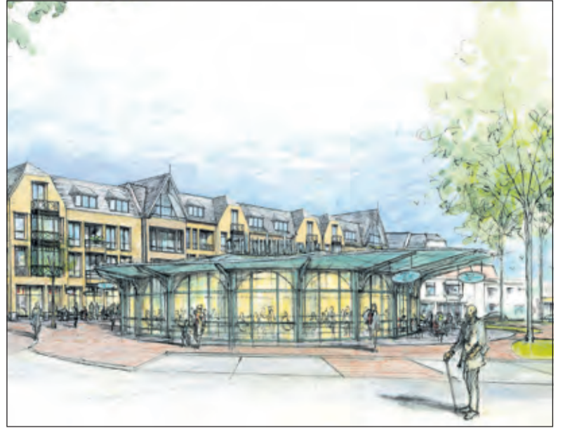
Een schets van het toekomstige Vinkenplein.