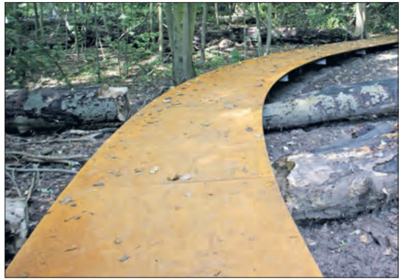
De Mathildebrug op Landgoed Oostbroek.

De winnaar wordt bekend gemaakt tijdens de Week van het Landschap, 17 en 18 oktober. Heeft u geen Facebook of Twitter? Mail dan naar bolscher@utrechtslandschap.nl. Meer informatie over de Week van het Landschap en de verschillende natuuractiviteiten vindt u op: www.utrechtslandschap.nl/week