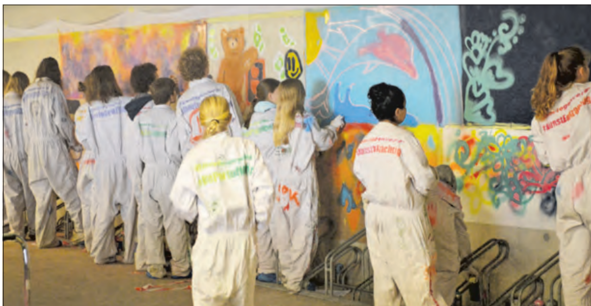
Leerlingen van de Werkplaats volgen een workshop graffiti.

Met het televisieprogramma Streetlab, een programma waarin ze elkaar en andere mensen uit testen in het kader van een sociaal experiment, strijden zij op 15 oktober om de felbegeerde ring.