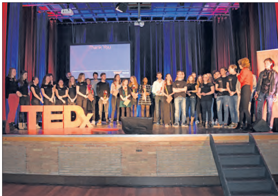
Alle HNL-organisatoren van de eerste succesvolle TEDxYouth in Bilthoven.

Volgend jaar krijgen ondernemers weer een nieuwe kans.