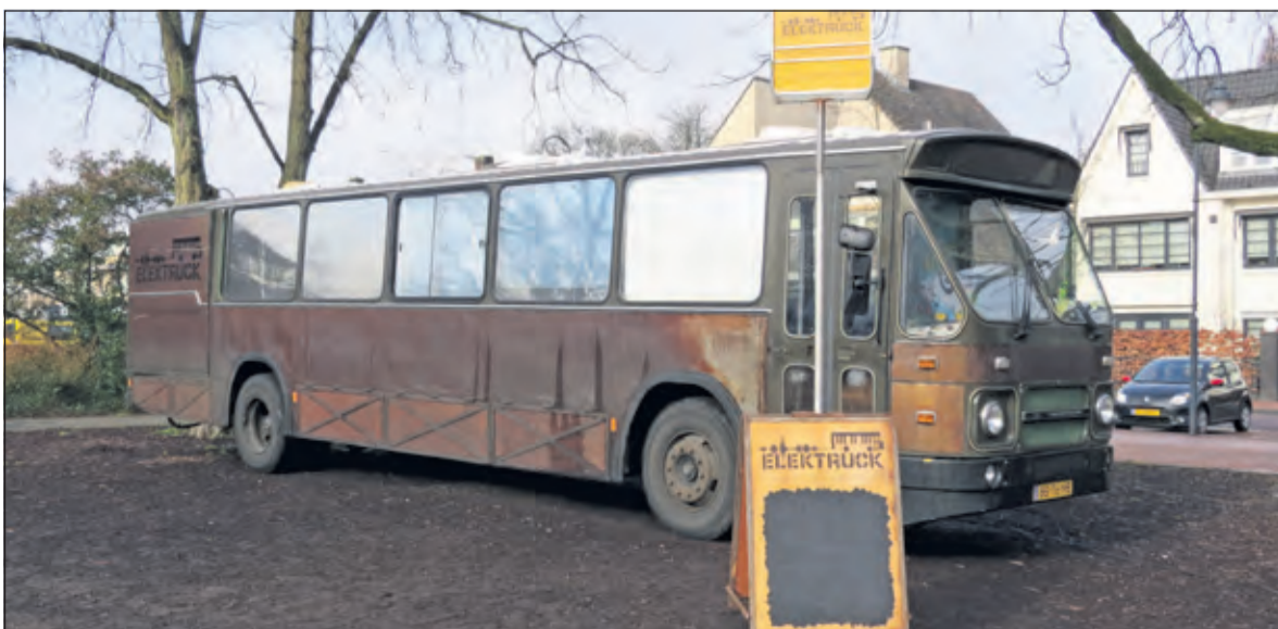
De Elektruck stond o.a. op 7 en 8 maart bij de Julianaschool in Bilthoven. Later volgen nog andere bezoeken aan basisscholen in deze gemeente.

Op verschillende schoolpleinen in de gemeente De Bilt is in de maand maart de Elektruck te vinden. Dit is een oude stadsbus die is omgebouwd tot een digitale muziekstudio. Leerlingen uit groep 7 en 8 gaan in de Elektruck aan de slag als echte beat creators en maken hun eigen muziektrack.