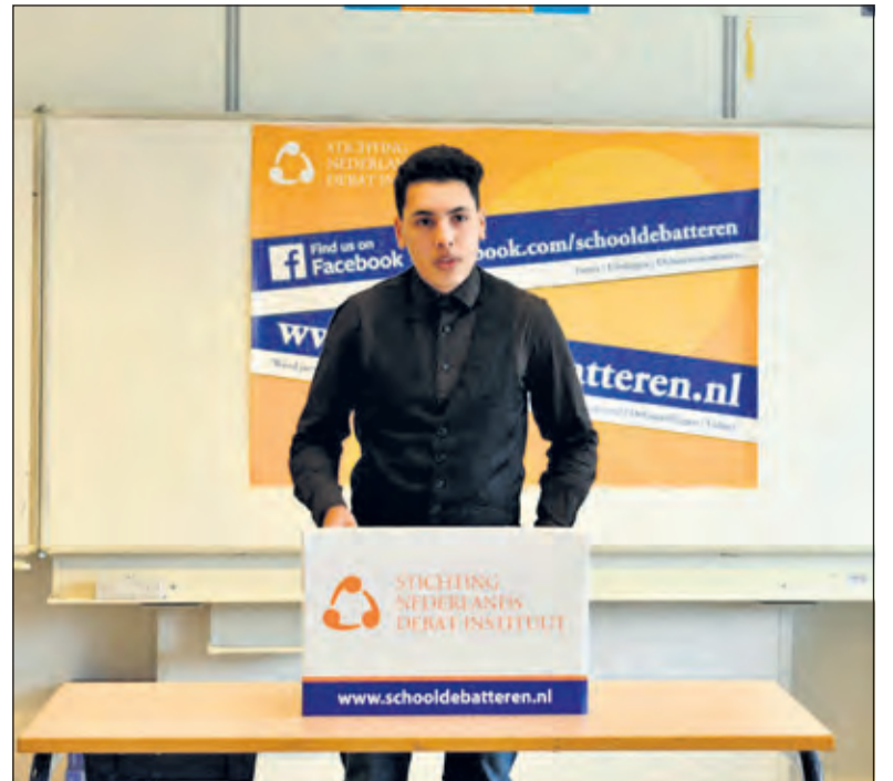
Vaardigheden die je met debatteren leert zijn onmisbaar in de 21e eeuw.

De aanvang is om 13.00 uur op PSG Antoni Gaudí te Purmerend. Het finaledebat vindt plaats van 16.25 tot 17.00 uur.