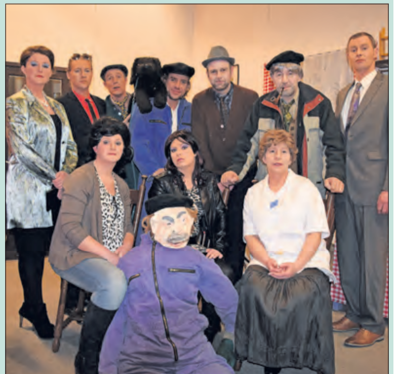
Op vrijdag 11 en zaterdag 12 maart wordt in het Dorpshuis in Westbroek de plattelandskomedie 'Zorgboerderij De Drie Gebroeders' nogmaals uitgevoerd. Een superleuke komedie waarbij de tegendraadse belangen van de broers steeds weer naar voren komen. [WE]