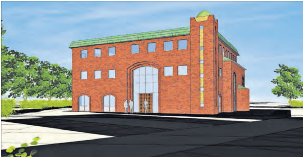
Schetsontwerp (sept. 2015) van de nieuw te bouwen moskee.