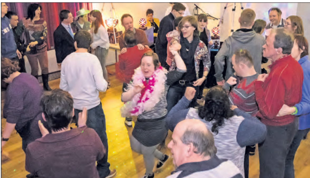
Dolle pret op de dansvloer van De Kroeg.

De eerstvolgende disco wordt georganiseerd op vrijdag 1 april (geen grap). [MD]