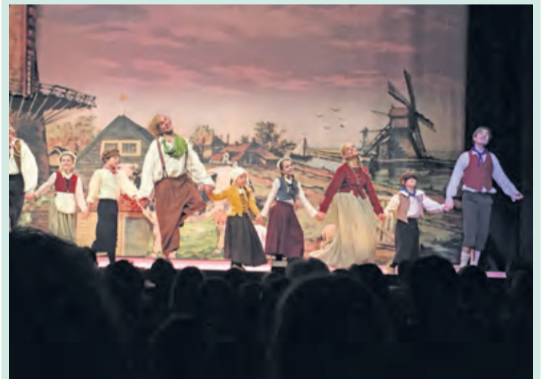
Op 19, 20 en 21 februari dansten en speelden 16 leerlingen van Theaterschool Masquerade en Dansschool De Bilt-Zeist mee met het professionele gezelschap het Ro Theater in de familievoorstelling De Gelaarsde Poes.