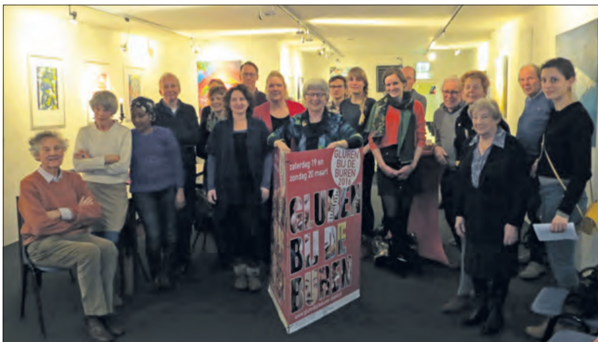
Artiesten en kunstenaars met woningbezitters bijeen in De Bilt.