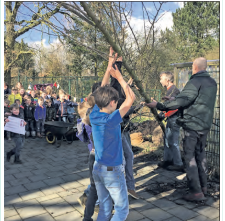
Over 60 jaar is dit boompje een boom geworden. Welke oud-leerlingen zullen zich dit moment dan nog herinneren.

Maandag 7 februari hield de Bosbergschool in Hollandsche Rading een vervroegde boomfeestdag die eigenlijk op 16 maart in Nederland gehouden wordt. Purple Monday is bij de Bosbergschool inmiddels een begrip. De school stimuleert kennis en interesse op het gebied van wetenschap en natuur. Een boom planten, als herinnering voor later past daar uitstekend bij. Het was een feestelijk moment wat mooi past in het feestelijke jubileumjaar in aanloop naar de reünie voor oud leerlingen en leerkrachten op 8 april. Meer informatie over de reünie kunt u vinden op www.debosbergschool.nl