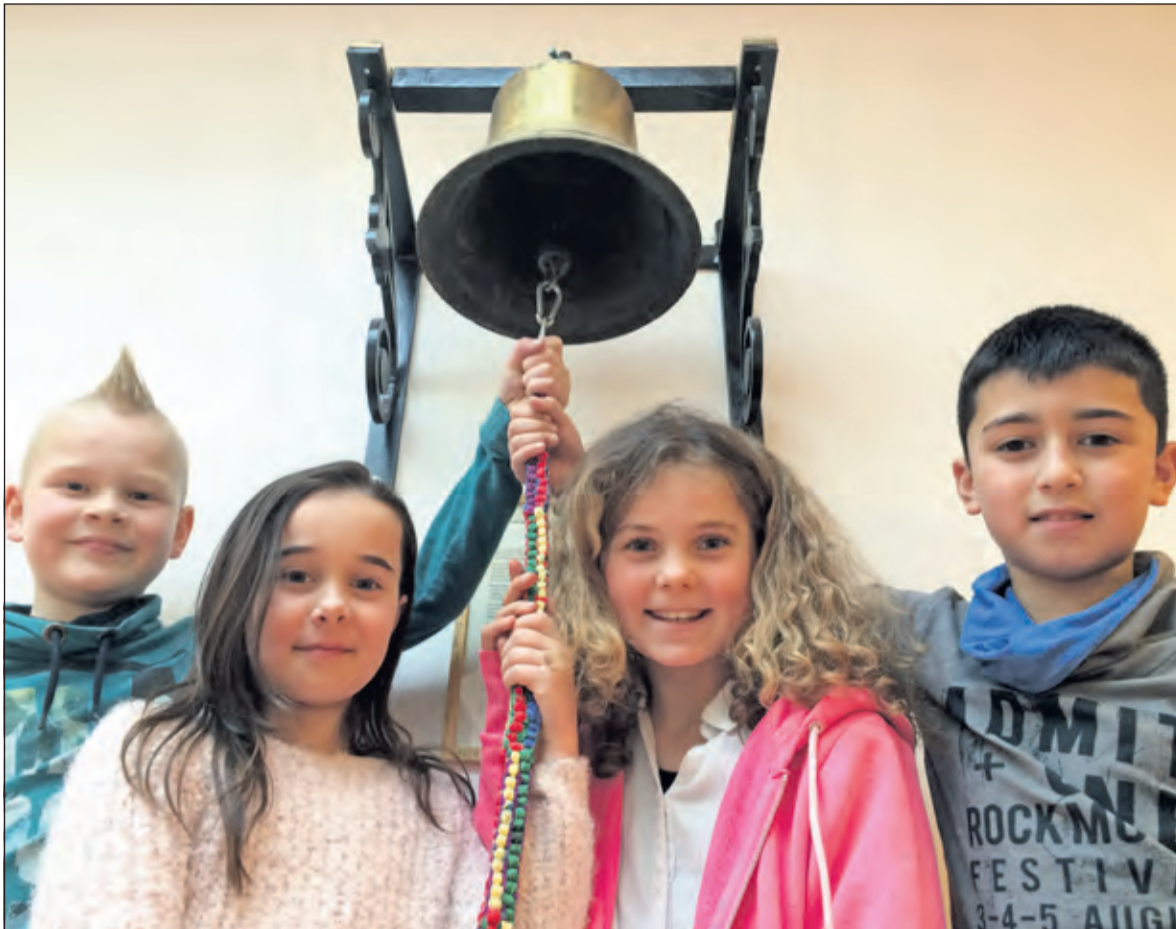
Donderdag 10 maart zullen zoveel mogelijk leerlingen van De Rietakker in één minuut door aan de oude in 2013 gerestaureerde schoolbel te trekken herrie maken.

Ruim 200.000 basisschoolleerlingen in Nederland, Curaçao, Afrika, Azië en Latijns-Amerika doen op donderdag 10 maart mee aan de jaarlijkse actie 'Wij trekken aan de bel'. Met behulp van toeters, bellen én hun stem gaan ze één minuut herrie maken op het schoolplein.