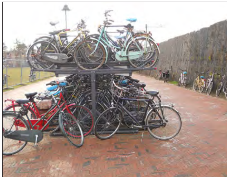
Er zijn meer fietsenrekken bij het station toegezegd.

De Fietsersbond vraagt medewerking van de inwoners van de Bilt om gevaarlijke en/of overbodige paaltjes te melden op debilt@fietsersbond.nl , zodat dit doorgegeven kan worden aan de gemeente.