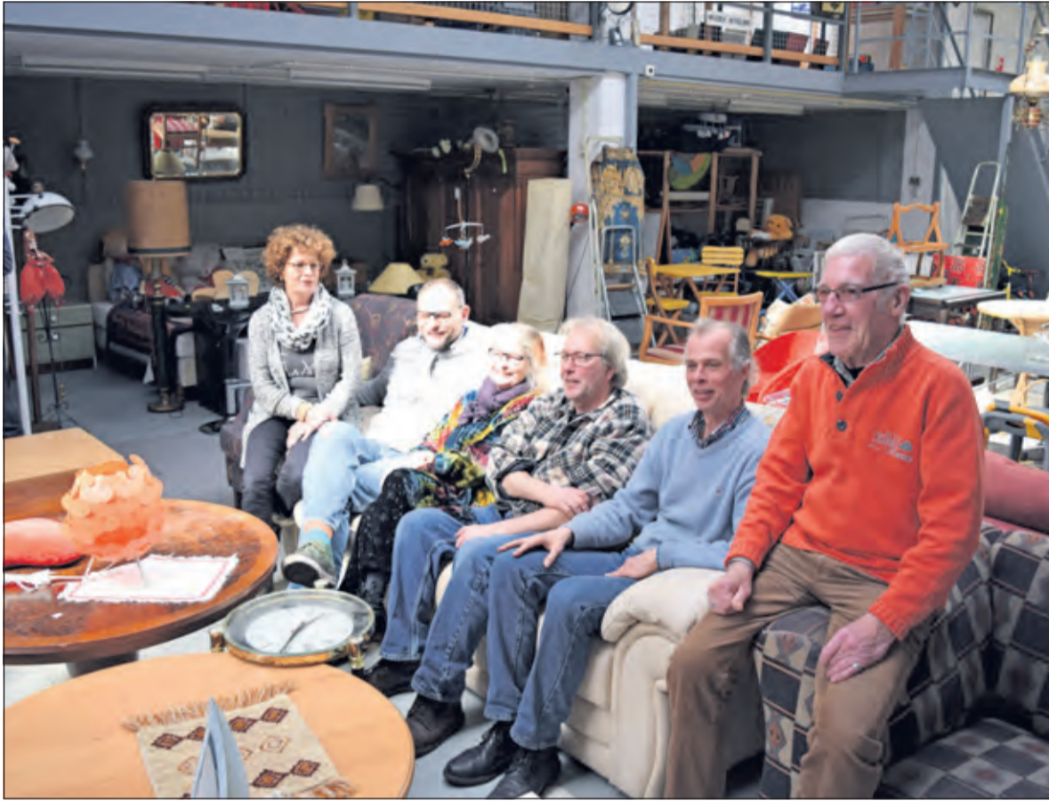
Emmaus draait voornamelijk op de inzet van vrijwilligers.

Dinsdag 15 maart viert Emmaus Bilthoven haar 35-jarig bestaan. Deze dag wordt op bescheiden wijze herdacht, maar wel met een feestelijk tintje. Iedere bezoeker zal namelijk worden verrast met een leuke attentie.