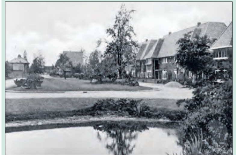
Woningen Park Arenberg op ongeveer 500 meter van de Werken bij Griffenstein. (Bij het artikel: 'Bouwen binnen verboden kringen'.)