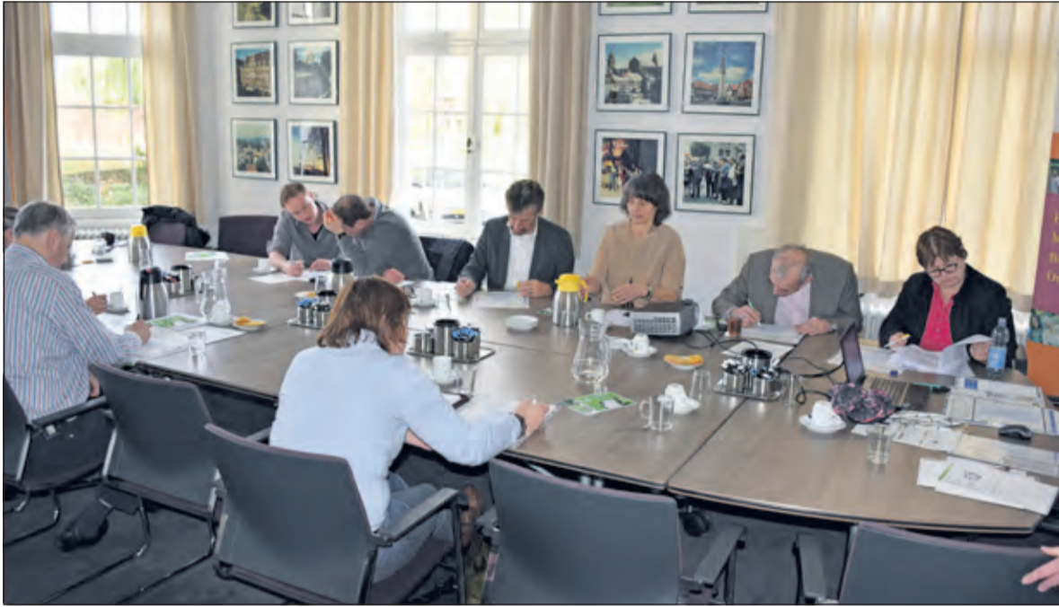
Druk bezig om tot een oplossing te komen voor je eigen organisatie.

Op donderdag 3 maart vond de tweede bijeenkomst plaats van Samen voor De Bilt, met als titel 'De waarde van afval'. Door, samen met aangesloten bedrijven en maatschappelijke organisaties, aandacht te schenken aan milieugerichte problemen hoopt Samen voor De Bilt het voortouw te nemen naar een gemeente zonder afval.