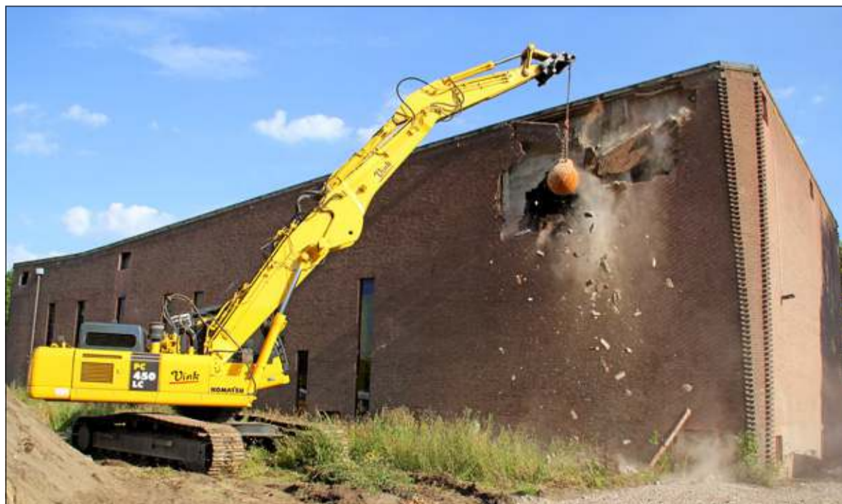
Vrijdag 4 juli om 9.00 uur begon de sloop van de Laurenskerk aan de Melkweg. Sloop was onvermijdelijk omdat het onderhoud van het gebouw door de krimpende Laurens-parochie niet meer was op te brengen. Op het terrein komt een complex van 56 appartementen. [HvdB]