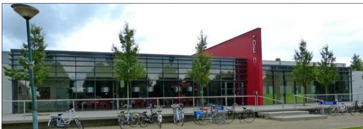
De gerenoveerde multifunctionele accommodatie 'De Dreef' in Aarle-Rixtel ontving een gêmeleerd gezelschap uit de gemeente De Bilt.

zalen, al naar gelang de behoefte, worden verkleind of vergroot. Ook door de aanleg van nieuwe vloersystemen kon aan de geluidseisen van NOC*NSF worden voldaan. Tijdens de rondleiding bleken er veel punten van overeenstemming