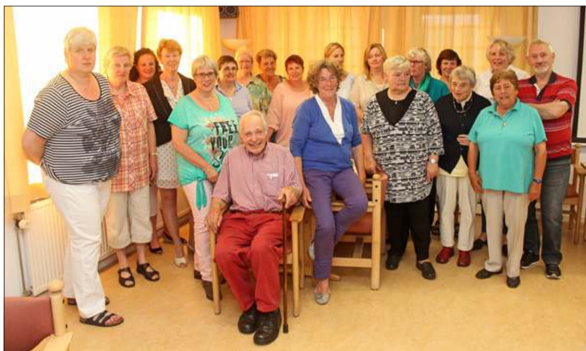
De aanwezige jubilarissen.