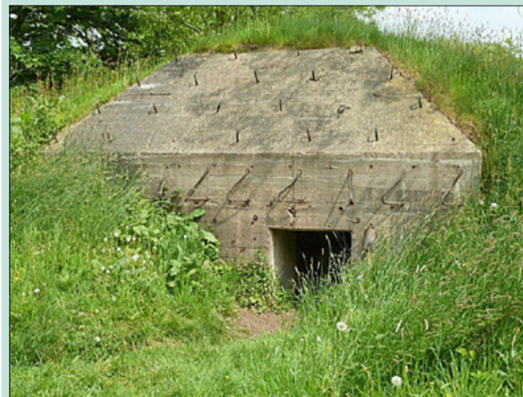
De tocht voert o.a. langs groepsschuilplaatsen.

Aanmelden kan op werkdagen van 14.00 tot 16.00 uur bij Gilde Utrecht, Lange Smeestraat 7, tel. 030 2343252 of per e-mail met vermelding van tel.nr. aan post@gildeutrecht.nl. Verzamelpunt hoort u bij aanmelding. Informatie over alle mogelijke rondleidingen vindt u op www.gildeutrecht.nl. Graag vooraf overleg als u kinderen mee wilt nemen.