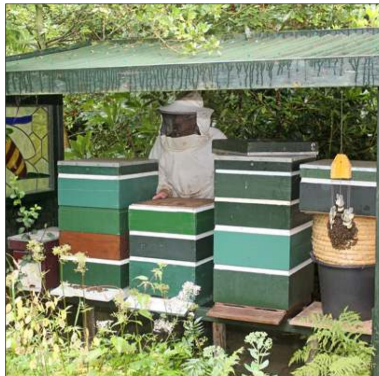
Zondag kunt u de imkerij 't Eiland in Groenekan bezoeken.

De toptijd is mei, juni, juli. Volgens Aart is alles dit jaar door de zachte winter en warm voorjaar zo'n drie weken eerder dan normaal. In de winter sterft een belangrijk deel van het volk. Behalve de Koningin blijven er nog zo'n 10.000 bijen over. Voor de imker betekent het winterseizoen, dat wordt gewerkt aan het onderhouden, herstellen en vernieuwen van de diverse spullen. Ook is het schimmelvrij maken van de diverse kasten en onderdelen daarvan essentieel. In het voorjaar kunnen dan gezonde bijenvolken de kasten bevolken.