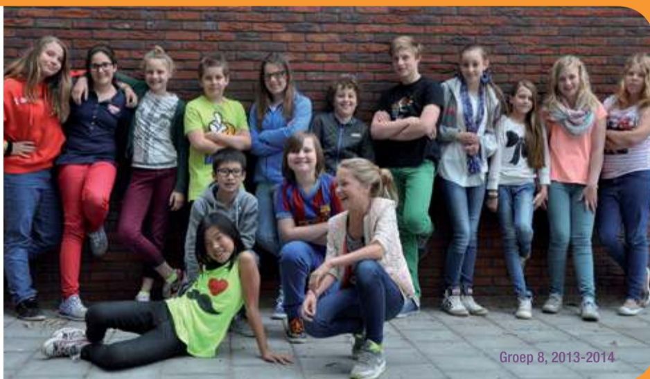
Groep 8, 2013-2014

Na 8 leerzame en gezellige jaren zijn we helemaal klaar voor de middelbare school!