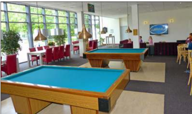
De gerenoveerde accommodatie heeft een ontmoetingsfunctie gekregen

met De Vierstee te zijn. De Dreef bleek na de renovatie veel meer een 'huiskamerfunctie' te kunnen vervullen dan ervoor mogelijk was.