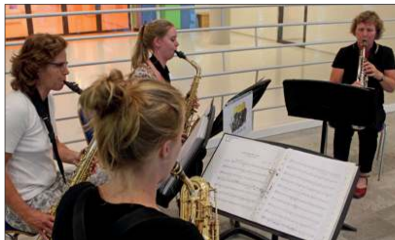
Saxofoonkwartet UltraSax verzorgde de opening van de expositie