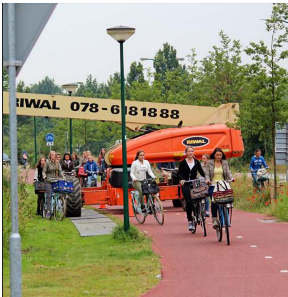
Een obstakel meer of minder deert de jeugd op weg naar school niet.

Hoograven, Abstede, Wittevrouwen, Tuindorp, Voordorp, Overvecht tot en met Zuilen. Dit jaar zijn er meer leerlingen uit Utrecht aangemeld dan de vorige jaren. Getalsmatig komt dit overeen met plm. 100 leerlingen. Een groot deel van deze leerlingen fietst dagelijks langs de nieuwe rotonde op de Groenekaneweg. [HvdB]