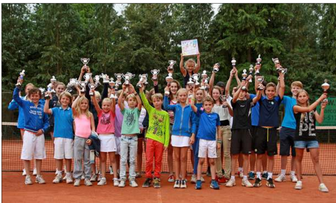
De prijswinnaars van het 41e Open Jeugdtoernooi van tennisvereniging Meijenhagen die een week met tal van mooie en spannende wedstrijden beleefde. De deelnemers hadden veel geluk met het weer, want er kwam weliswaar een enorme plensbui, maar die viel net na de laatste finalepartijen. Dit jaar kon ook de jongste jeugd meedoen met een tenniskids event: partijtjes op een klein veld om zo op een speelse manier kennis te maken met het wedstrijdtennis. (Henk Zandvliet)