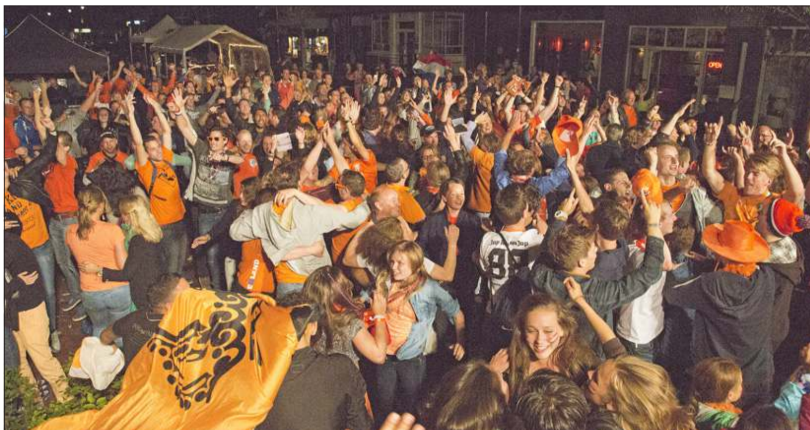
Vreugde bij de toeschouwers op het Biltse Museumplein.