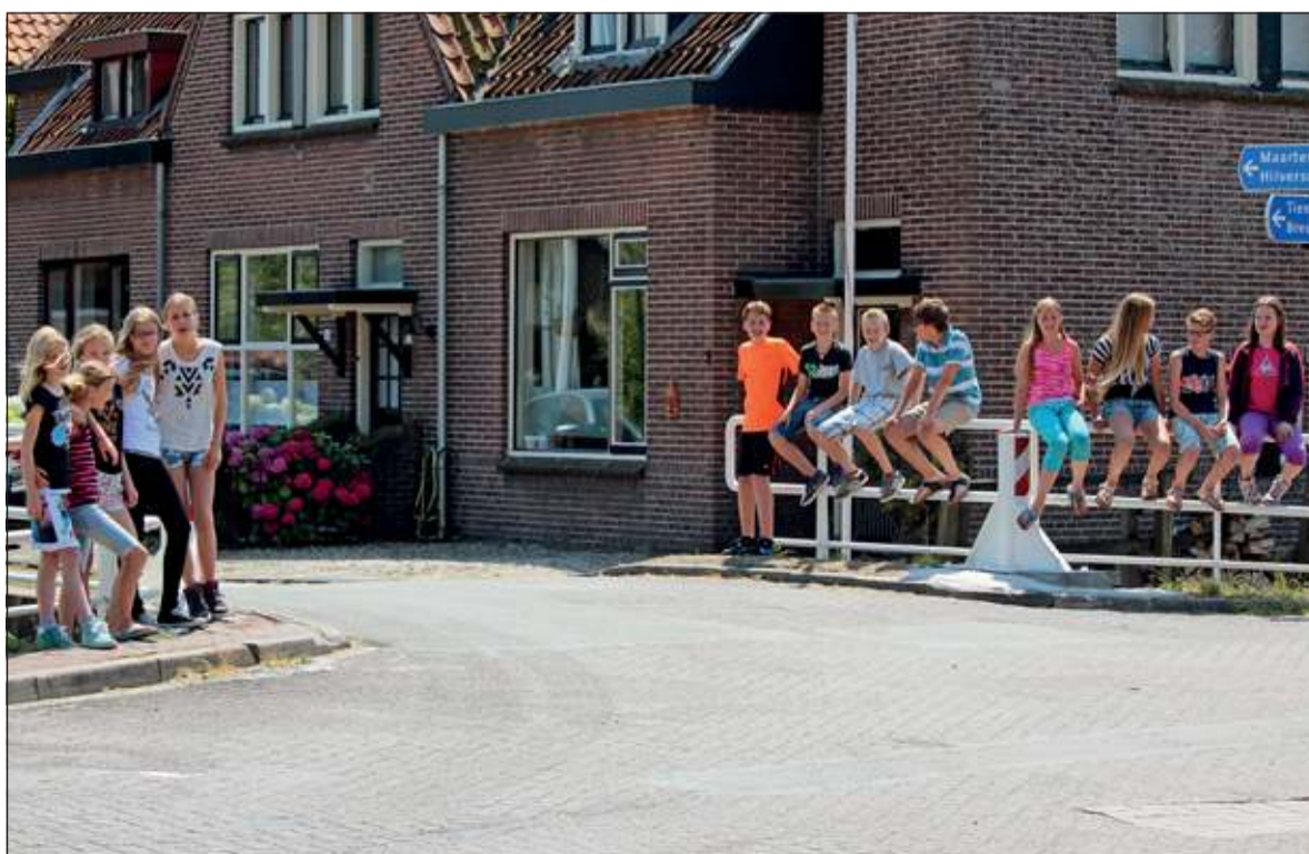
Groep 8 van 't Kompas waaert als toekomstige brugklasser meestal meerdere richtingen uit (Maartensdijk, Bilthoven, Utrecht of Maarsse).