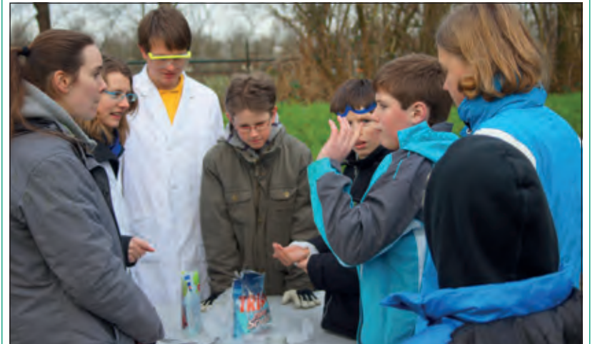
Wat je voor spannends kan doen met zilversoda vind je uit bij scouting.

De komende weken zijn de welpen (7 tot 11 jaar), de scouts (11 tot 15 jaar) en de explorers (15 tot 18 jaar) weer bezig met allerlei scoutingactiviteiten zoals kamperen, spelletjes spelen, speurtochten lopen en nog veel meer. Mocht u interesse hebben in scouting, voor uzelf als leiding of voor uw kind, dan bent u van harte welkom. Kom op zaterdagochtend gerust een keer langs bij het clubhuis aan de Dierenriem, of neem contact op via de website van de groep www.aggermartini.nl .