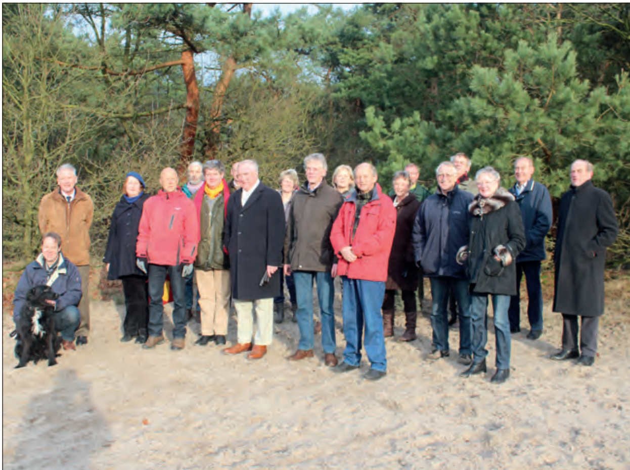
Op initiatief van het bestuur van De Vrienden van De Biltse Duinen kwamen veel leden en reflectanten jl. zaterdagochtend bij elkaar voor het uitwisselen van gelukwensen en om afspraken te maken over de laatste stappen die nodig zijn om dit traject van inmiddels 25 jaar naar ieders tevredenheid af te ronden.

De Raad van State heeft woensdag 9 januari de gemeente De Bilt in het gelijk gesteld in het aanwijzen van de Biltse Duinen als gemeentelijk landschapsmonument. Met de monumentenstatus is elke handeling of activiteit die de beeldkwaliteit en/of de landschappelijke of cultuurhistorische waarden van het gebied aantast, verboden.