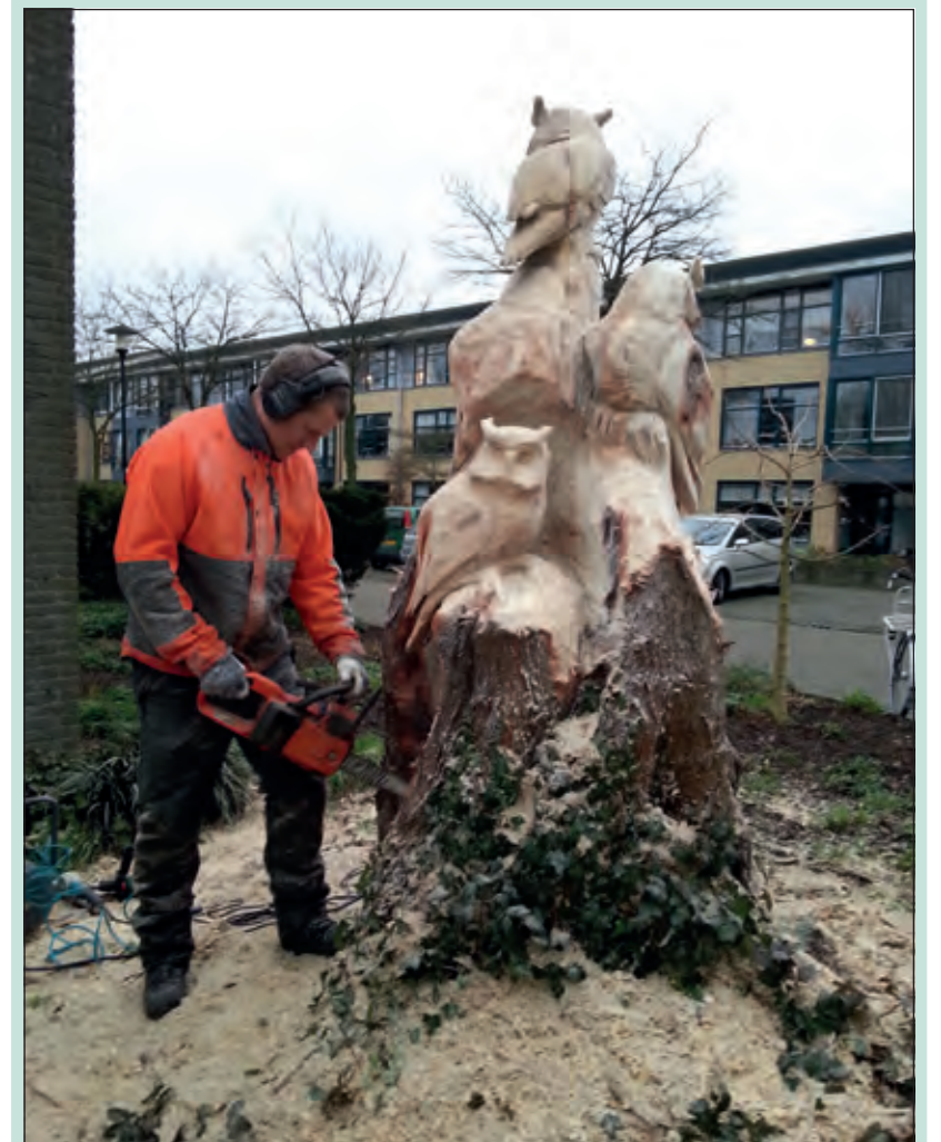
Een bezienswaardigheid op zich is dit kunstwerk, dat gemaakt is uit het restant van een omgekapt boom aan de Merellaan in Maartensdijk.

Op de hoek van de Nachtegaallaan en de Merellaan in Maartensdijk staat in de tuin voor het huis van de familie Mekel sinds vorige week een prachtig sculptuur, een met kettingzaag en beitel geschapen beeldhouwwerk van een uilenfamilie, kijkend naar het passerend verkeer en de spelende schoolkinderen.