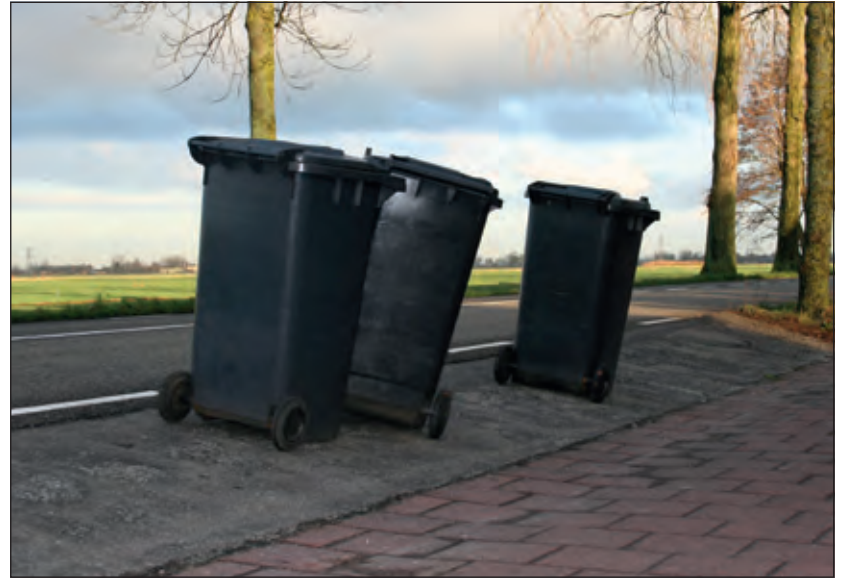
Situatie na het legen.

De inzamelaar heeft de niet geleegde containers vrijdag alsnog geleegd. Ook is afgesproken dat ze de containers overdwars terugplaatsen na het legen en op een veilige plek zetten. Dus niet te dicht bij de rijbaan of voor een oprit. Als er een flinke wind staat en de kans op omwaaien heel groot is, zullen zij de containers plat op de straat leggen.'