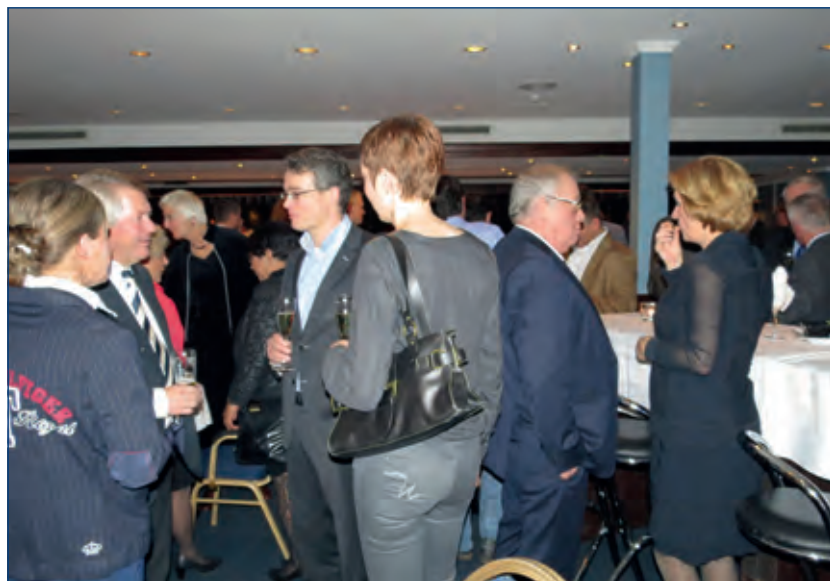
In een sfeervolle ambiance worden wensen uitgewisseld.

'De omzet van webwinkels is met negen procent gestegen. Dat gaat echter wel ten koste van de retail winkelverkoop. Cijfers uit de Conjunctuurenquête van de Kamer van Koophandel tonen aan dat in Midden Nederland meer bedrijven hun omzet zien dalen dan stijgen.' Haaksman wenst desondanks iedereen een gezond en succesvol 2013.