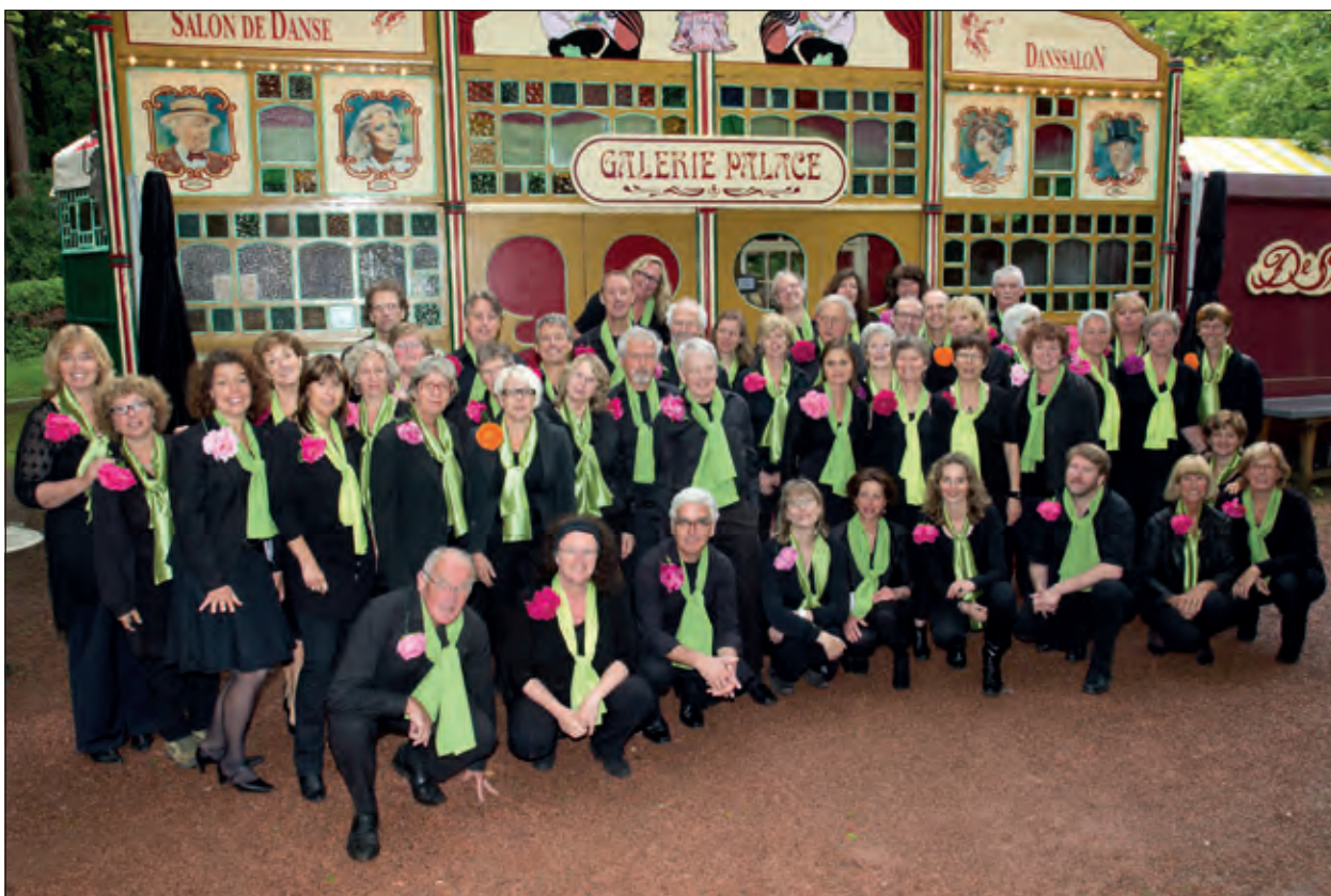
Valsch en Gemeen treedt op zaterdag 19 januari op bij WVT.

Grande Finale van het muziekweekend in het kader van 900 jaar De Bilt op zaterdag 22 juni.