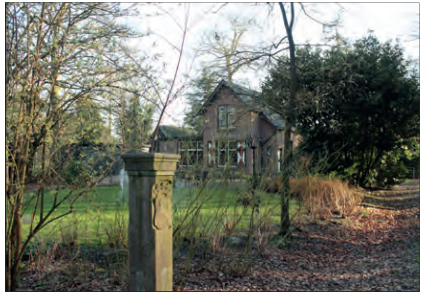
Grenspaal 12 staat bij restaurant Boschoord tussen Cronebos (Hilversum) en Boswachterij de Vuursche (Baarn) en vormt de grens tussen Hilversum en Maartensdijk.

Het wat mystieke pand bestaat al vanaf 1911 dicht bij de Hilversumse golfbanen en is open op aanvraag. Het hoort sinds 10 jaar bij Café Restaurant De Lage Vuursche van familie van Oostrum aan de Dorpsweg 2 in het gelijknamige dorp. Begin dit jaar is Boschoord Bistro door de gemeente De Bilt en de gemeente Baarn aangewezen als locatie voor huwelijksvoltrekking en partnerregistratie. Dus wilden we eens weten of daar ook gebruik van werd gemaakt. Het antwoord: 'Hoewel het nog lang niet overall bekend is dat er hier ook getrouwd kan worden, zijn we toch tevreden met het aantal van meer dan een half dozijn trouwpartijen'.