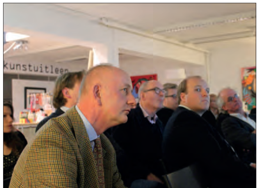
Bestuurders, ondernemers, winkeliers, politici en vertegenwoordigers van de pers waren aanwezig.

Over de realiseerbaarheid van de plannen was de BOF-voorzitter helder: 'Alles staat of valt met de bereidheid van de eigenaar het achterstallig onderhoud weg te willen werken en dit te converteren naar tijdelijke renovatie. Het merendeel van de aanwezigen noemde de voorstellen goed en goed doordacht maar zag ook nog veel beren op de weg bij de realisatie ervan.